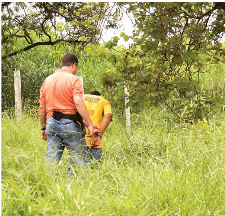
Momento em que o adolescente e policiais procuravam a arma