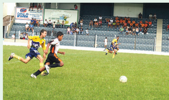
Equipe mirim de Lençóis fica com a prata e Itapeva com o ouro

A I Copa Internacional de Futebol Mirim e Infantil, promovida pela LLEFA (Liga Lençoense de Futebol Amador) reuniu entre os dias 23 e 28 em Lençóis, quinze equipes, sendo oito na categoria infantil e sete na mirim das cidades de Lençóis, So-