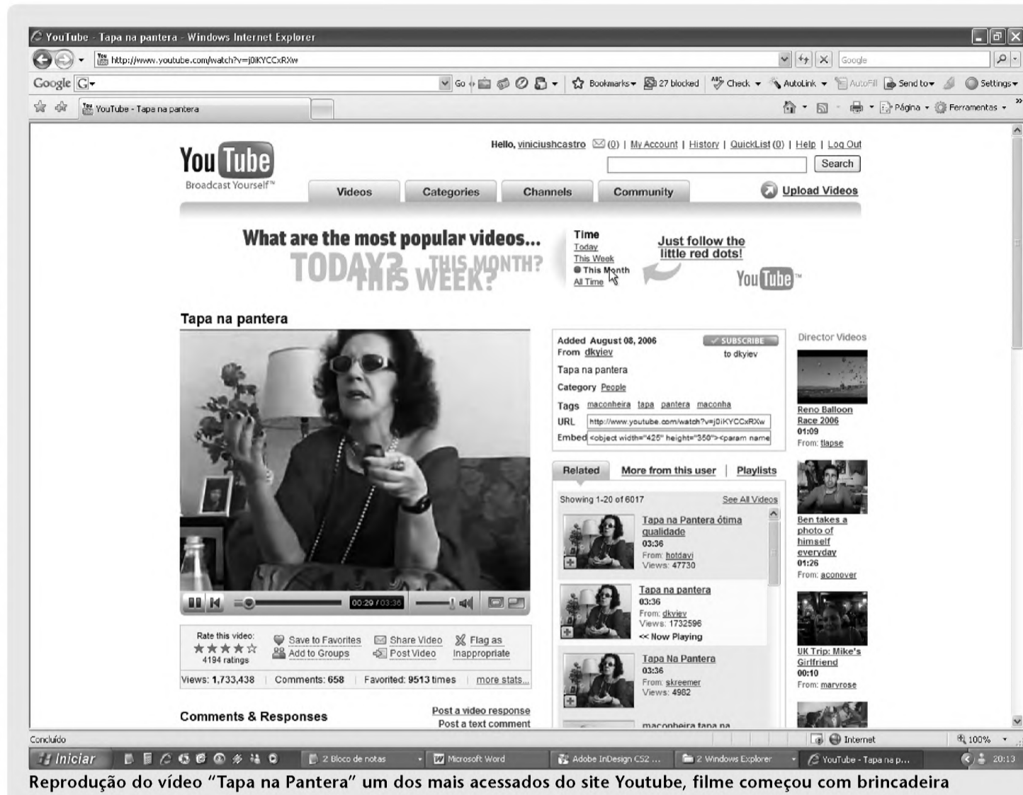
Reprodução do vídeo "Tapa na Pantera" um dos mais acessados do site Youtube, filme começou com brincadeira

Saiba como colocar seu vídeo no ar e transformá-lo em um sucesso da internet; site interativo permite criação de canais personalizados, troca de mensagens e participação em torneios de vídeo