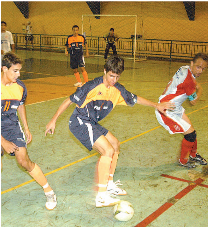
Lance da partida entre o AC Black/Expressinho e FIB/Bauru

A Copa Cidade do Livro foi iniciada no sábado 27 com o empate do AC Black/Expressinho em 4 a 4 com a FIB Futsal de Bauru. No primeiro tem-