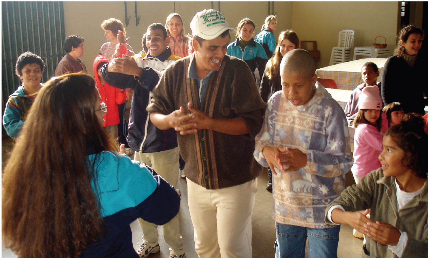
Na Apae de Macatuba, os alunos aproveitaram a manhã fria de ontem para dançar e esquentar o corpo no dia do desafio