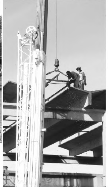
Na manhã de ontem, equipes retiravam as telhas do prédio que vai abrigar o teatro; no detalhe, guindaste é preso a peça que pesa 9,6 toneladas

no final de 2008. "Para que o teatro fique equipado com tudo que se pensa, ainda vai levar um tempo. Mas a população já vai poder utilizar o prédio no final do ano que vem", finaliza.