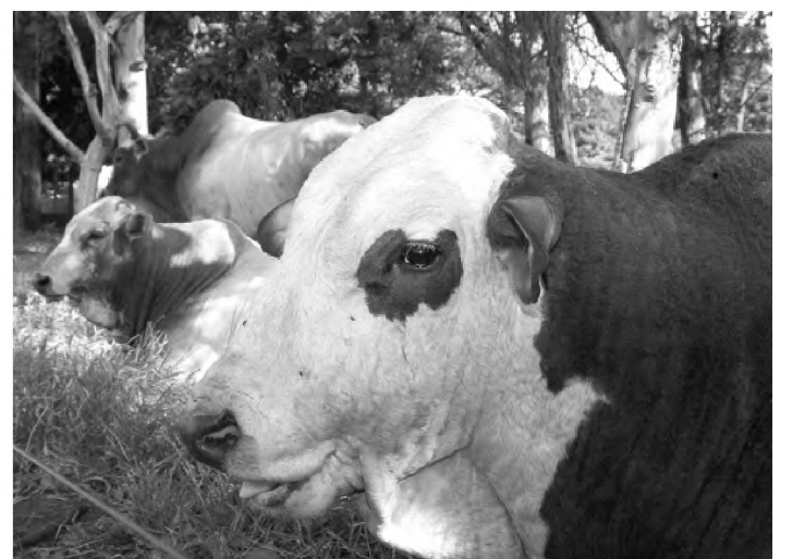
Termina hoje o prazo para a vacinação de bovinos e bubalinos

entre R$ 1,20 e R$ 1,30. A vacinação pode ser feita pelo próprio criador, desde que ele siga as orientações de transporte e armazenamento. Até agora, a secretaria da Agricultura ainda não divulgou nenhuma parcial sobre a campanha.