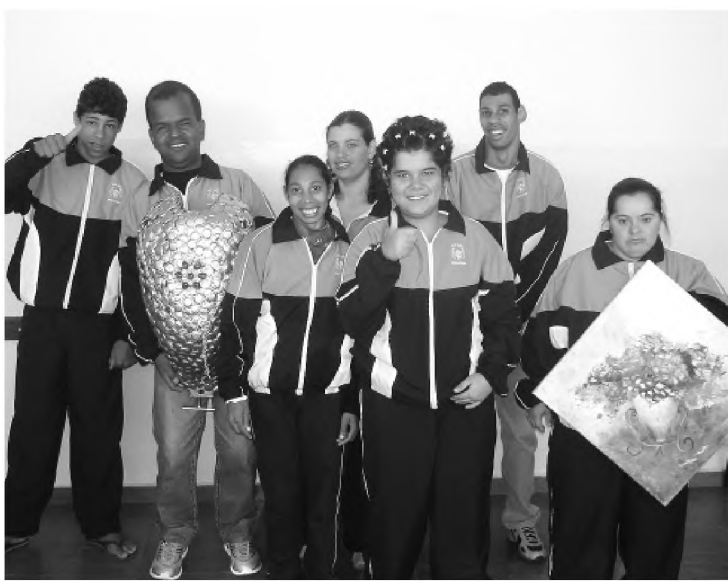
Os estudantes da Apae de Macatuba trouxeram quatro troféus