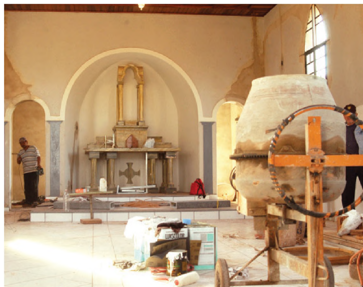
Em processo de restauro, Capela do Corvo recebe missas nos dias 10 e 13 de junho em louvor a Santo Antonio

No dia 13 de junho, dia de Santo Antonio, tem missa com a bênção dos pães às 11h, na capela do Corvo Branco. Às 19h, tem a procissão com a imagem de Santo Antonio, saindo da praça das Missões, na Vila Cruzeiro até a igreja de Nossa Senhora Aparecida e seguida de missa na matriz.