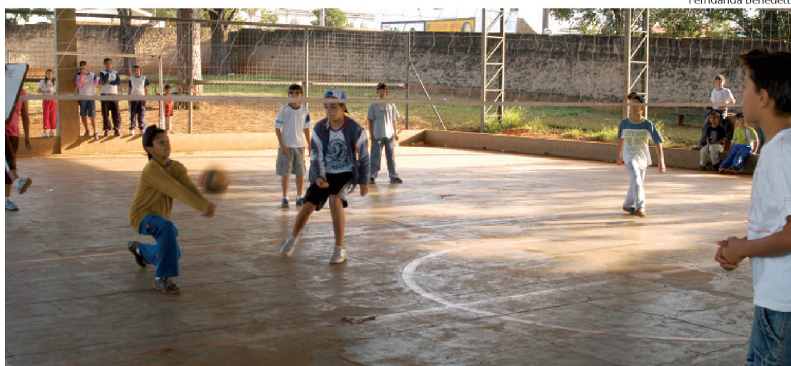
Na escola Dr. Paulo Zillo, foram programadas várias atividades esportivas durante todo o dia

A diretoria de Esportes de Agudos disse que só fornece os dados hoje.