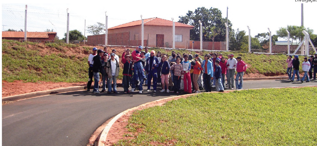
Em Borebi, dentre muitas atividades, as crianças aproveitaram o dia para uma caminhada