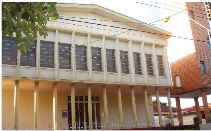
A renda da festa de Santo Antonio será usada na reforma da igreja

Segundo o padre José Raimundo de Carvalho, pároco em Macatuba, a festa este ano terá dois dias a menos que no ano passado, mas a estrutura será a mesma utilizada em