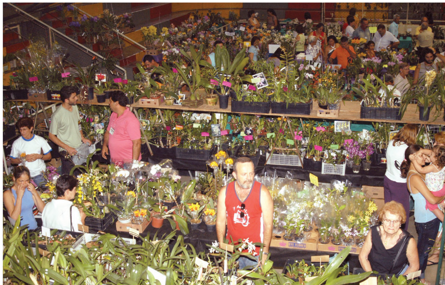
ORQUÍDEAS De sexta-feira a domingo, o Csec (Clube Social, Esportivo e Cultural) de Lençóis Paulista sediou a 5ª Exporquídea. O evento, organizado pelo Caolp (Clube dos Amigos Orquidófilos de Lençóis Paulista), atraiu dezenas de expositores do estado de São Paulo e também de outros estados e milhares de pessoas que vem conferir de perto o aroma e beleza das orquídeas.

Apesar do Jardim Primavera estar com sua condição jurídica regularizada enquanto loteamento, muitos de seus moradores ainda terão algum caminho pela frente antes de ter em mãos a escritura definitiva de suas residências. A prefeitura tem que analisar caso a caso para deixar os proprietários em condições jurídicas de retirar o documento. Menos de um mês depois da entrega das certidões, aproximadamente 100 pessoas já procuraram a diretoria de Assistência e Promoção Social para dar andamento no processo. Aproximadamente 40 famílias já estão com o caminho aberto para registrar as escrituras. Outras vão demorar um pouco mais para conseguir a regularização de suas residências. ► Página A2