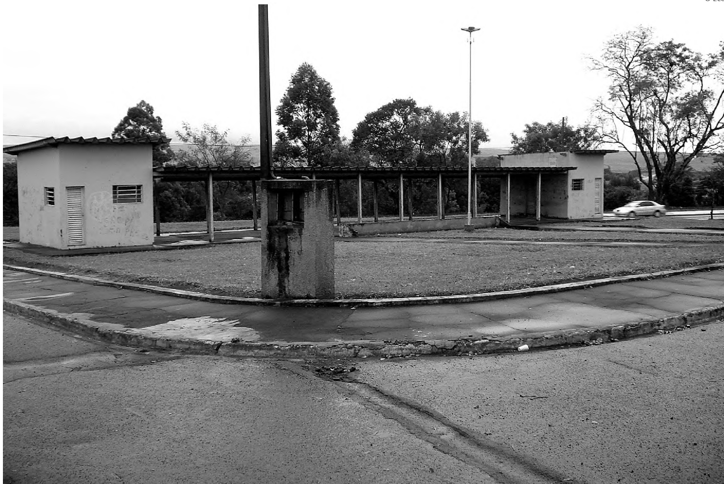
Terreno onde vai ser construído mais um prédio público em Macatuba, obra está orçada em R$ 100 mil e começa em agosto