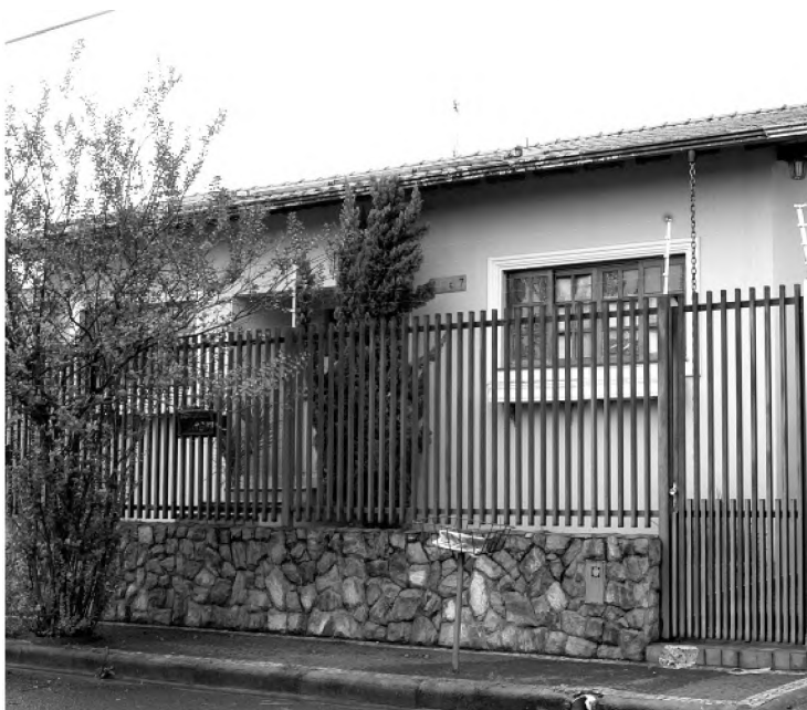
Casa na rua 13 de Maio, onde morava o empresário

Entre os bens leiloados hoje estão uma propriedade agrícola, uma chácara, dois