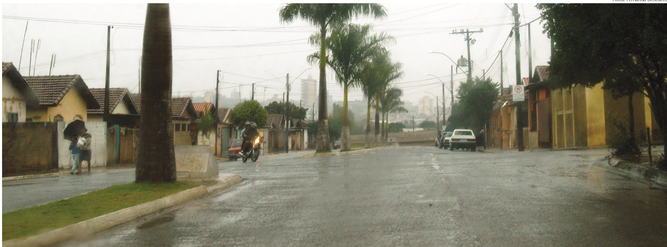
Muitas famílias do Jardim Primavera terão dificuldades para fazer as escrituras; enquanto isso, a maioria já deu entrada na documentação e aguarda a liberação por parte do cartório