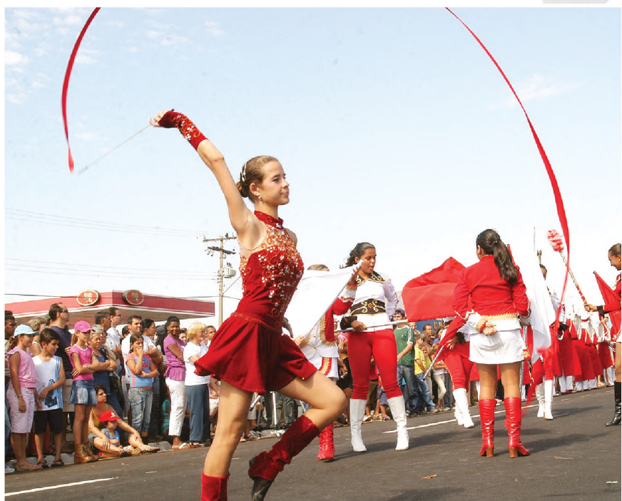
Flashes do desfile de bandas na avenida Carvalho Pinto, domingo, em Agudos