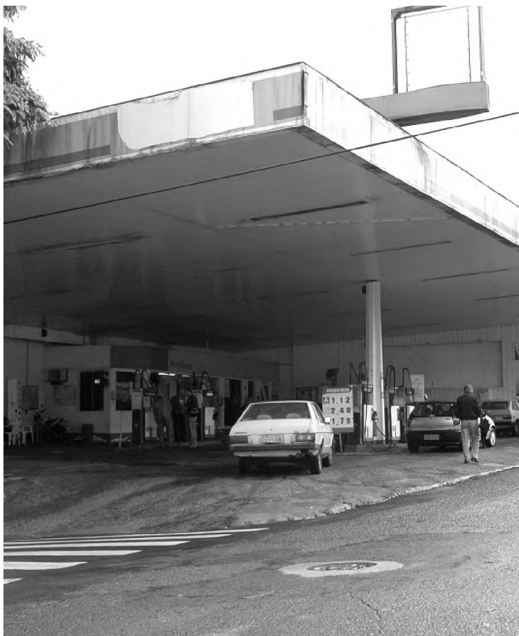
O imóvel que abriga o posto Vimabe vai a leilão em agosto

O processo de falência da Carani Veículos Ltda começou no ano de 1996 e foi concluído em junho de 1997. Desde a chegada da família Carani a Lençóis Paulista, no final da década de 20 e começo da década de 30, que a dedicação aos automóveis foi marca re-