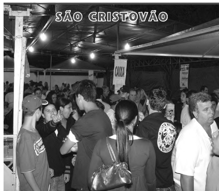
Na noite de domingo, a quermesse estava lotada

Ao todo, o grupo Carani possui cerca de 70 credores. Os 31 ex-funcionários que entram na Justiça para receber seus direitos trabalhistas começaram a ser pagos em novembro do ano passado. Os funcionários têm o direito de receber primeiro. Depois, serão pagas as dívidas com a União, Estado, Município e outros credores.