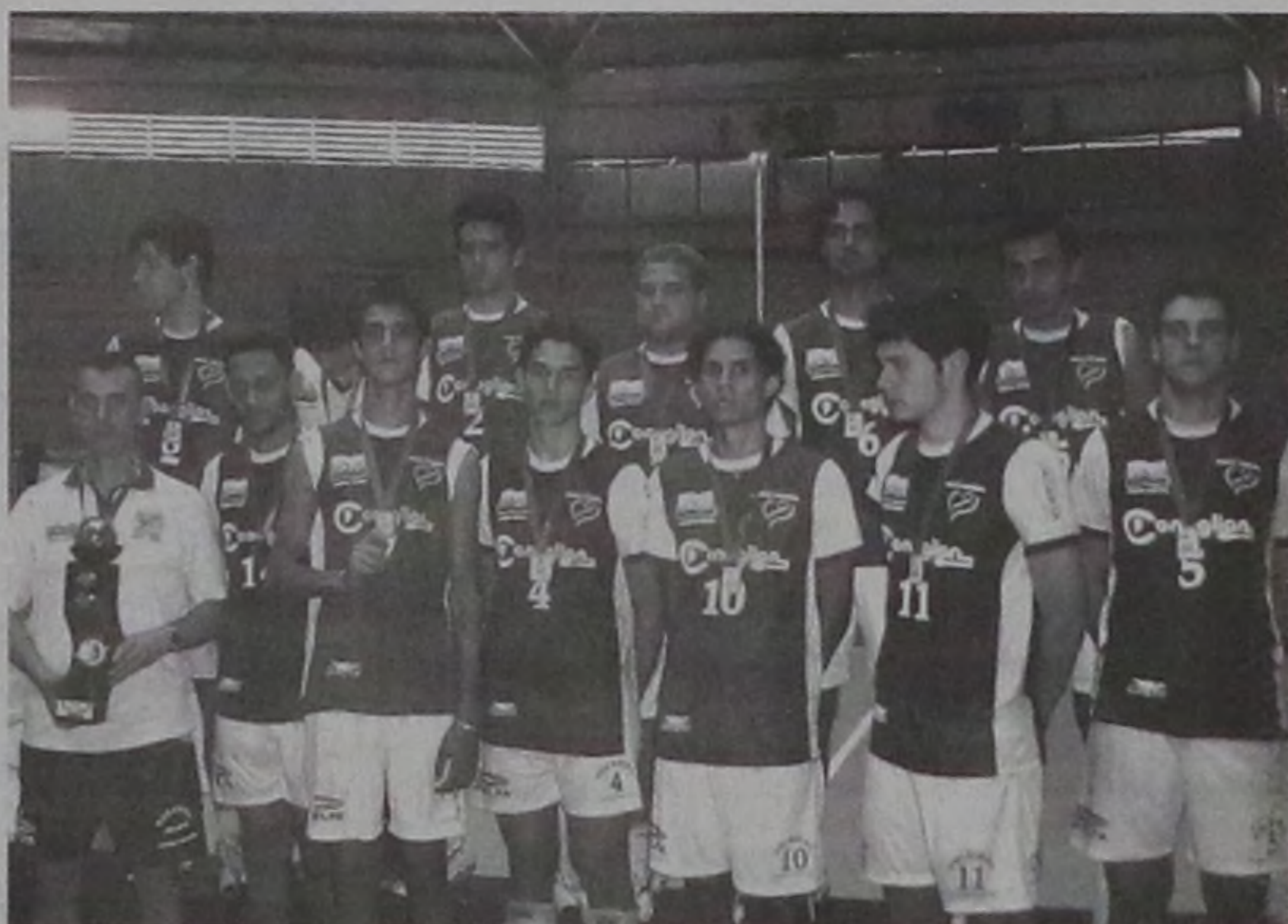
Equipe de vôlei Coneglian/Santa Catarina, vice-campeã estadual