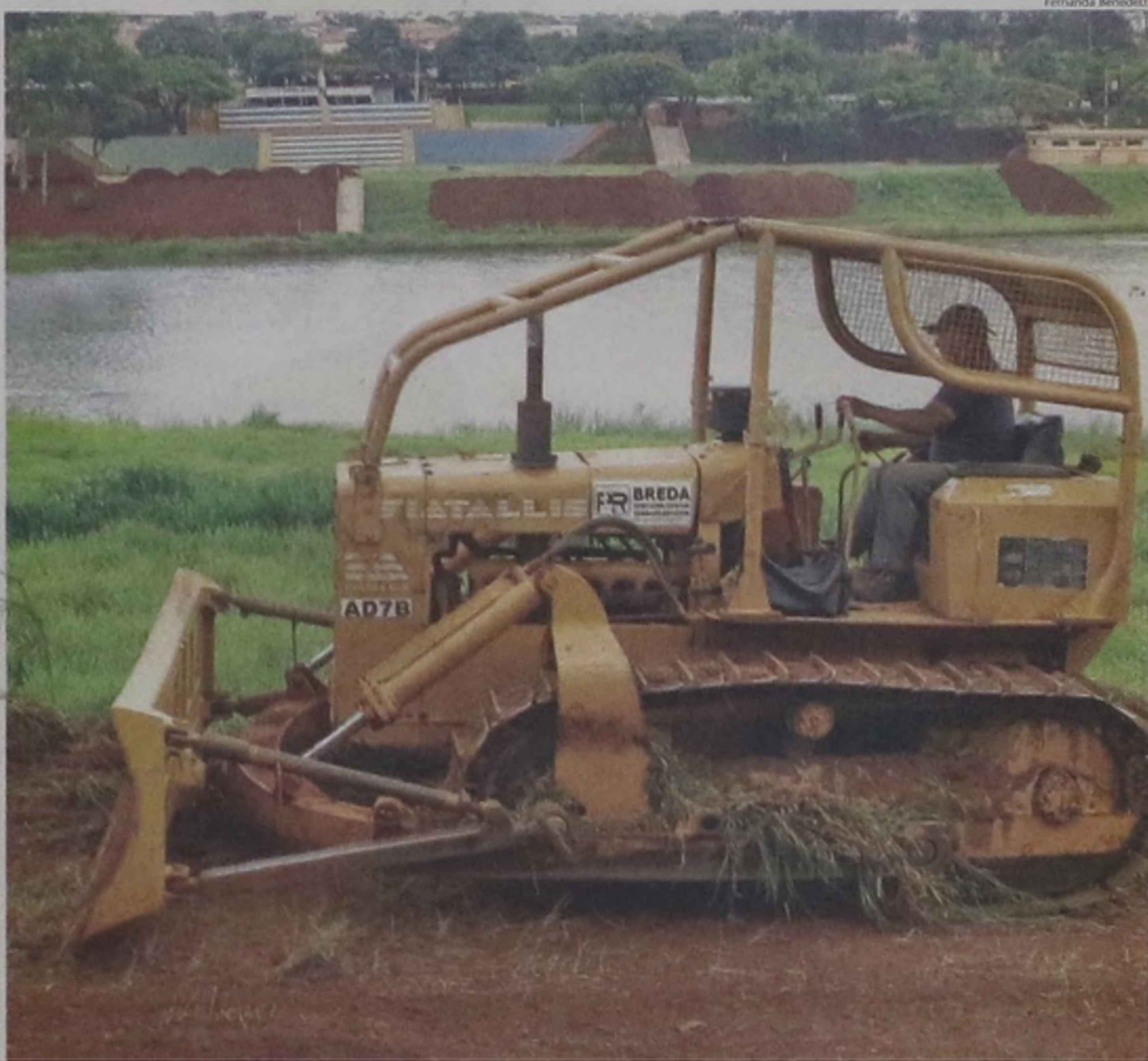
Vista geral da área do Lago da Prata que vai ganhar calçadão e ciclovia; projeto é antigo e começa a ganhar forma