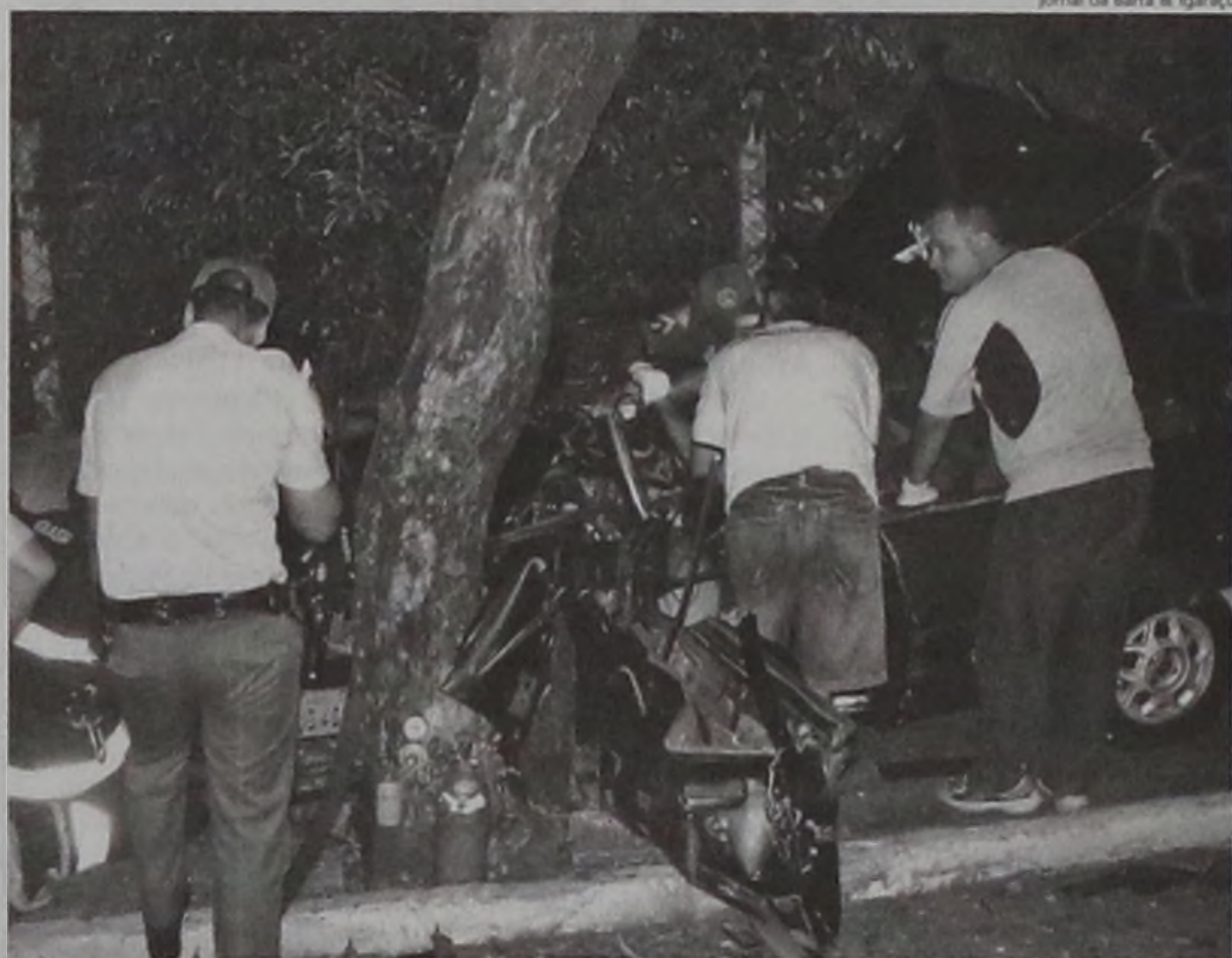
Acidente em Barra Bonita deixou dois rapazes feridos, motorista foi transferido para Jaú

Ainda no sábado, às 21h, um outro acidente com vítima foi registrado em Barra Bonita. Na avenida Pedro Ometto, um Ford/Corcel II e um Chevette bateram forte no cruzamento com a rua Ivan Fleury Meireles. Uma placa de sinalização foi arrancada do solo. Um ou-