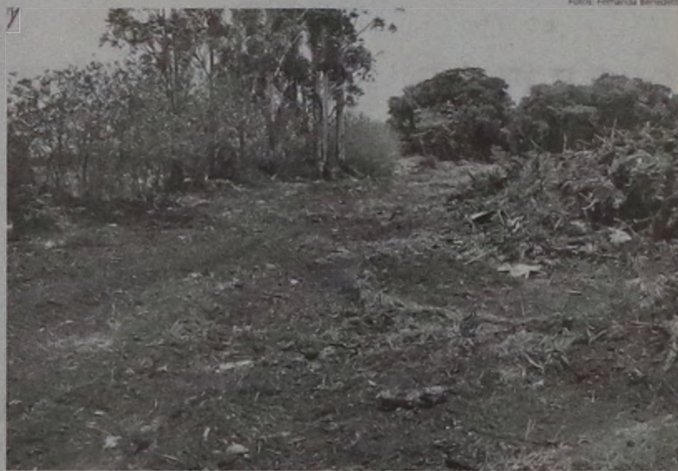
Remédios vencidos foram encontrados em aterro sanitário de Macatuba

Uma equipe de perícia também esteve no local para verificar se o despejo de medicamentos na área poderia ter contaminado o solo ou lençóis freáticos. Caso isso ocor-