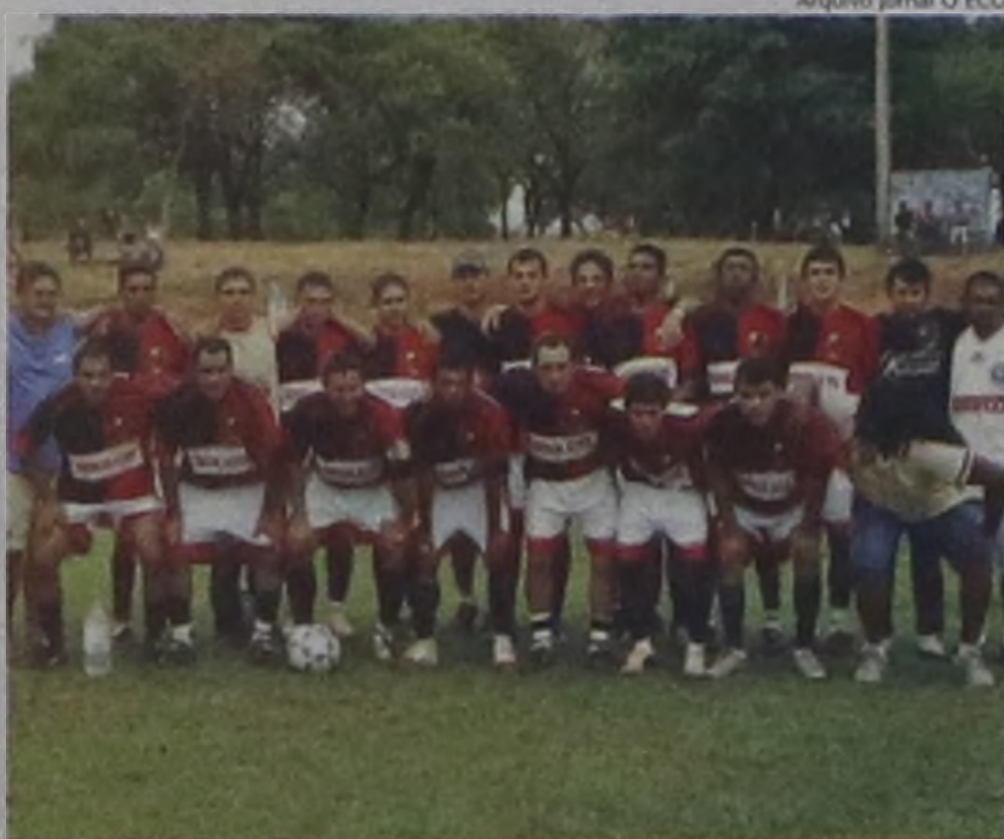
O Flamengo conquistou no domingo a vaga para a final

Além de vencer o Cianorte, o Flamengo que juntamente com o Palestra somavam três pontos ganhos, torceu para que o concorrente não venesse o jogo contra o Colora-