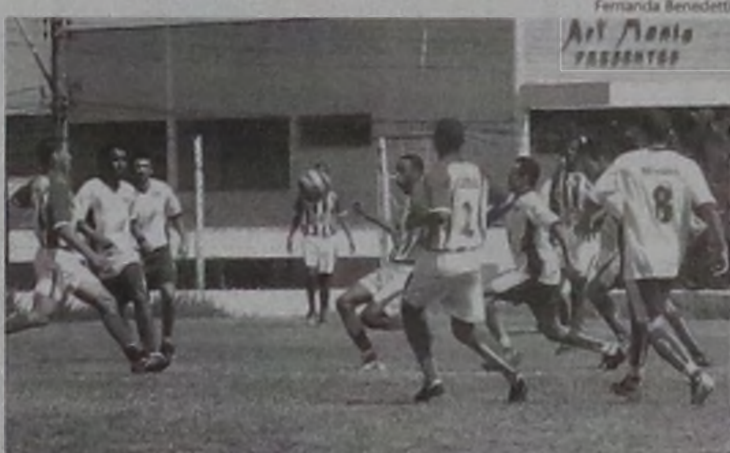
Lance da partida em que Borebi derrotou o Comercial por 3 a 1