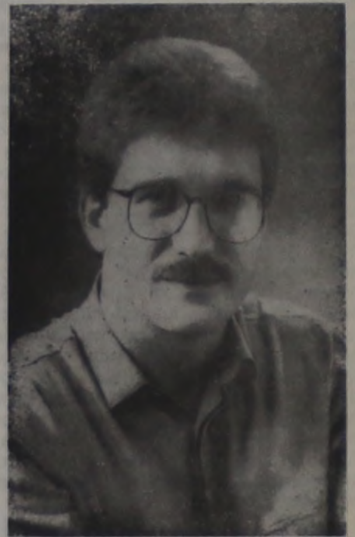
No cargo, o deputado vai mobilizar a região para promover o "desenvolvimento integrado".

para o benefício das com sua representatividade parlamentar.