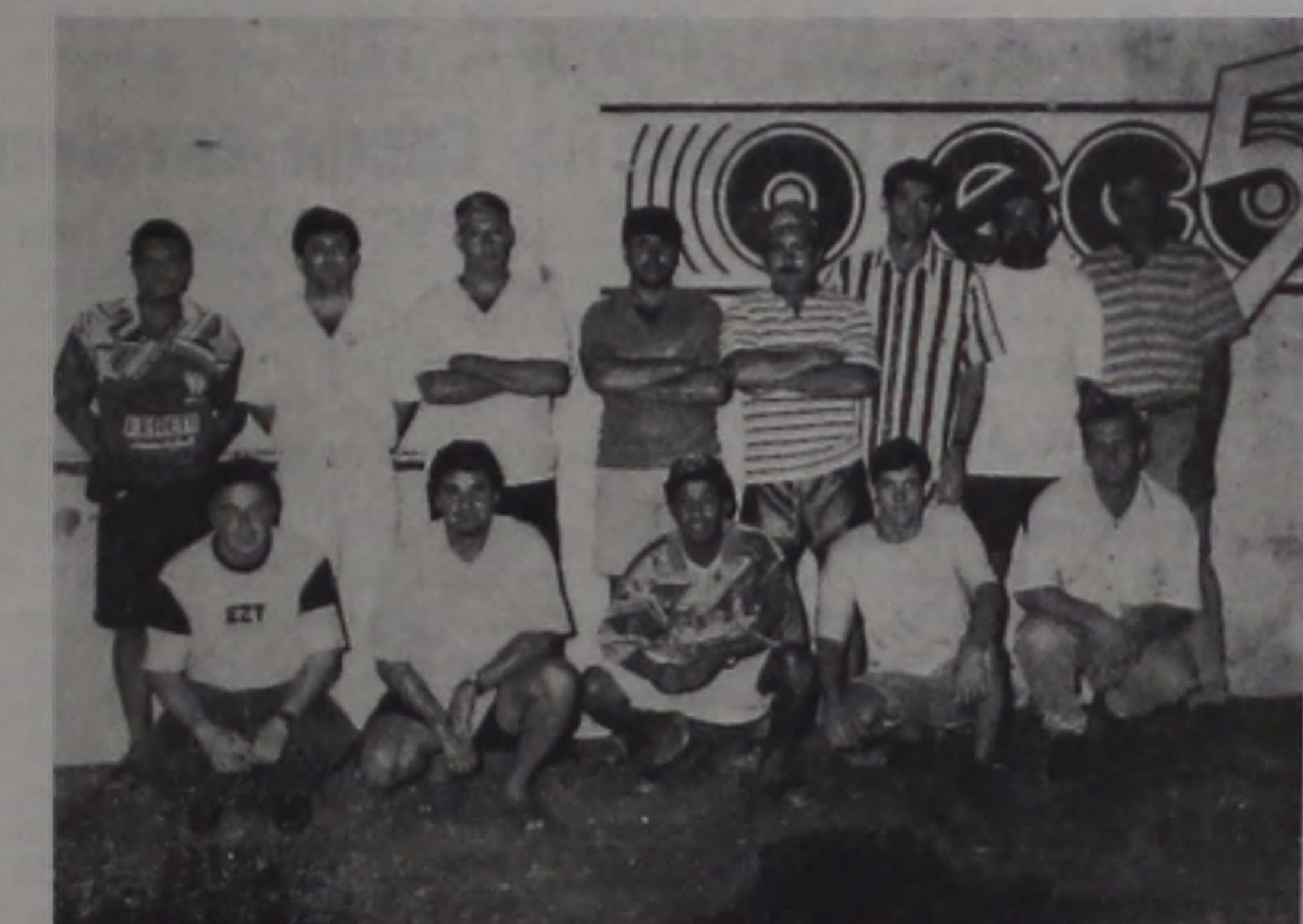
Dirigentes e organizadores reuniram-se terça-feira nas dependências de O ECO.

A equipe campeã e vice-campeã receberão troféus e medalhas. O time campeão receberá no final da competição, um jogo