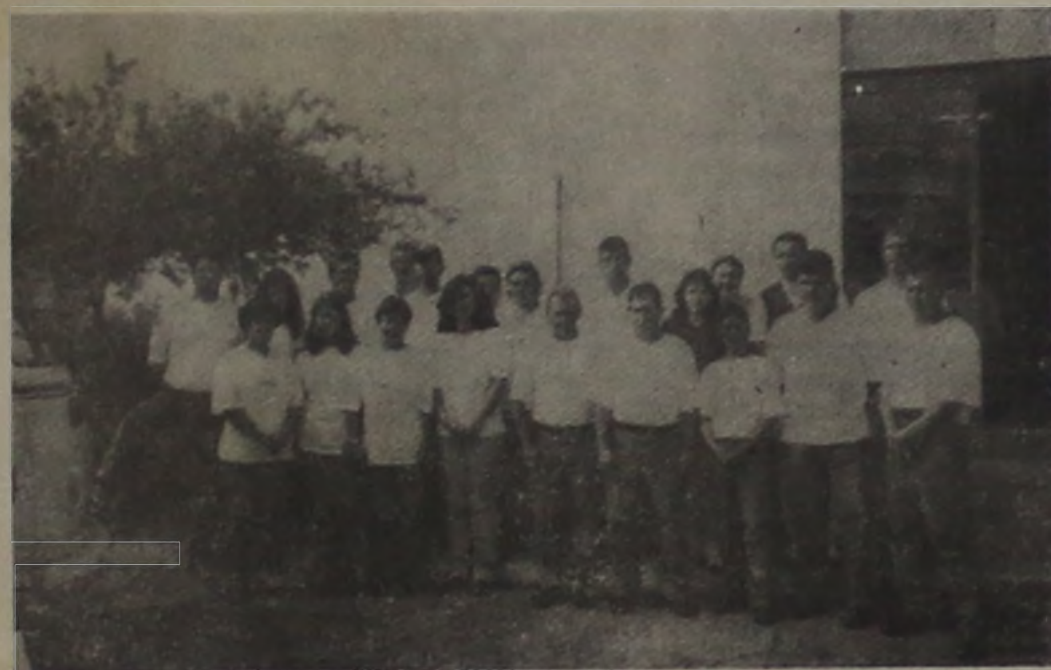
Equipe que trabalha no combate à dengue.

— Novo sorteio é marcado para a sexta-feira da semana que vem —