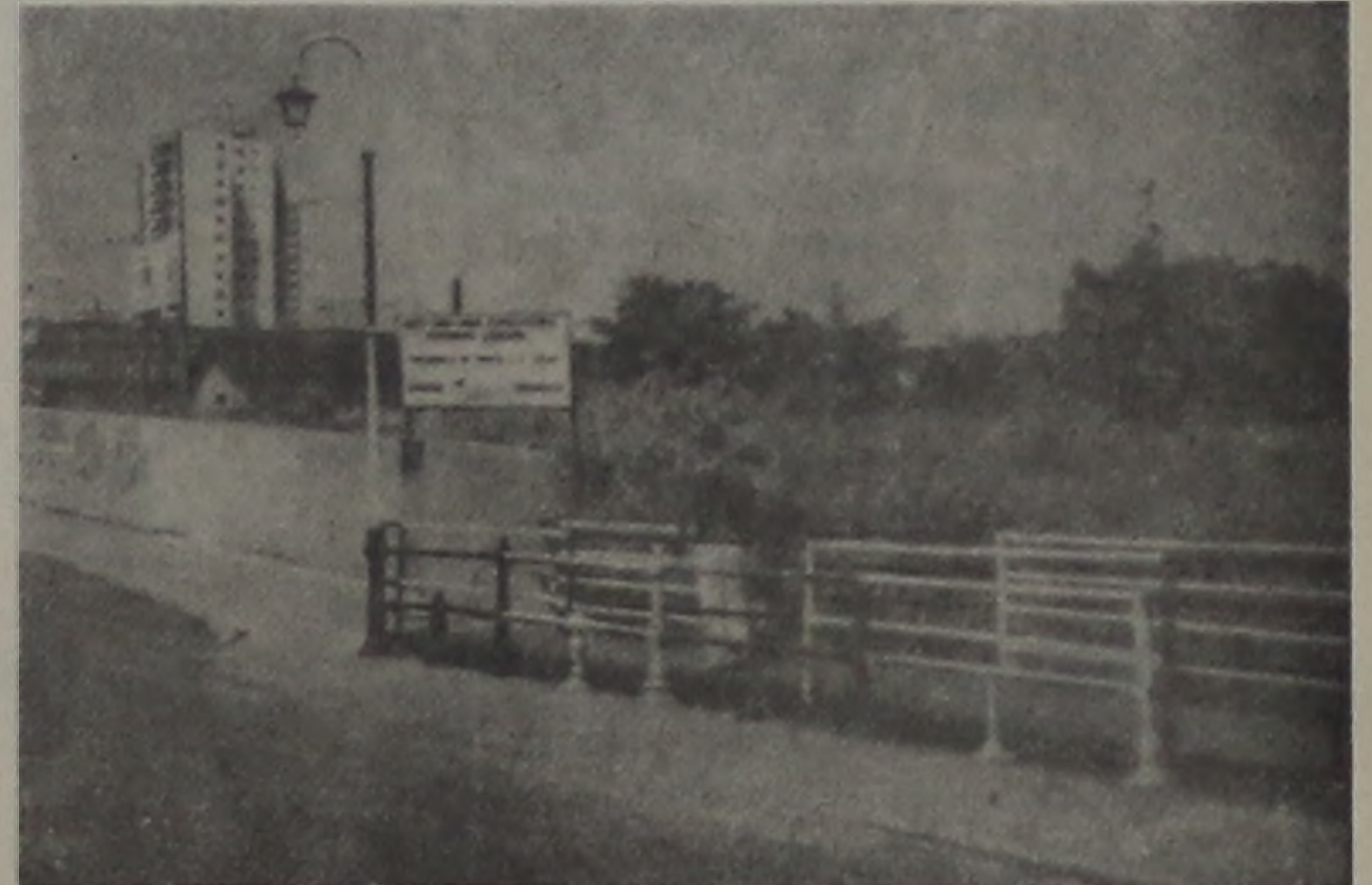
Passarela melhorou o tráfego de pedestres.

Entre as obras a serem oficialmente inauguradas pelo prefeito Pradinho, no final deste mês, a passarela junto à ponte do Rio Lençóis, na Avenida 9 de Julho, é uma das mais elogiadas pela população. O desconhecimento da importância da melhoria foi manifestado por vários moradores que haviam subscrito um abaixo-assinado, solicitando a sua implantação e, agora, fazem questão de agradecer ao prefeito.