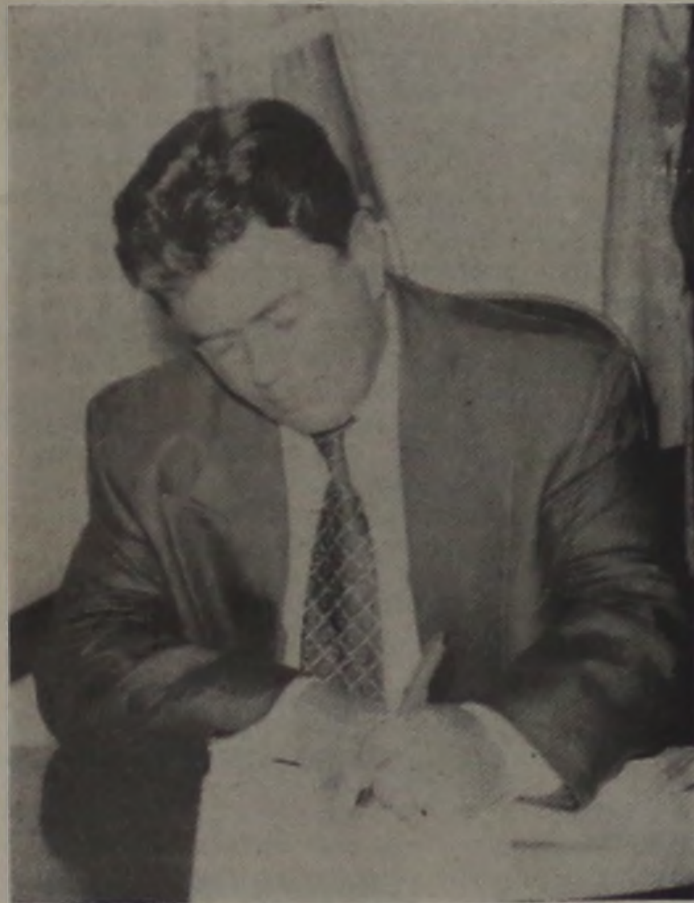
Prefeito José Prado de Lima

Deverão funcionar os plantões de ambulâncias, manutenção do SAAE e a coleta de lixo a partir das 14h00, exceto amanhã 1.º de janeiro. Bancos também terão horário especial hoje. O comércio hoje funcionará das 9h00 às 18h00. Página 03.