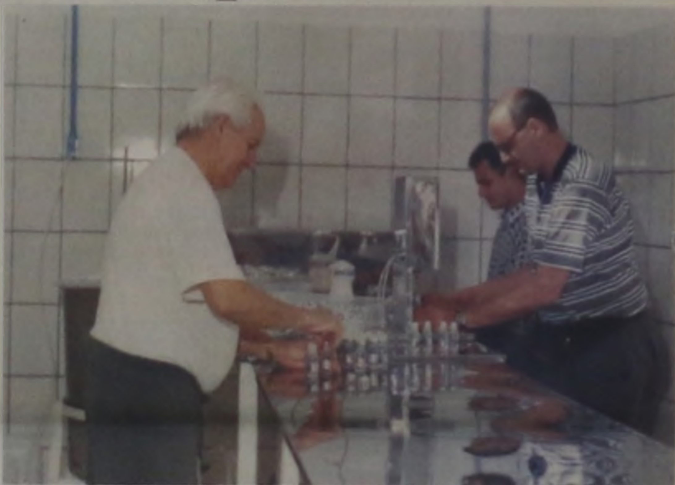
Minuche Cosméticos, uma das empresas instaladas na incubadora

As casas foram entregues no Jardim Planalto e Residencial Santa Felicidade I e II. Todas elas foram construídas pela Construtora Ifem, de Bauru. Segundo a CEF, a previsão para esse mês é que se faça a assinatura de mais de 40 unidades, no Jardim Santa Felicidade III, também pela Construtora Ifem