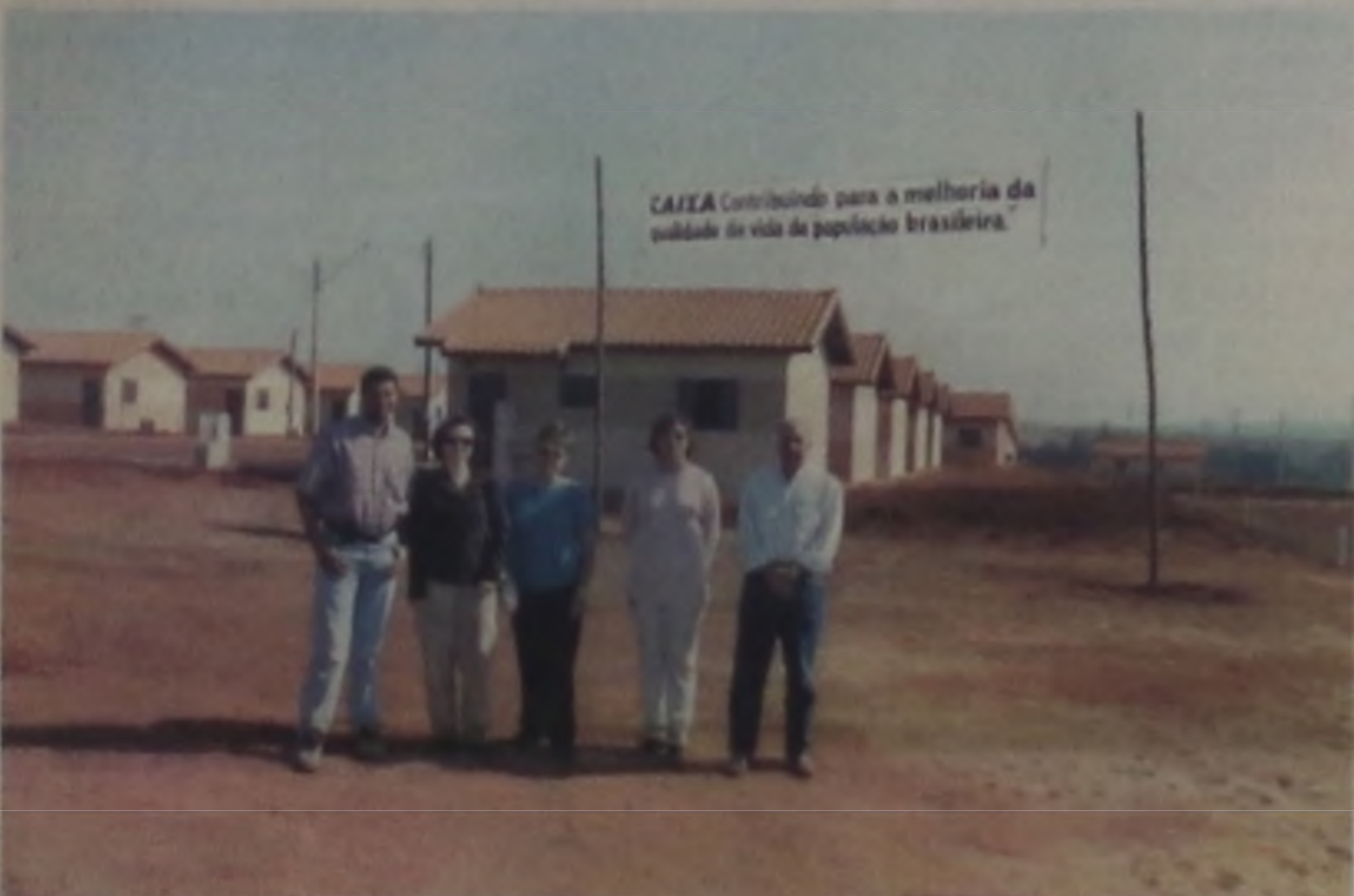
CAIXA Contribuindo para a melhoria da qualidade de vida da população brasileira.

CONSTRUINDO O FUTURO - A Caixa Econômica Federal entregou no mês de agosto, na cidade de Macatuba, mais de 100 casas, sendo 78 unidades de 2 e 3 dormitórios. Foram feitas também as assinaturas de mais 35 unidades de 2 dormitórios.