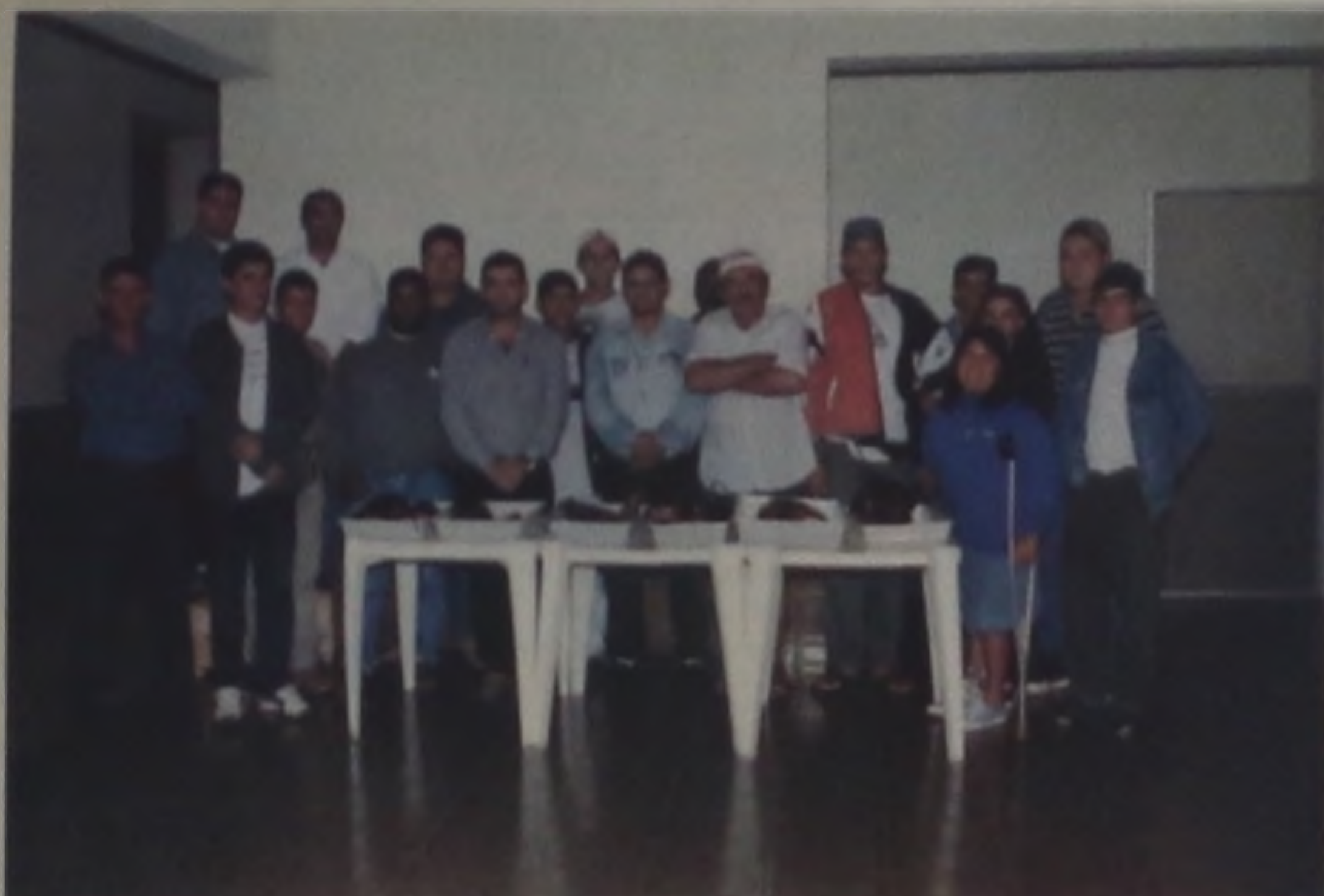
Os alunos e professores do curso em Areiópolis

Areiópolis - A Prefeitura Municipal e a Assistência Social organizaram no último mês de agosto, em parceria com o Senar de Lençóis Paulista, um curso de processamento de carne suína.