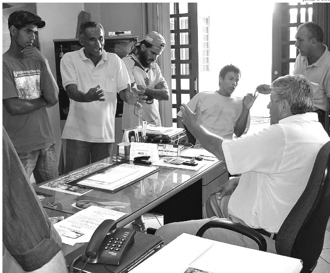
Tumulto causado pelos assentados terminou em audiência com o prefeito Finotti

veículo e a prisão do acusado se deu após meses de investigação. De acordo com o delegado, a oficina adulterava cabines de caminhões. W.L.C. foi levado para a cadeia de Duartina.