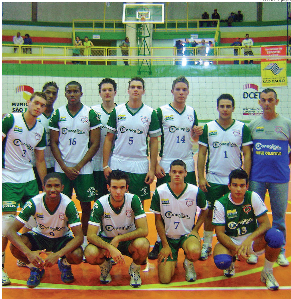
Equipe sub-21 de vôlei masculino estreou com vitória nos Abertos de Piracicaba; hoje pega Mauá

Lençóis participa da competição nas modalidades de biribol masculino, bocha masculino, vôlei masculino e feminino, atletismo PPD (Pessoa Portadora de Deficiência) masculino e feminino, natação PPD masculino, capoeira feminino, tênis de campo feminino e atletismo feminino.