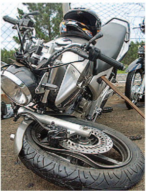
Moto ficou destruída