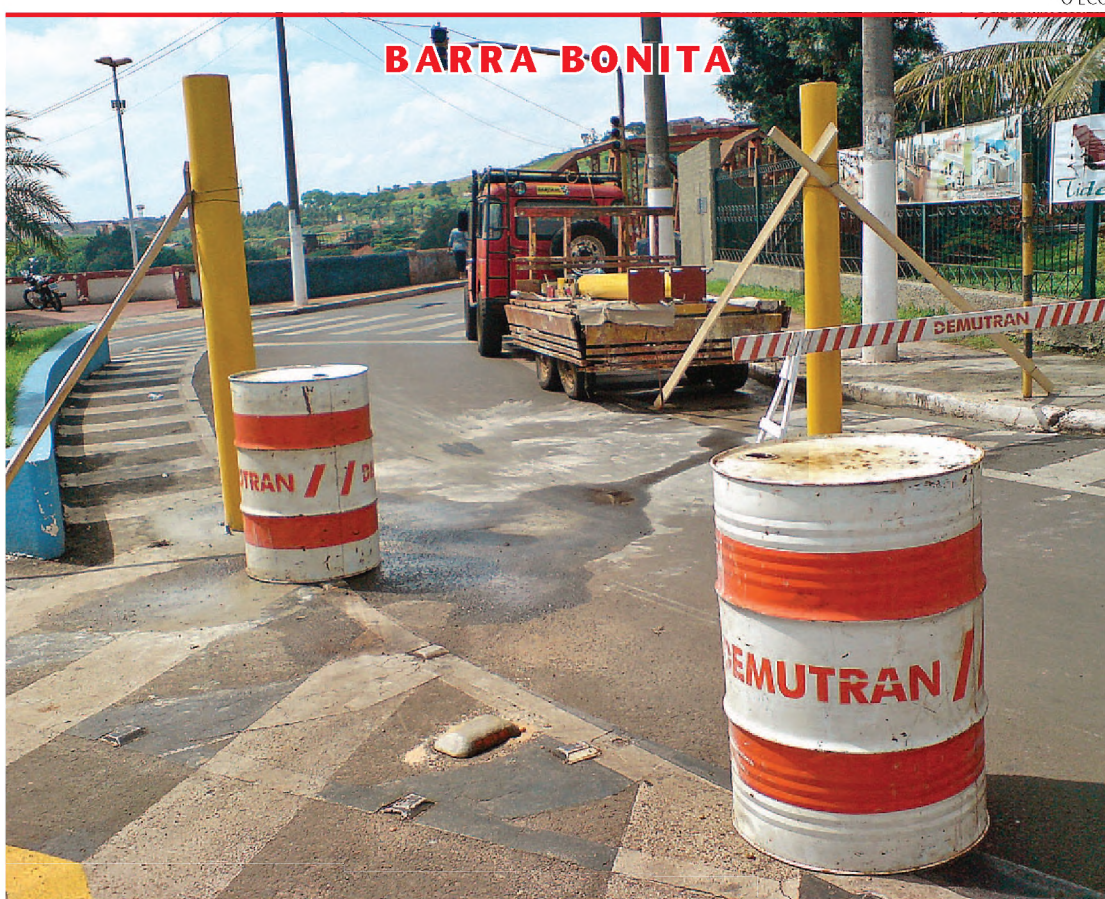
Ontem foram instalados limitadores de altura que vão impedir a passagem de ônibus e caminhões