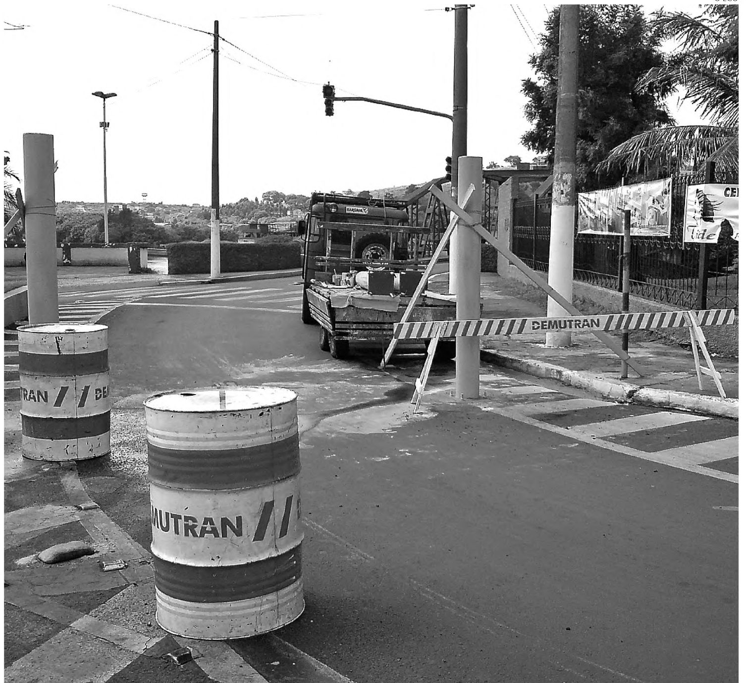
Ponte Campos Salles será liberada para carros a partir de hoje; barras vão impedir tráfego de ônibus e caminhões

O que ainda continua da mesma forma é o transporte coletivo intermunicipal. A empresa Barra-Tur, que fazia o serviço passando pela Ponte Campos Salles, tenta na Artesp (Agência Reguladora de Transporte do Estado de São Paulo) autorização para transportar os passageiros passando pela SP-255, única via de acesso entre as duas cidades. Por enquanto a Barra-Tur continua com a baldeação dos passageiros, que têm que atravessar a ponte a pé e depois entrar em outro veículo.