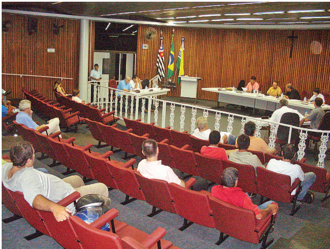
Vereadores discutiram e votaram vários projetos, requerimentos e moções na segunda-feira