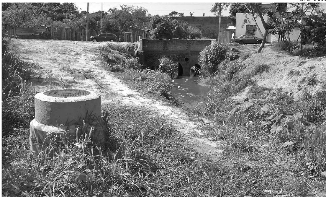
Para resolver problema de esgoto em Agudos, Sabesp pede mais quatro anos

De acordo com Iracema Comin, que possui um salão de beleza no centro de Agudos, o mau cheiro é insuportável. "Às vezes é preciso colocar plástico com pedaço de madeira na boca de lobo para minimizar o