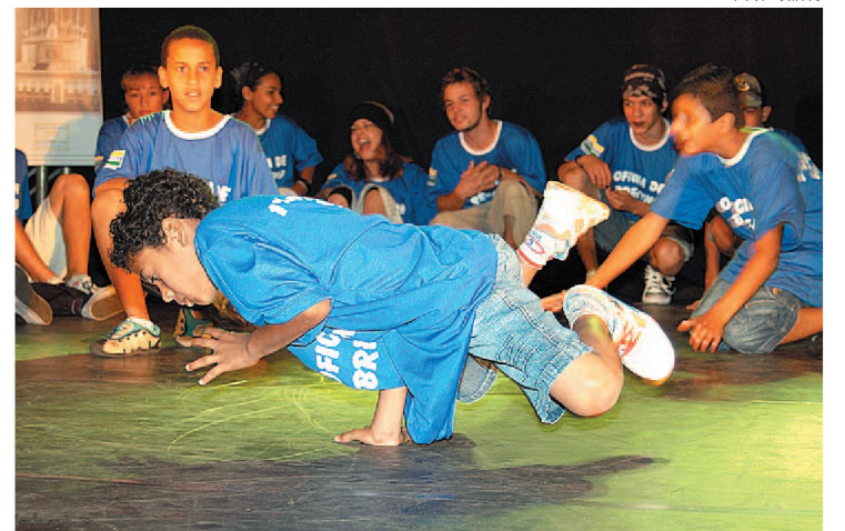
Projeto Virando Jogo é mantido com recursos do imposto

Começou em toda a região a campanha que estimula a destinação de parte do Imposto de Renda ao Fundo Municipal dos Direitos da Criança e do Adolescente. Lençóis Paulista, Macatuba, Agudos, Barra Bonita e Igarapu do Tietê começam a conscientizar a população sobre a importância da destinação do imposto para o município. Pessoas físi-