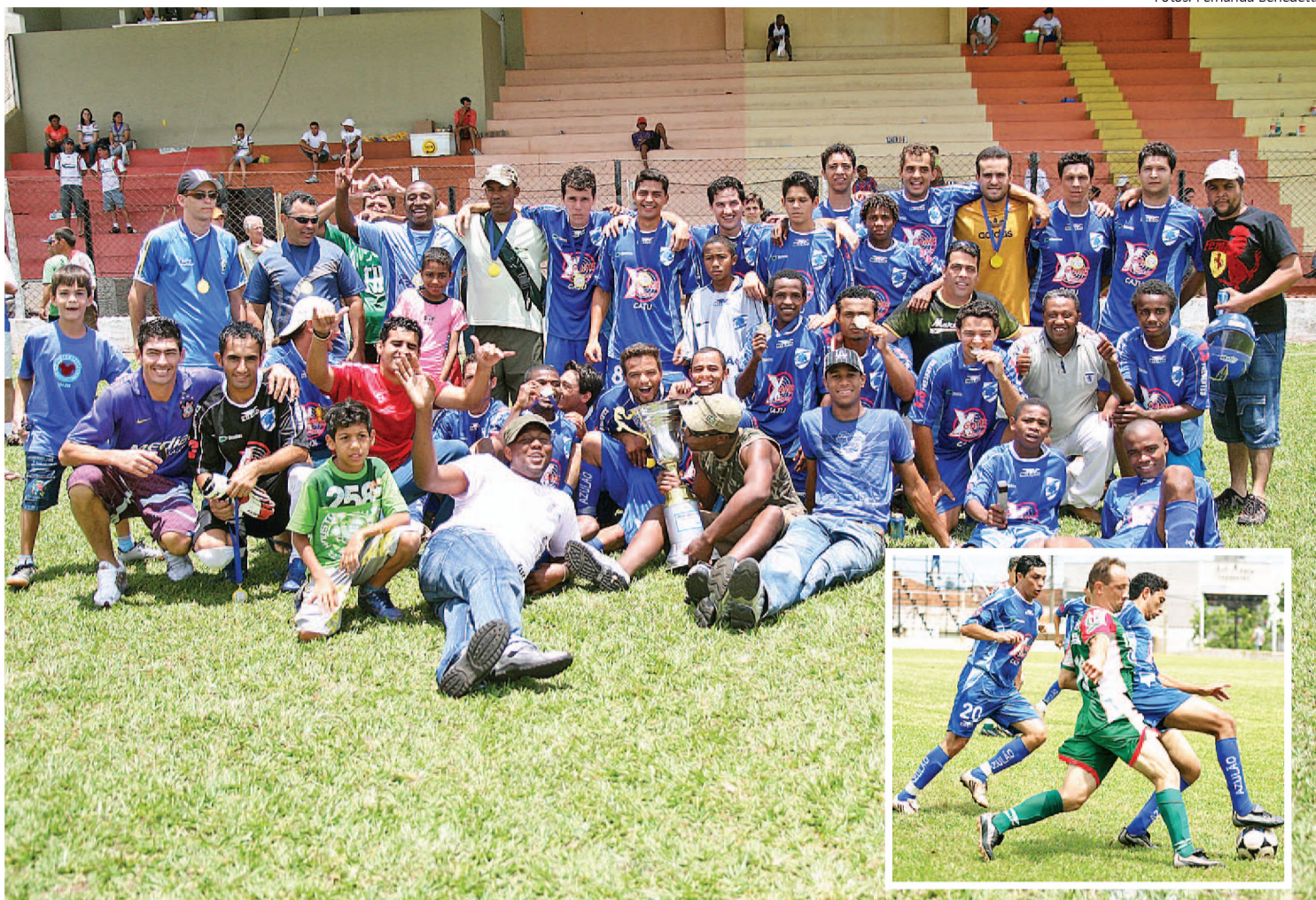
Duratex/Grêmio Cecap fez uma campanha irretocável e ficou com o título do Amador sem perder nenhum jogo