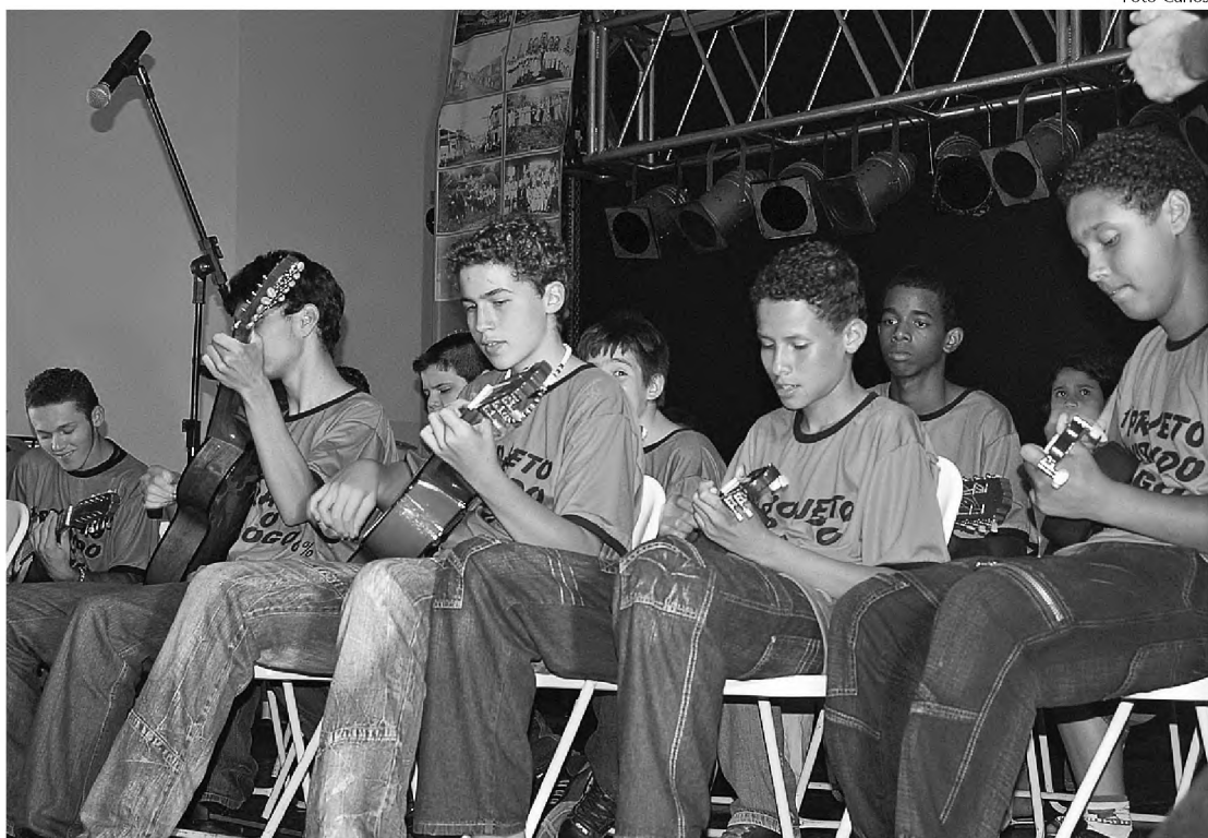
Em Lençóis Paulista, dinheiro é aplicado em projetos como o Virando o Jogo

A Diretoria espera arrecadar mais de R$ 200 mil este ano. No ano passado, o montante arrecadado foi utilizado para a construção de um prédio de 230 metros quadrados, onde são realizados cursos de capacitação em mecânica e in-