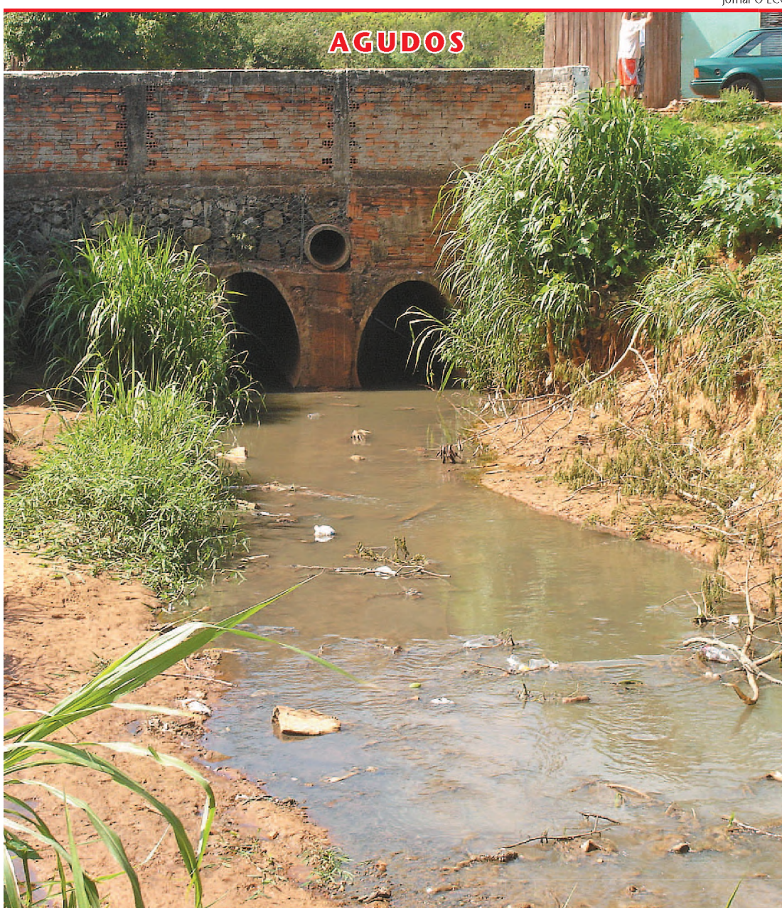
Esgoto corre a céu aberto bem no centro de Agudos; Sabesp diz que estação fica pronta em 2012

A Orquestra Municipal de Sopros de Lençóis Paulista lança seu primeiro CD em concerto marcado para amanhã, às 20h, no CEM (Clube Esportivo Marimbondo). Toda a população está convidada para assistir apresentação, que é de graça. Além do lançamento do CD, a orquestra também comemora 13 anos de formação. A noite promete ser de gala. A Orquestra disponibilizará o CD para venda no final da apresentação. O custo será de R$ 10. O dinheiro arrecadado será revertido para o grupo. ► Página A2