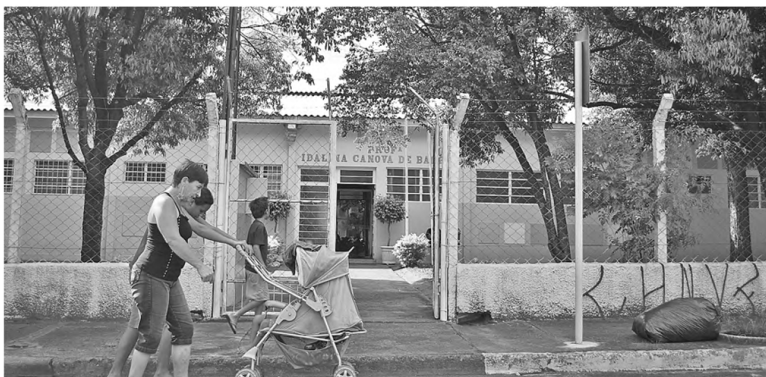
Escola Idalina é um dos locais onde será realizada a prova do concurso para professores em Lençóis

No período da tarde do sábado 9, das 14h às 17h, é a vez