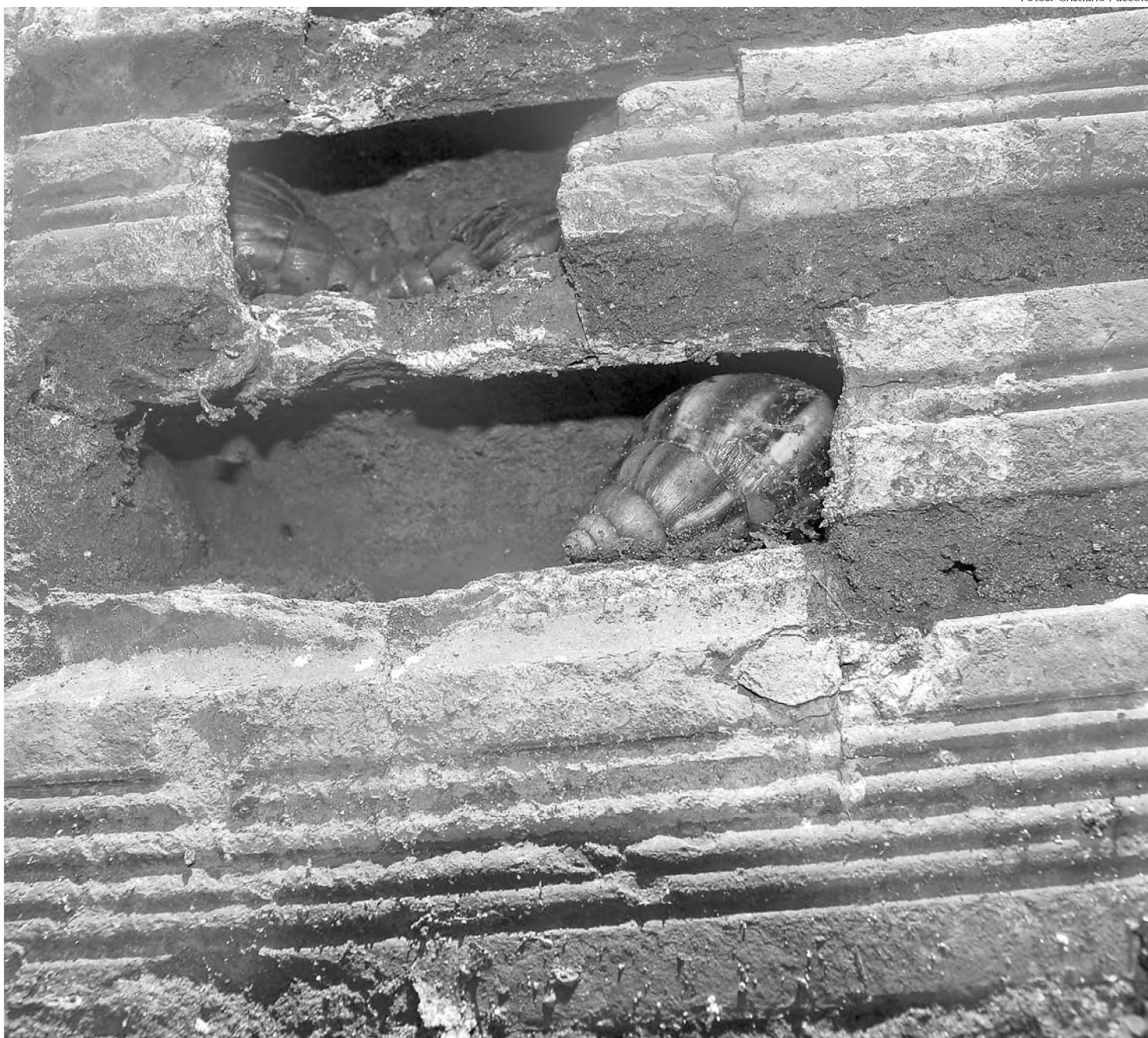
Caramujos africanos saem de casa abandonada no Júlio Ferrari e invadem residências vizinhas, para desespero de moradores

O caramujo foi introduzido no Brasil como uma versão do escargot. Segundo o Ministério da Saúde, a reprodução começou pelo estado do Paraná e se espalhou por várias regiões do