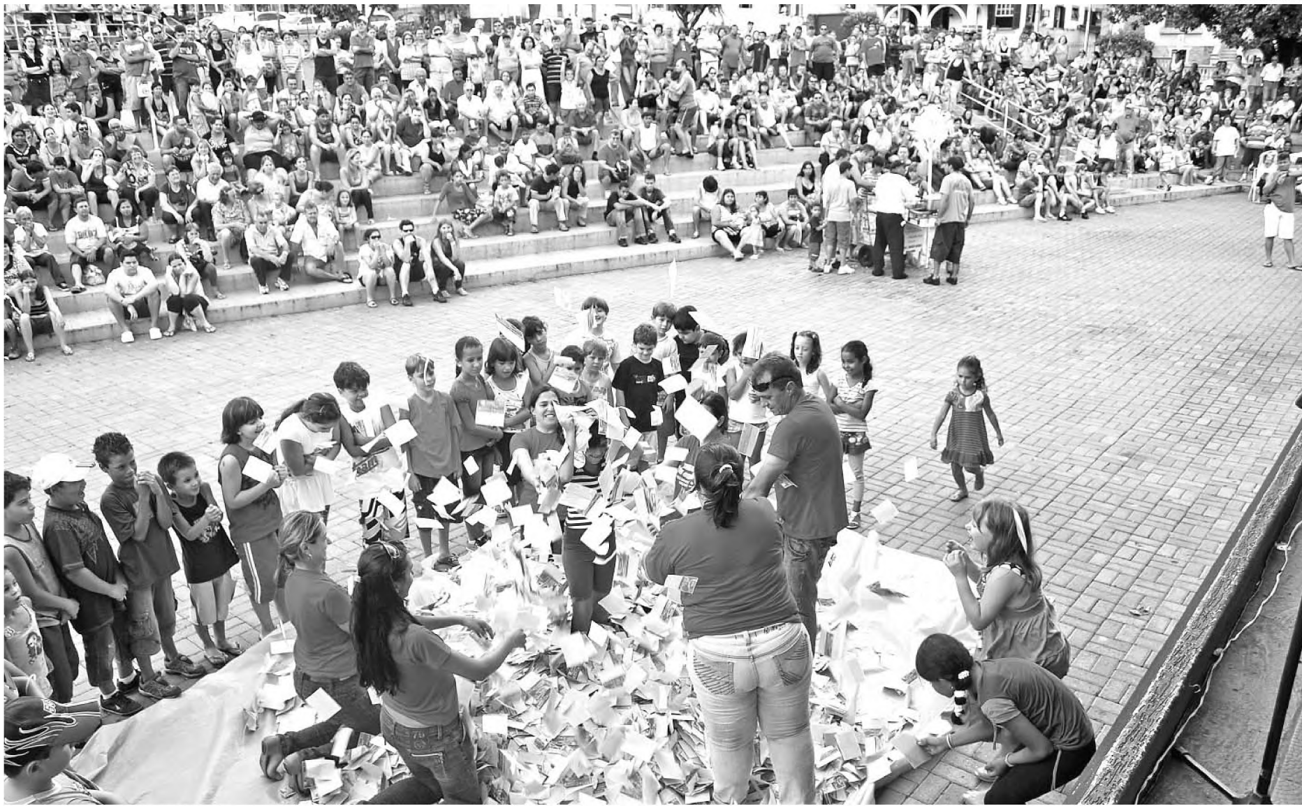
Quase mil pessoas foram até a Concha Acústica ver de perto o sorteio dos prêmios feitos pela Acilpa

Na avaliação do presidente da Acilpa, a promoção cumpriu o objetivo para qual foi criada: fazer o consumidor de Lençóis Paulista e região gas-