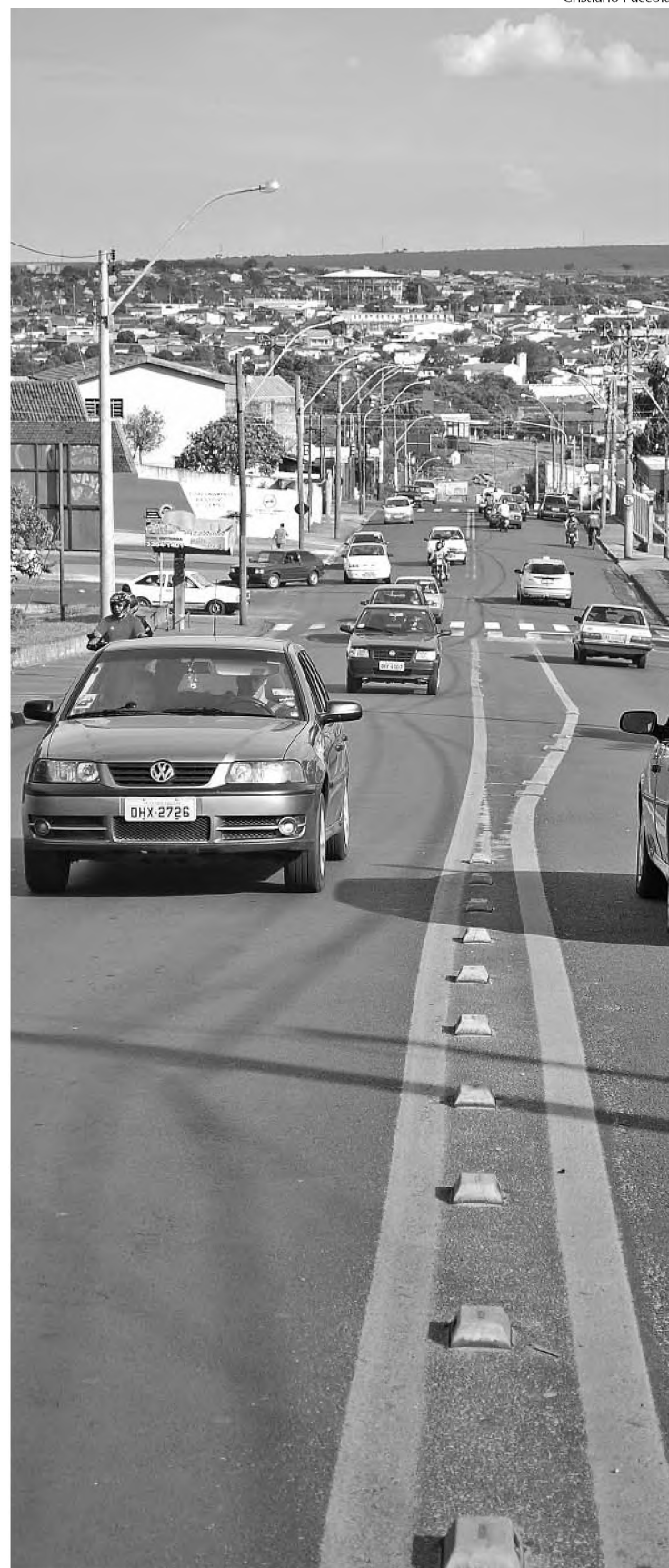
IPVA de carros deve ficar mais barato pela redução do IPI