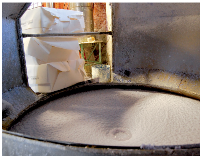
Caldeira onde ocorre a primeira fase da preparação do papel