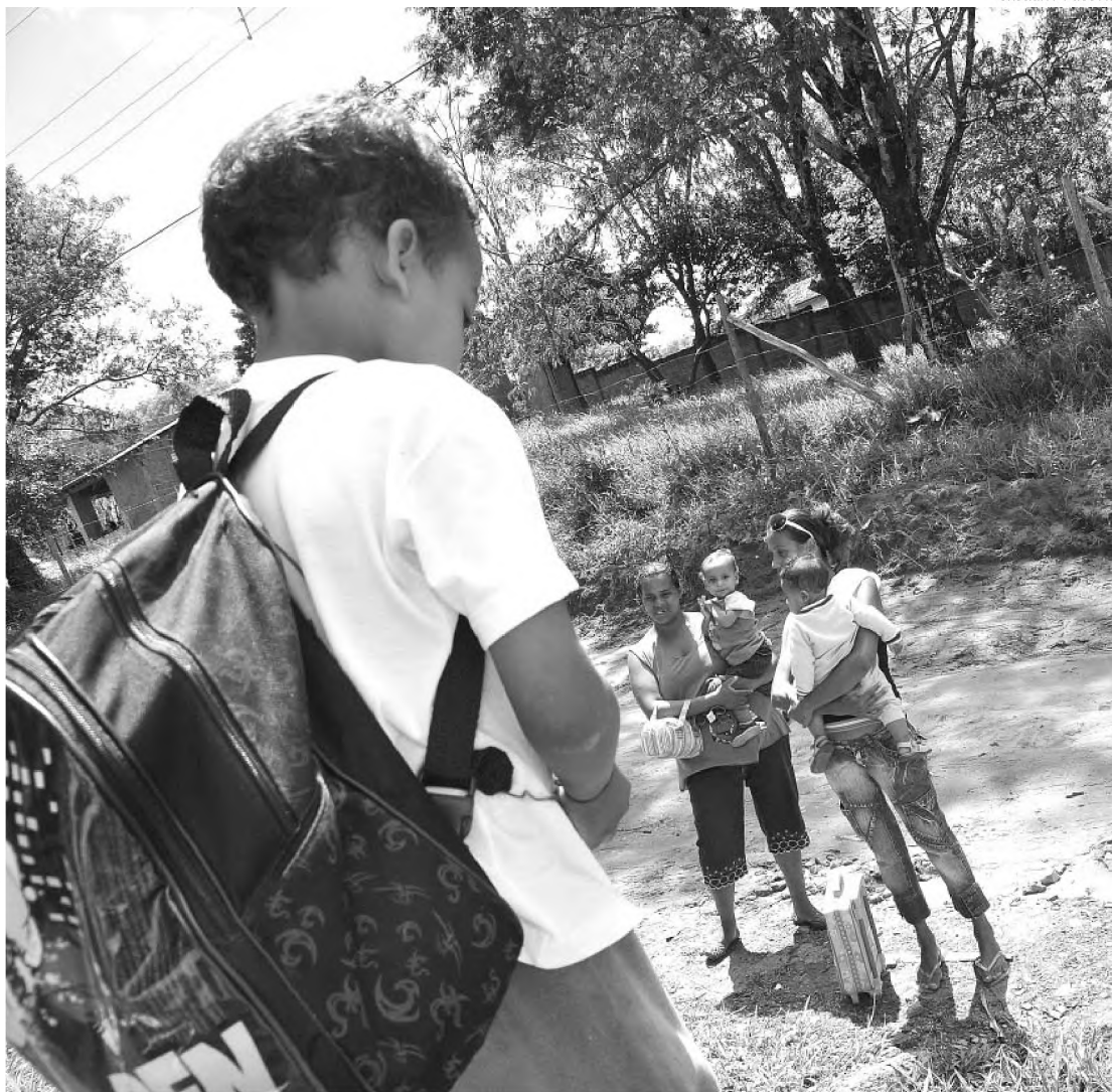
Crianças do Jardim Santa Cândida, em Agudos, dependem do transporte público para ir à escola