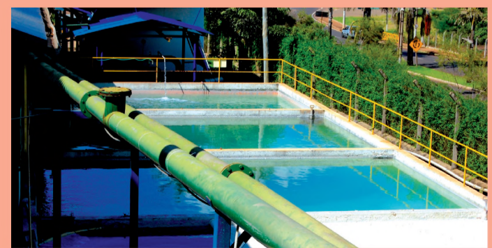
Tanque armazena água utilizada na produção do papel, para depois ser reutilizada

Já entre as medidas adotadas pela empresa com foco no desenvolvimento sustentável, está, por exemplo, a reutilização da água utilizada no processo industrial. Como a Lutepel possui poços artesianos próprios, poupa os rios, à medida que não retira água deles. Outra iniciativa que merece destaque é o circuito fechado de água, que faz com que toda a água utilizada na fabricação do papel seja recuperada e depois reaproveitada.