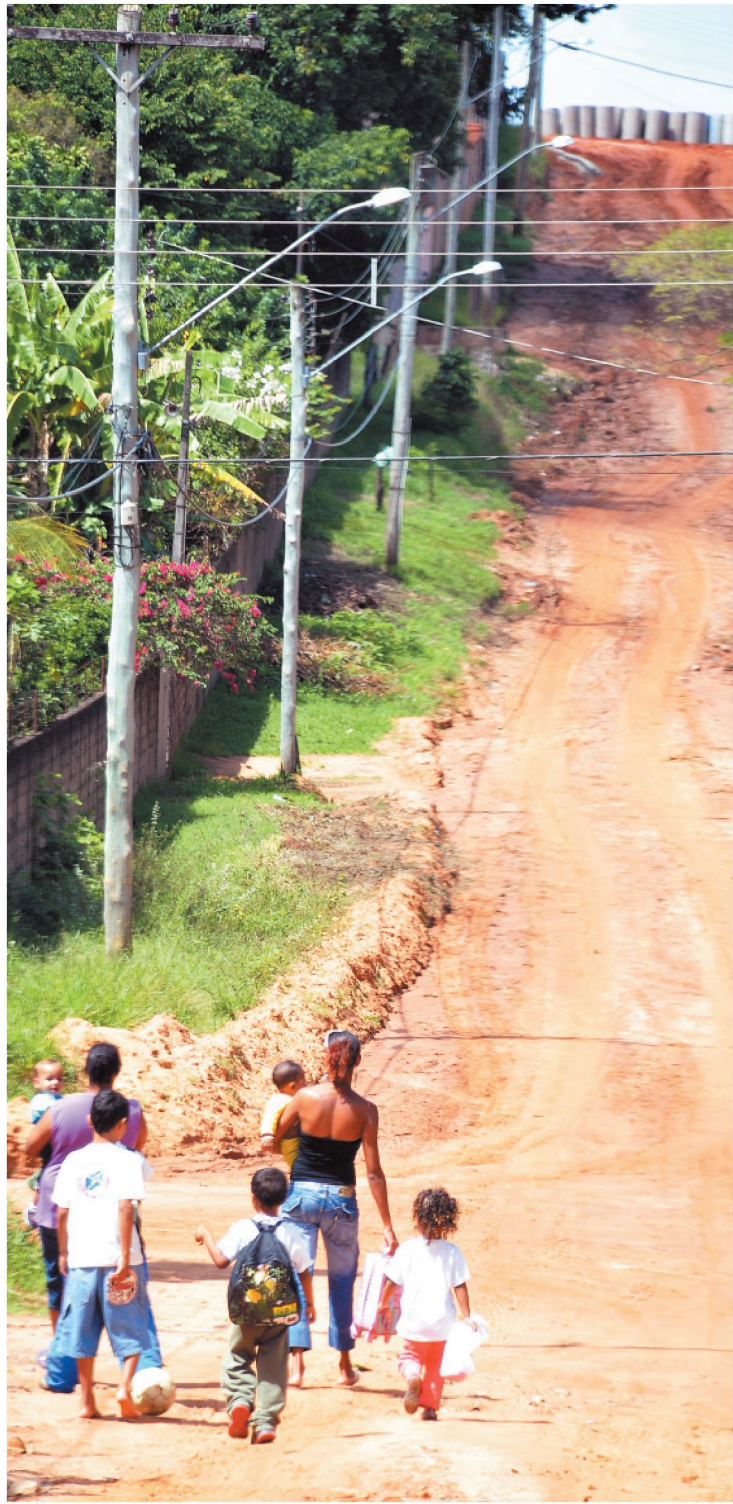
Crianças do Santa Cândida andam dois quilômetros até escola

Mães que residem no Jardim Santa Cândida, em Agudos, reclamaram na segunda-feira 5 das falhas no atendimento do transporte escolar de um ônibus que transporta as crianças até escolas como EMEF Coronel Leite e EMEFEI Clélia Napoleone Crema, no centro. A dificuldade, segun-