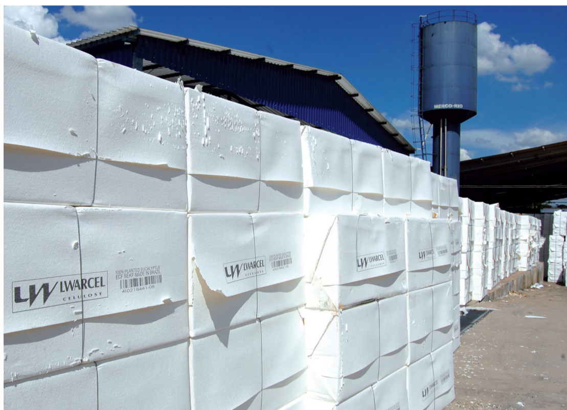
É grande a variedade de papéis brancos e pardos produzidos pela Lutepel, em Lençóis Paulista

Investimento tecnológico e preços justos fazem da Lutepel uma das empresas líderes em seu segmento, com produção para o Brasil, América Latina e Europa