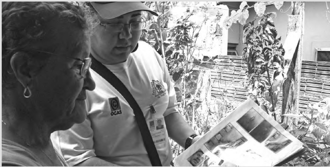
Agentes de Saúde orientam população a não deixar lixo acumulado e sintomas da doença

A Diretoria de Saúde atribui o índice zero a um programa de conscientização, prevenção e eliminação da leishmaniose. Para que não haja a proliferação da doença, os agentes de saúde comunitária verificam com frequência as condições de higiene nas residências. Como a reprodução e alimentação do mosquito ocorre em locais úmidos e com matéria orgânica em decomposição, é necessário que ocorra a eliminação de folhas, frutos, troncos e galhos que por ventura este-