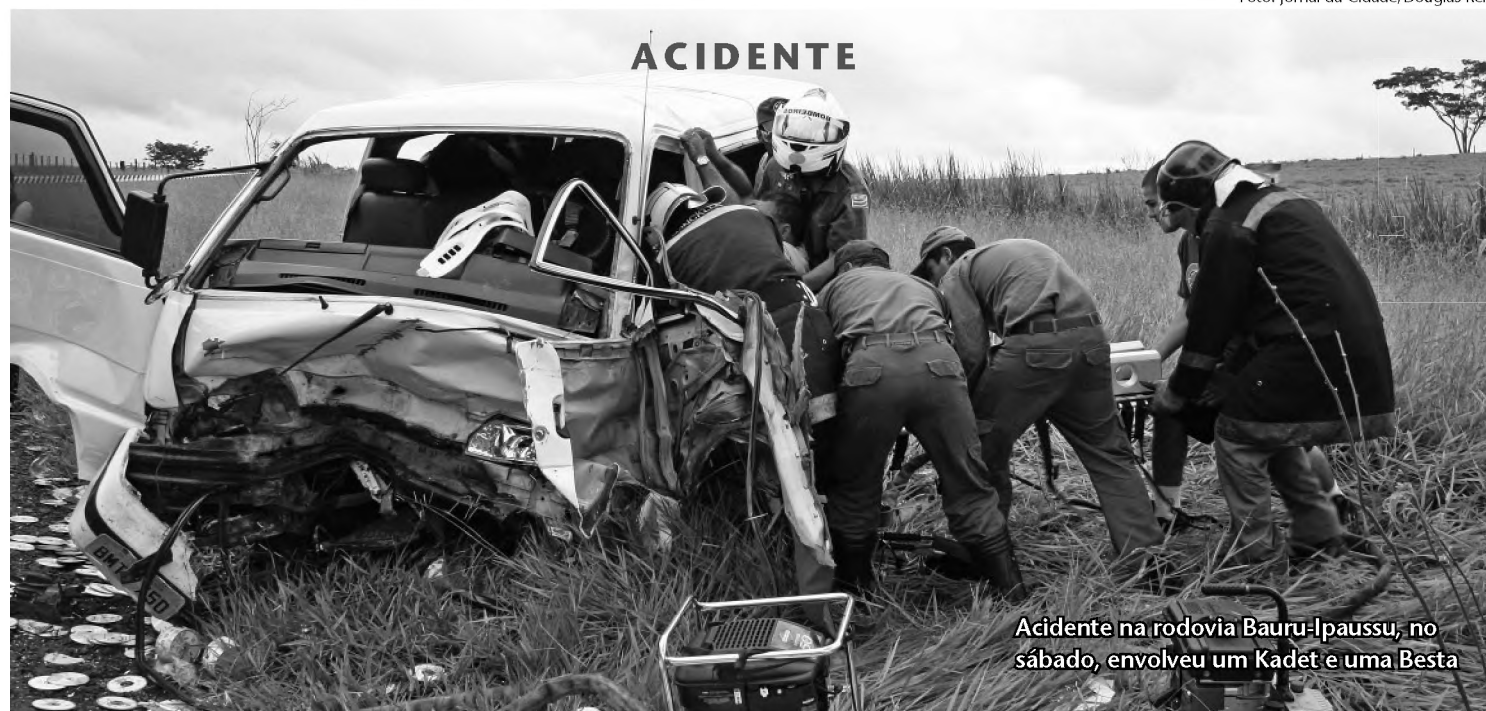
Acidente na rodovia Bauru-Ipaussu, no sábado, envolveu um Kadet e uma Besta