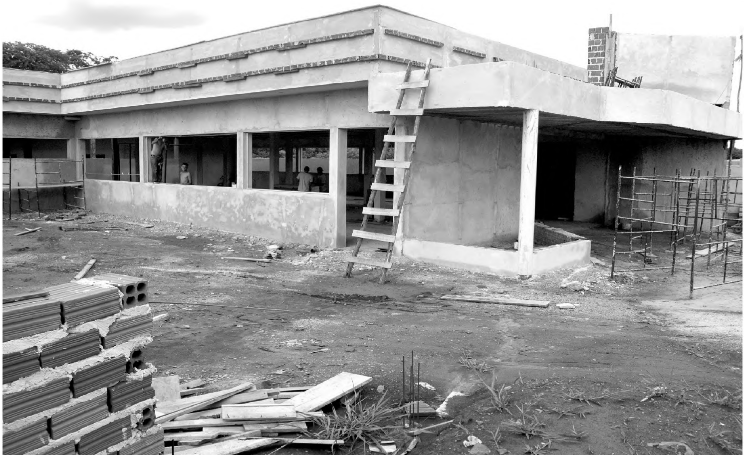
Sede própria da agência do INSS deve ficar pronta até abril, segundo gerente regional; obras estão em fase intermediária