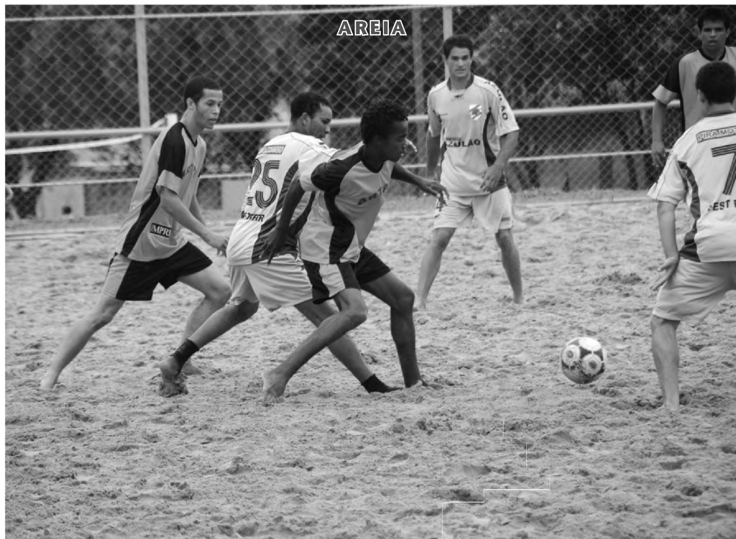
O Grêmio Cecap estreou na Copa Sport Shoes com goleada de 8 a 3 sobre o MEC; partida aconteceu na manhã do domingo 18