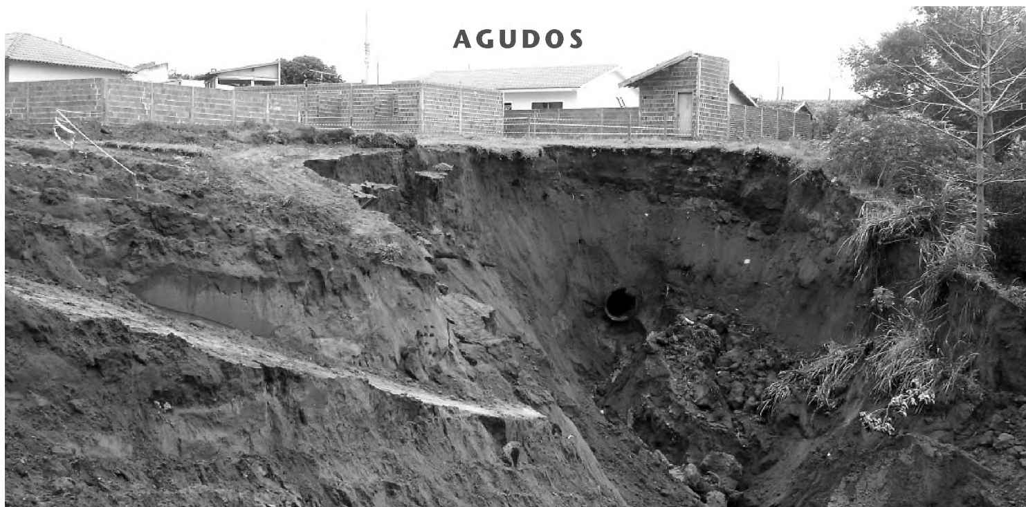
Galeria de água pluvial rompeu e causou um buraco de cerca de 80 metros de profundidade no bairro Santa Angelina, em Agudos