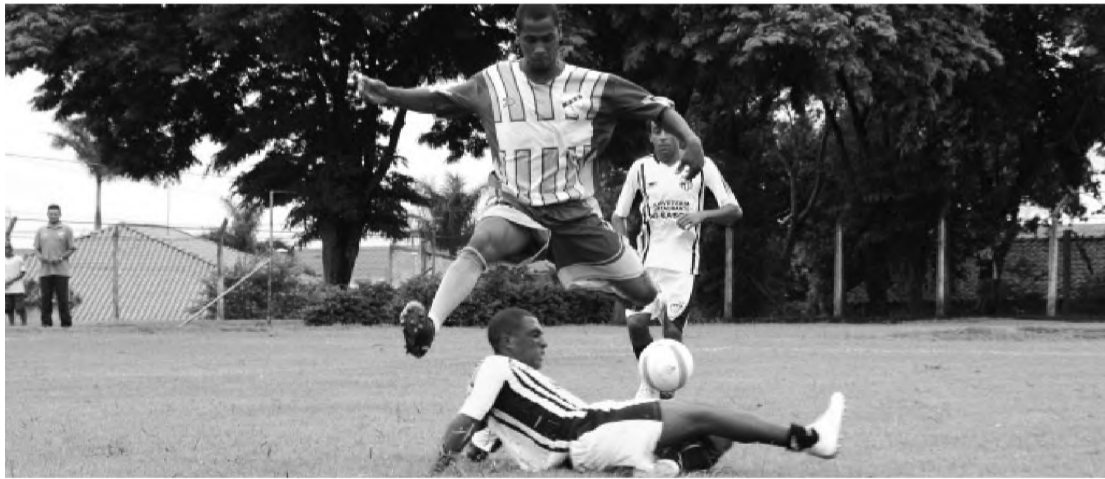
No confronto entre dois times da casa, CSK e MAC ficaram no empate em 1 a 1

No Centro de Lazer do Trabalhador, mais quatro jogos. Expressinho/Pitoli/Trigal, outra equipe lençoense, estreou com vitória sobre o co-terreno Palestra, por 3 a 0. O destaque do Expressinho