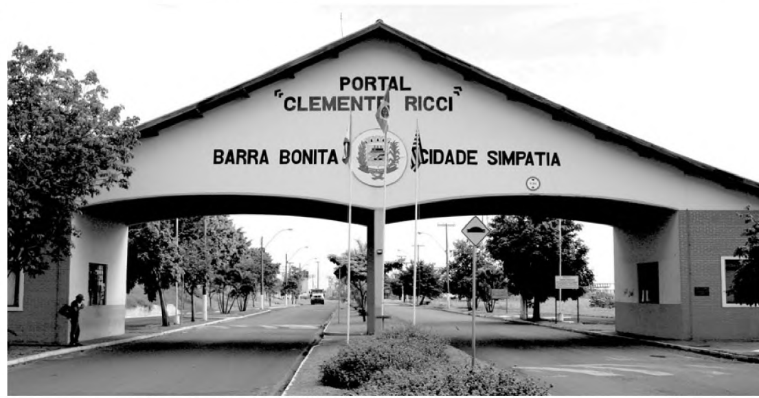
Projeto de integrar departamentos e distribuir internet de graça será retomado pela administração