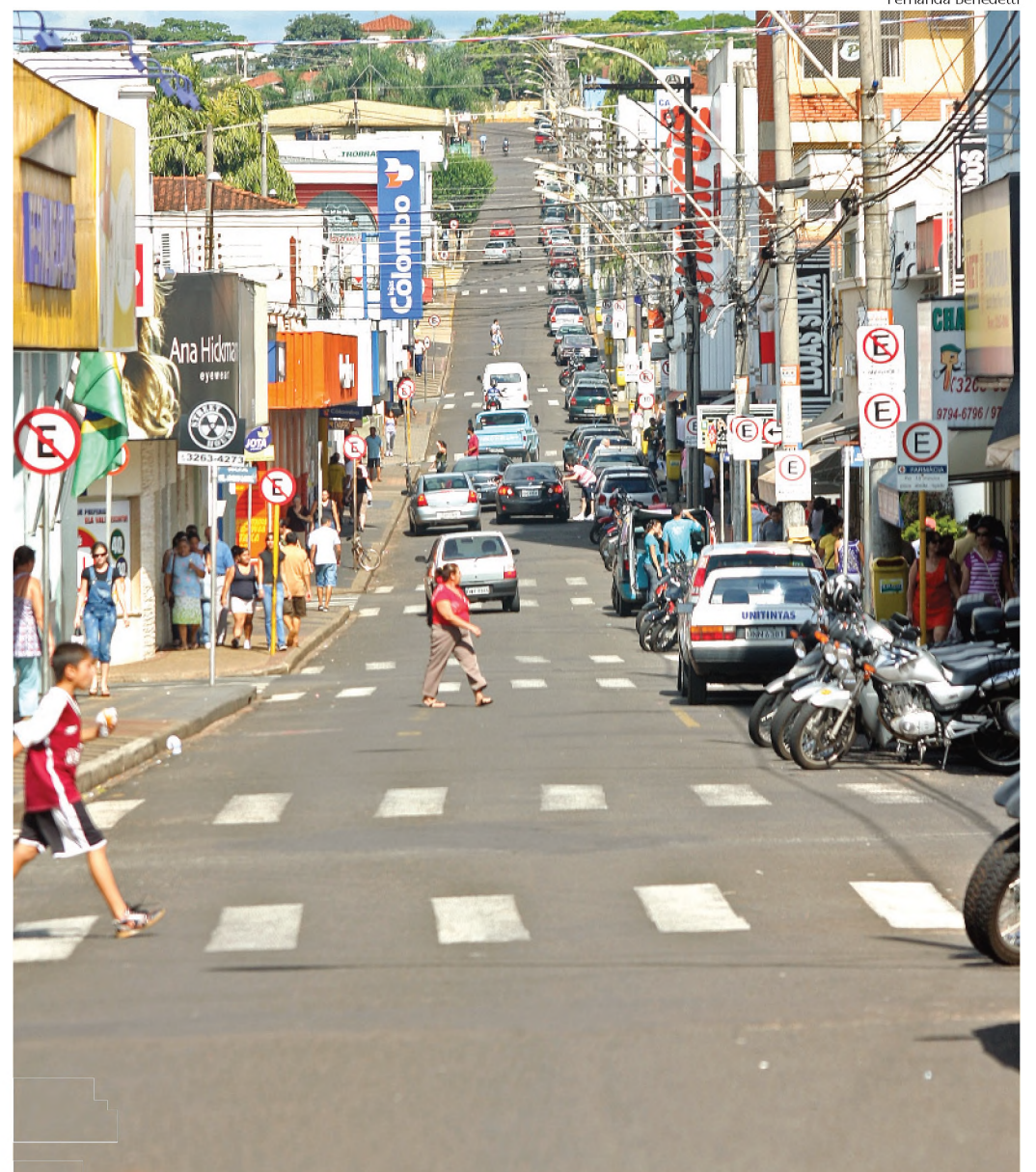
Lojas de Lençóis fecham no sábado e só reabrem na quarta-feira de Cinzas ao meio-dia

Um acordo entre lojistas e o Sindicato dos Comerciantes de Botucatu alterou o horário de funcionamento do comércio lençoense no feriado de carnaval. As lojas funcionam até as 18h do sábado 21 e só reabrem às 12h da quarta-feira de Cinzas. O