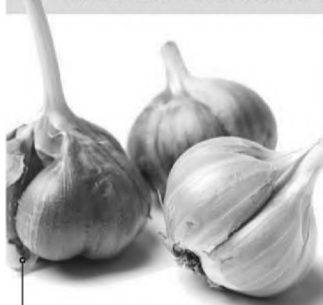
Allium sativum » alho » antisséptico, anti-inflamatório e anti-hipertensivo

Veja algumas das plantas que serão usadas em remédios na rede pública