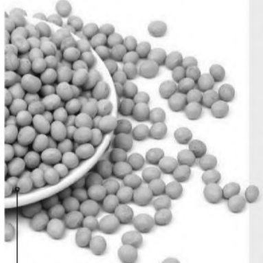
Glycine max » soja » tratamento de sintomas da menopausa, osteoporose