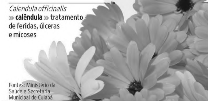
Calendula officinalis » calêndula » tratamento de feridas, úlceras e micoses

Fontes: Ministério da Saúde e Secretaria Municipal de Cuiabá