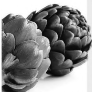
Cynara scolymus » alcachofra » combate a ácido úrico