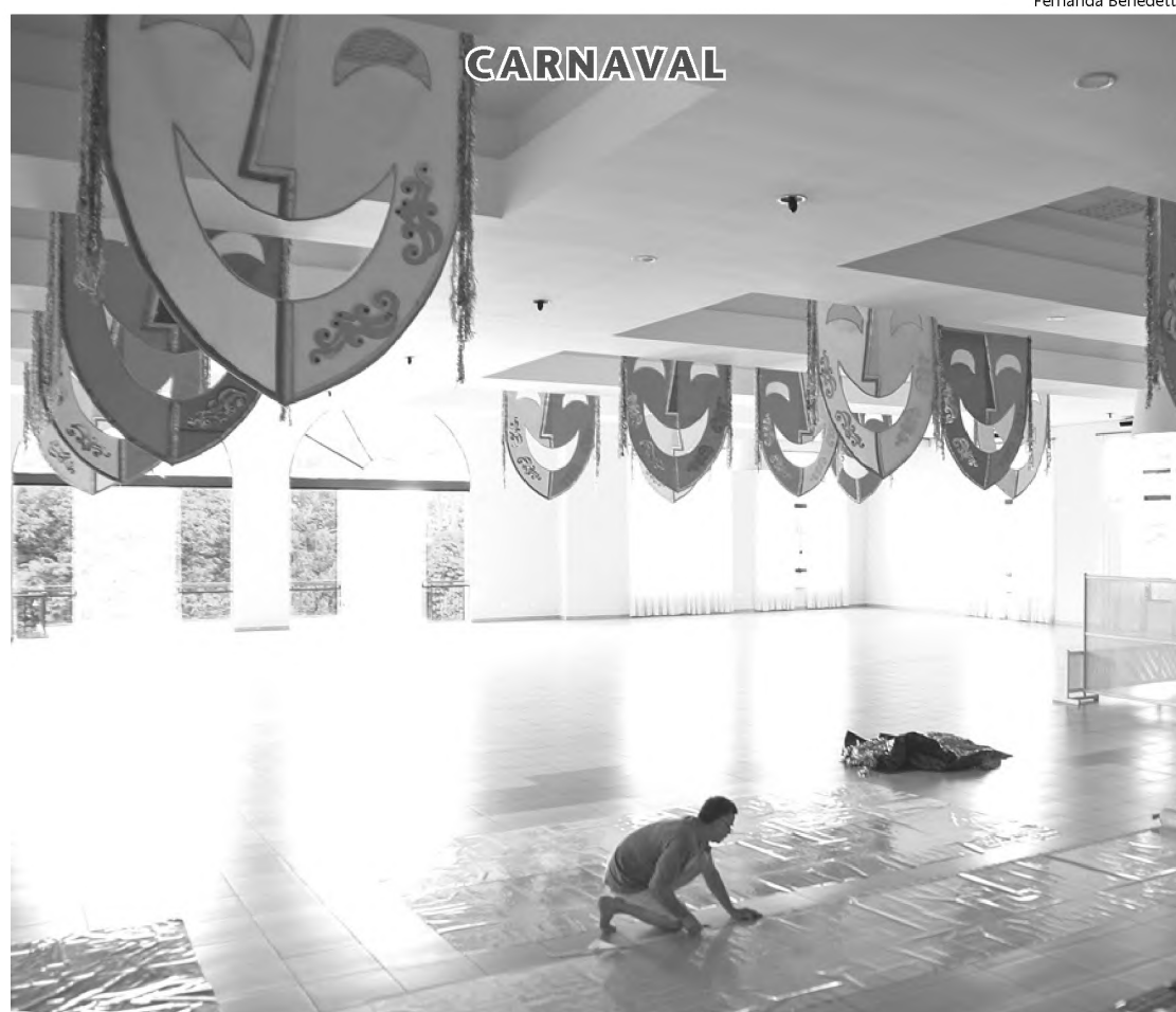
O clube Marimbondo já começou a ser decorado; crianças devem usar roupas leves e ingerir água