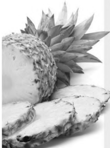
Ananas comosus » abacaxi » fluidificante das secreções das vias aéreas superiores