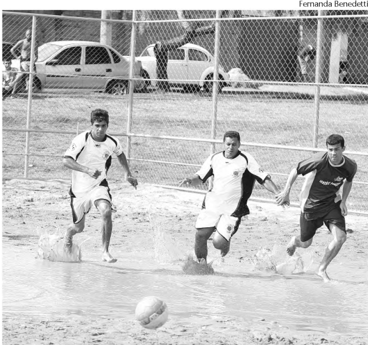
Primavera/Millennium e Grêmio Cecap se enfrentam no domingo