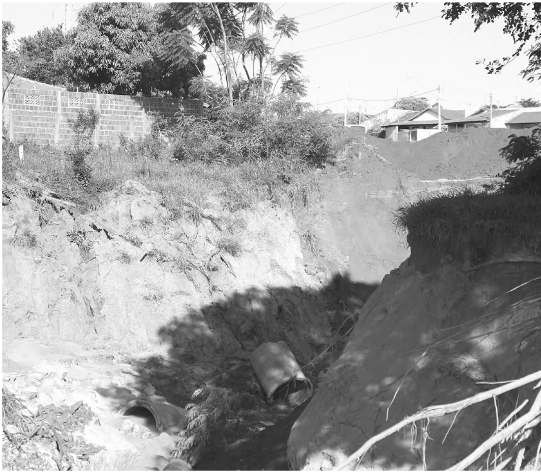
Buraco na Vila Angelina deixa moradores preocupados; Prefeitura trabalha no local