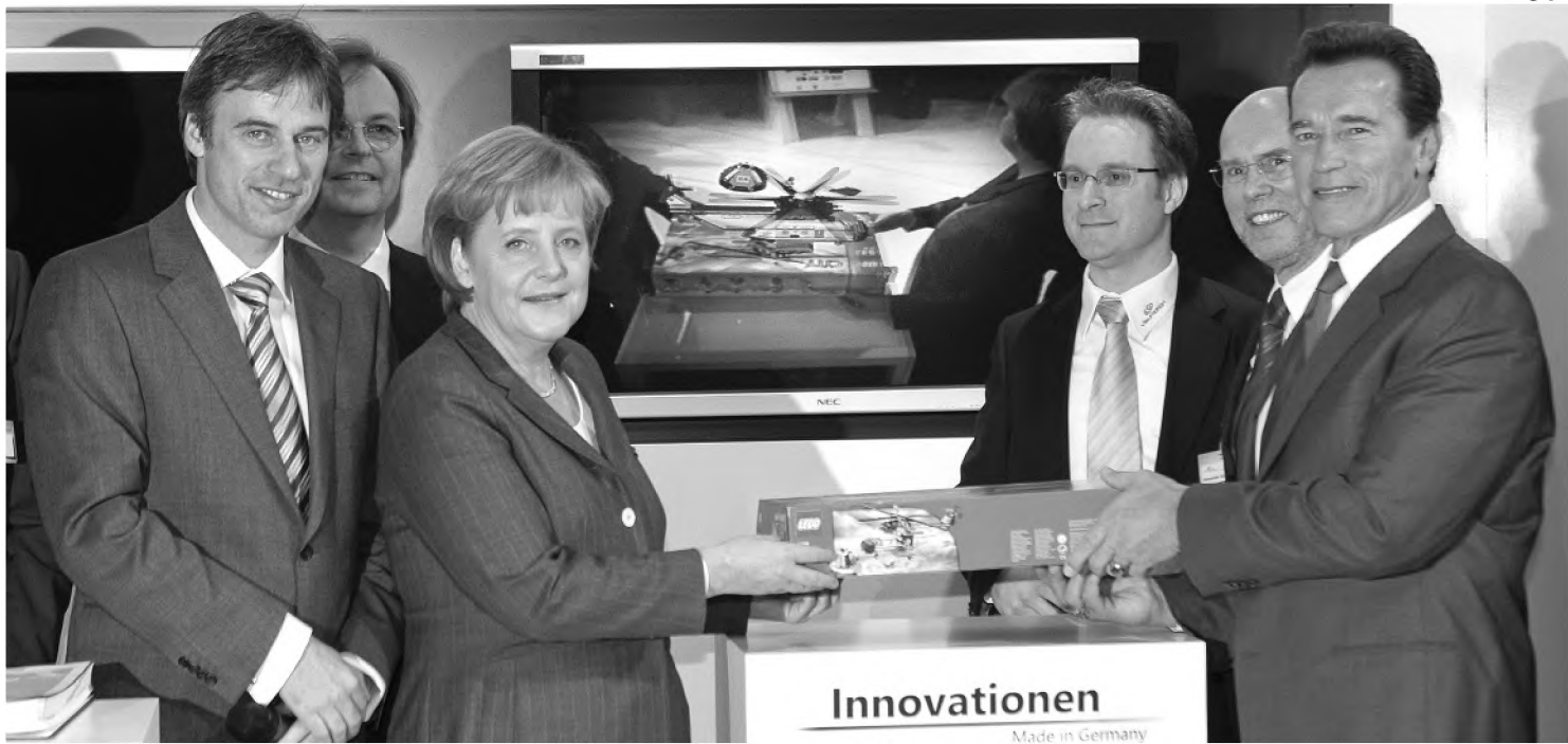
O ator e governador do estado da Califórnia dos Estados Unidos, na feira Cebit 2009, que encerrou na semana passada

Como atração não-tecnológica, destaque para a participação do ator e governador da Califórnia (EUA), Arnold Schwarzenegger, que passeou, fez discurso e distribuiu autógrafos na feira.