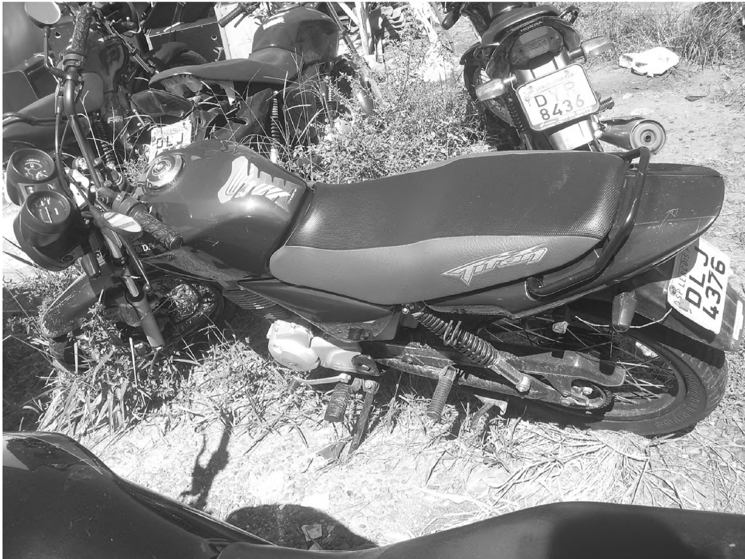
Moto que foi apreendida com dois rapazes que praticaram um roubo na Vila Cruzeiro está no pátio da Delegacia de Lençóis

Além desses dois presos ontem, a polícia já prendeu um outro homem na semana passada e deve pedir a prisão preventiva de um rapaz que caiu da moto e quebrou a perna, mas teria sido reconhecido por uma das vítimas do roubo a um posto de combustíveis na semana passada. Um outro suspeito está sendo procurado. O delegado Luiz Cláudio Massa acredita que os roubos são realizados por vários motoqueiros.