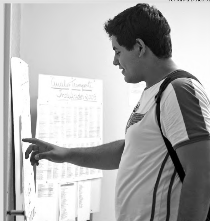
Ontem, estudantes queriam saber se pedido do benefício havia sido deferido pela Prefeitura de Lençóis