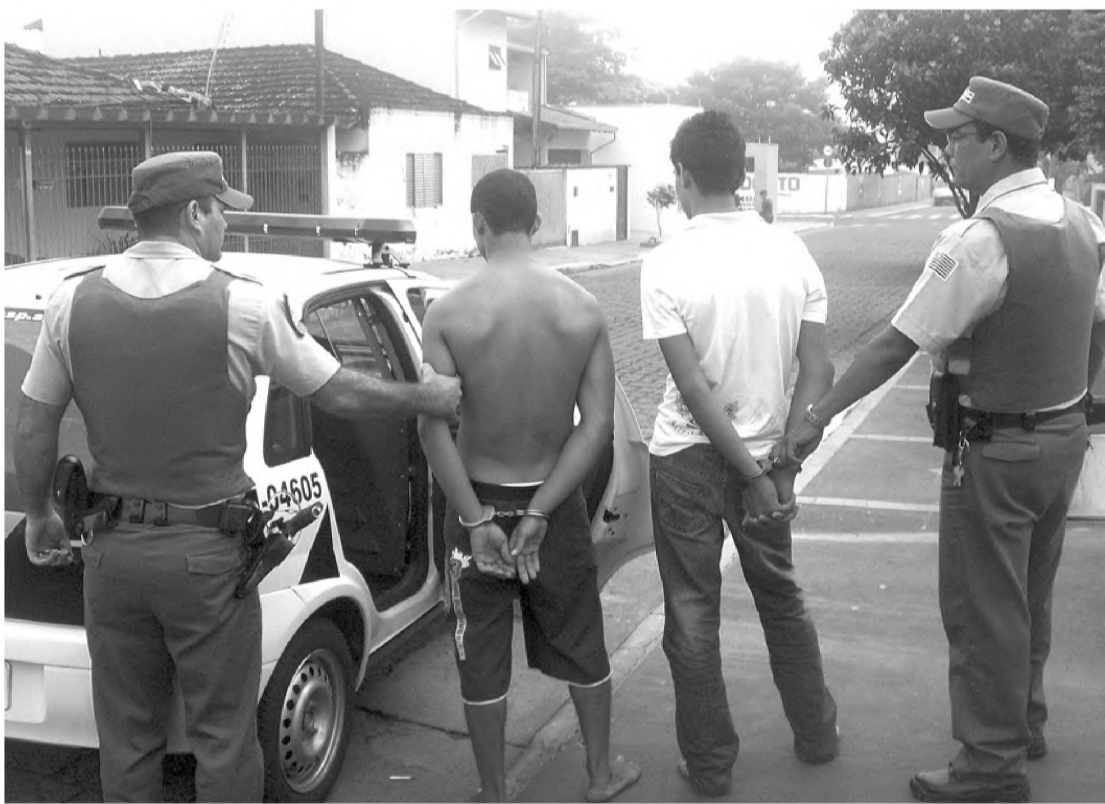
Polícia de Macatuba prende acusados de tentativa de roubo no Jardim América