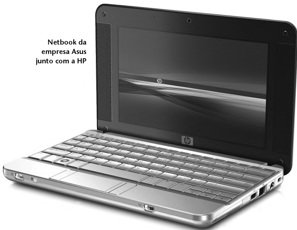
Netbook da empresa Asus junto com a HP

de disco rígido fica em torno dos US$ 450 (R$ 1.070) nos Estados Unidos. Nas configurações mais básicas, o valor cai para US$ 300 (R$ 690).