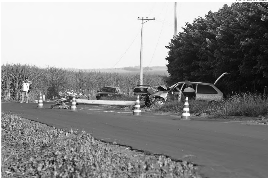
Sem controle, Gol derrubou um poste de energia nas Chácaras São Judas Tadeu

Na tarde de domingo, foi registrado um acidente que aparentemente seria o mais grave. Um Gol colidiu e chegou a derrubar um poste de energia. O caso aconteceu por volta das 15h30, na rua São Simão, nas Chácaras da São Judas Tadeu. O pedreiro M.A.J., 22 anos, seguia pela local com um Gol, placas de