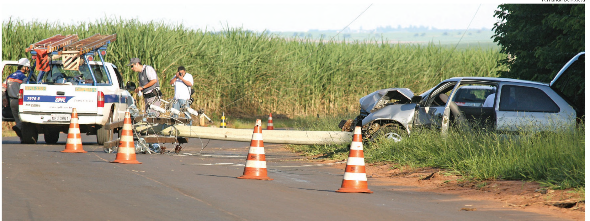
Pedreiro perde a direção do Gol e se choca com um poste de energia; apesar da forte pancada, tanto o motorista quanto o carona tiveram ferimentos leves