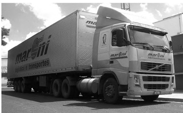
Caminhão roubado em São Paulo foi abandonado em Macatuba

A Polícia Militar chegou até o veículo a partir da informação de um trabalhador rural que passava pelo local. Ele achou entranho o caminhão abandonado e acionou a polícia.