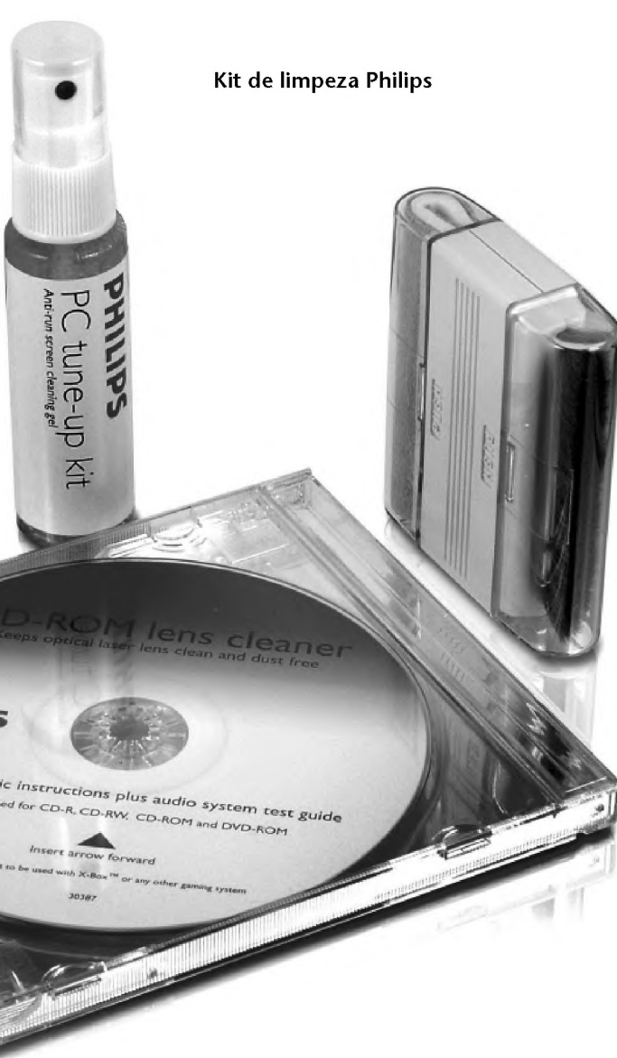
Kit de limpeza Philips

Ferramentas como o Excel ou sites como o Remember