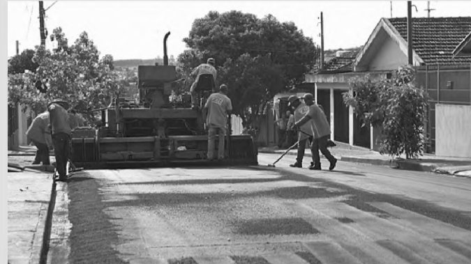
Rua dos Expedicionários, Vila Mamedina, recapeada ontem

A diretoria de Obras de Lençóis Paulista começou ontem o recape nas Vilas Mamedina e Maria Cristina e Jardim Éden. A previsão é de que os trabalhos sejam realizados em 10 dias, caso não chova neste período.