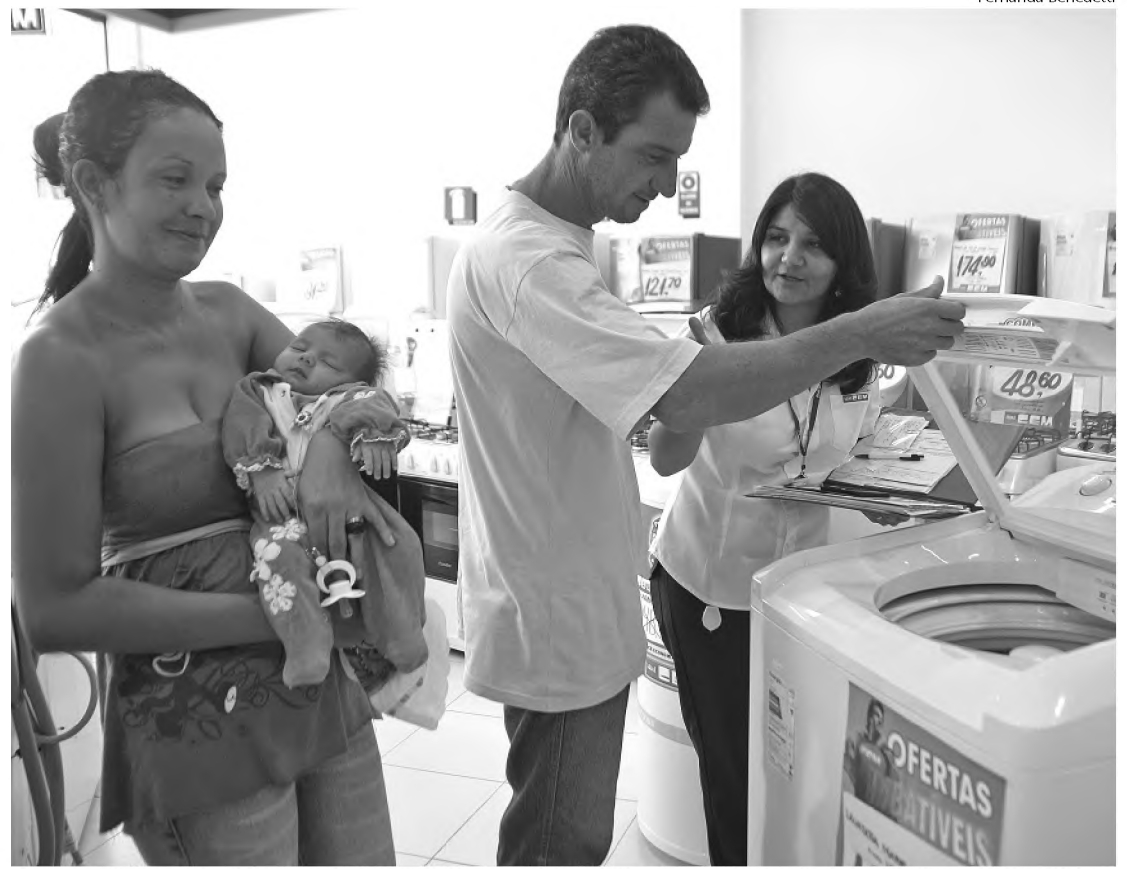
A procura por geladeiras, máquinas de lavar e tanquinho aumentou nas lojas de Lençóis Paulista

Com a redução no IPI e os descontos oferecidos por algumas lojas os preços podem cair até R$ 400. Na prática, é difícil fazer uma economia tão grande. Por exemplo, a geladeira duplex mais em conta caiu de R$ 1.198,00 para R$ 1.102,00, redução de R$ 96,00. Numa lavadora que custa R$ 1,4 mil, se for aplicada a redução de 20% para 10% no IPI, o valor pode cair em R$ 140,00. Em produtos como o fogão e o tanquinho, a redução de preços deverá ser menor porque a alíquota de IPI sobre estes produtos era inferior à da geladeira e da máquina de lavar.