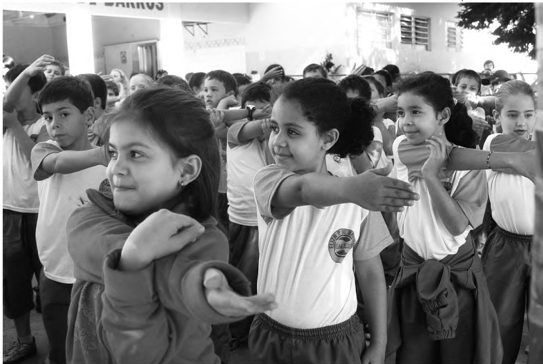
No ano passado, os alunos da escola Eliza Pereira de Barros ajudaram Lençóis a vencer o desafio