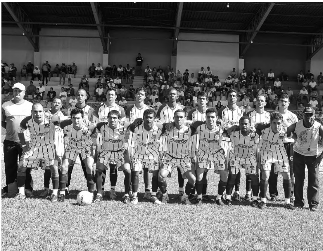
A equipe Calhas do Valle (foto) faz o último jogo do Torneio Início contra o Palestra

No domingo dia 7 de junho tem início do campeonato que conta com a participação de dez equipes. O grupo A é formado pelas equipes do Expressinho/Pitoli/Trigal, Grêmio União, Grêmio Cecap/