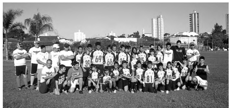
Os Hawks representam Lençóis Paulista no futebol americano

A equipe de futebol americano Lençóis Paulista Hawks vem fazendo bonito nas competições que participa. Na semana passada recebeu o Avaré Black Horse e venceu por 54 a 13. O time de Avaré foi campeão do Torneio da Integração, em 2008, e atualmente participa da LPFA (Liga Paulista de Futebol Americano & Flag), o Campeonato Paulista da modalidade.