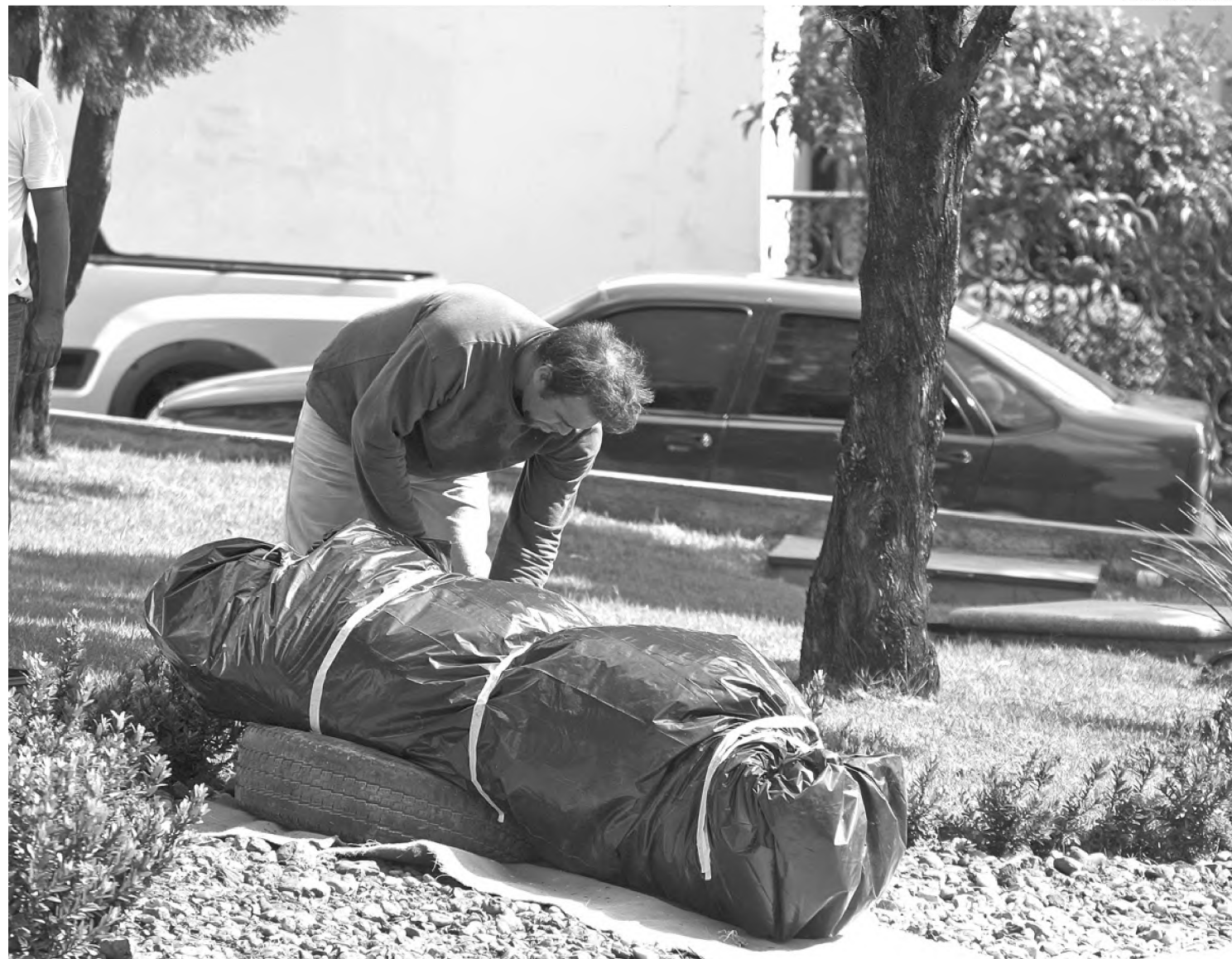
Missa e inauguração das imagens sobre as dores de Maria, no domingo, encerram Missão Mariana; imagens ficam cobertas até lá

Missão Mariana termina no domingo 31, em Lençóis Paulista, com missa e inauguração de imagens sobre as sete dores de Maria, na praça do Santuário