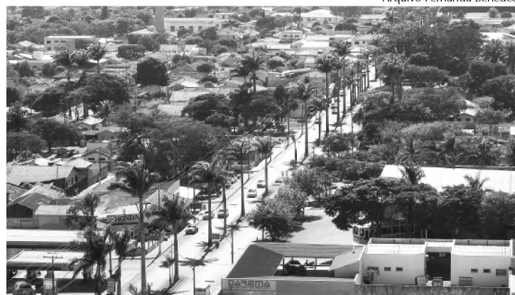
Macatuba deve receber R$ 125 mil de complementação do FPM

Paulo Bernardo destaca que apesar da queda da arrecadação federal, estimada em cerca de R$ 50 bilhões no ano, o presidente Luiz Inácio Lu-