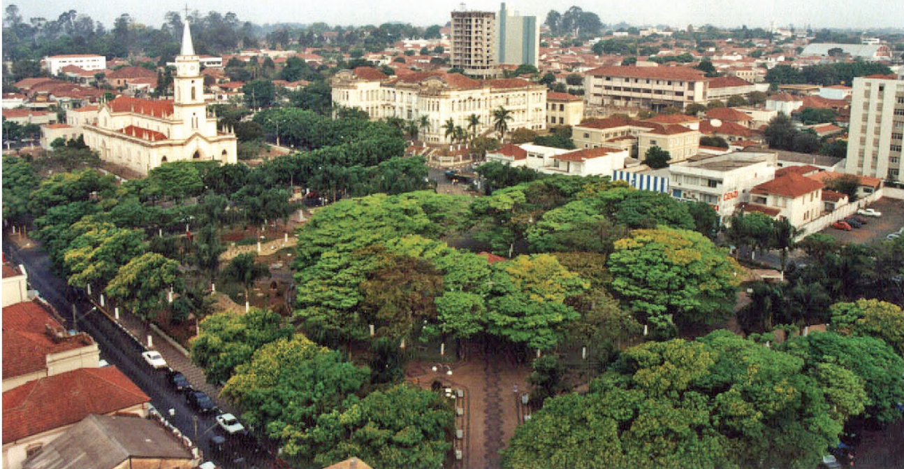
Pirassununga sedia a partir de amanhã a 53ª edição dos Jogos Regionais e aguarda 50 delegações de atletas

O cerimonial de abertura dos Jogos acontecerá nesta quarta-feira, 15 de julho, a partir das 19h, no ginásio poliesportivo Dr. Lauro Pozzi.