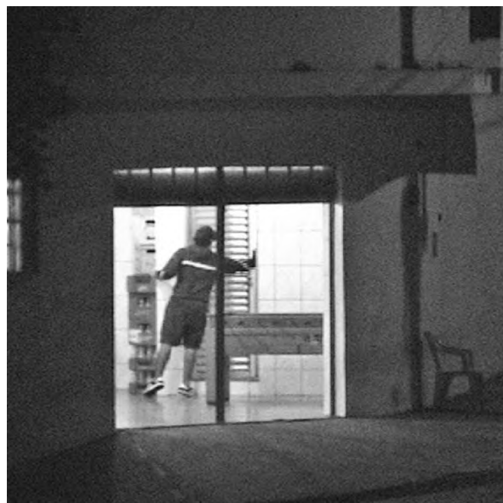
Policial à paisana filmou a movimentação criminosa no bar e esperou o momento certo para dar o flagrante; foram encontrados 36 pedras de crack com o suspeito

Rapaz de 24 anos foi preso por tráfico de drogas em Lençóis; ação foi realizada pela Força Tática