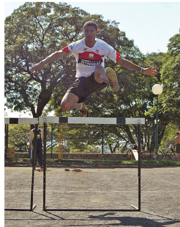
Atleta de Lençóis treina na pista de atletismo