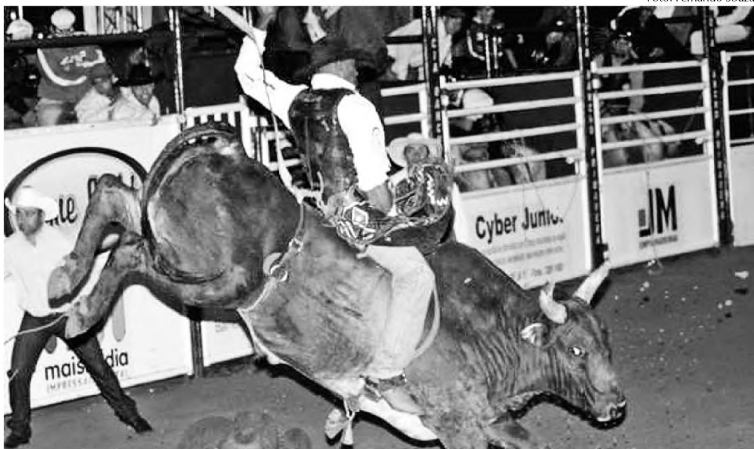
Peão de Lençóis Paulista fica em segundo no rodeio de Agudos; encerramento foi no domingo