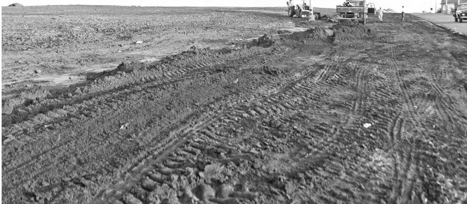
Construtora já começou a implantar rede de água e esgoto na área escolhida para moradias do programa 'Minha Casa, Minha Vida'

O local escolhido para abrigar as casas é o residencial Santa Terezinha 1 e 2, que fica próximo ao Cemitério Paraíso da Colina. A rede de esgoto está pronta e nos próximos dias será concluída a rede de água. A informação é da construtora.