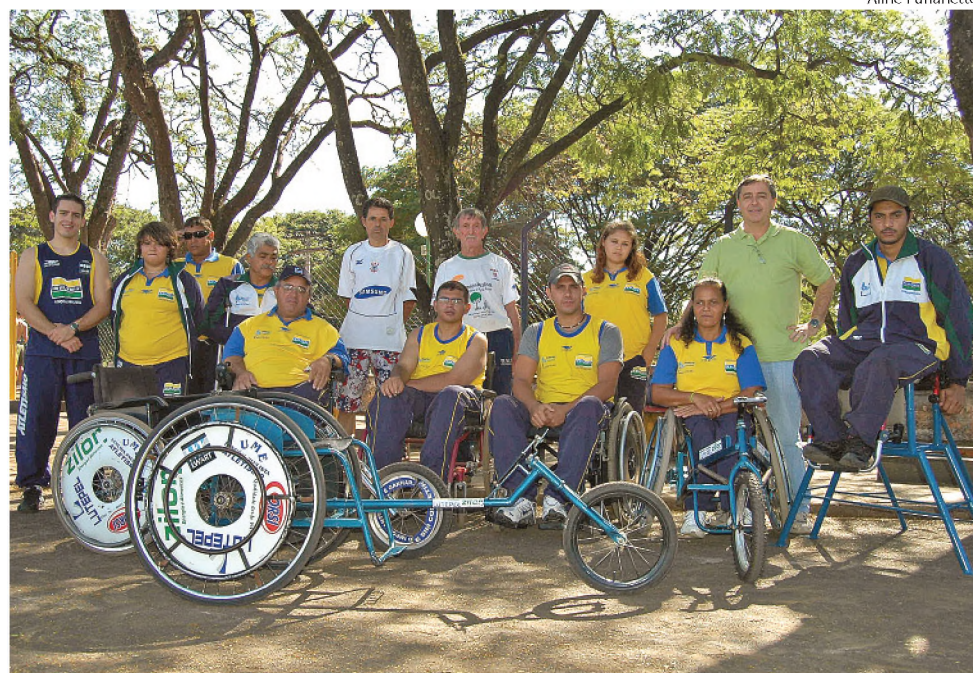
Equipe especial de atletismo quer superar as 21 medalhas conquistadas em Lins, em 2008

Em Pirassununga, ele promete repetir os três ouros e alcançar, no mínimo, a prata no lançamento do disco. “Estou confiante de que poderei melhorar ainda mais a minha participação nos Jogos Regionais. Treinei o ano todo para isso, para disputar as mesmas provas e pegar medalhas em todas”, des-