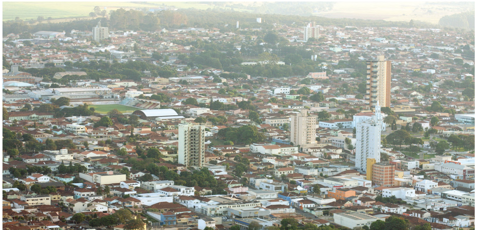
Lençóis Paulista já foi sede dos Jogos Regionais há quase 20 anos, em 1992; diretor de Esportes diz que ainda falta infraestrutura e alojamentos

caso decidamos entrar na briga para ser sede”.