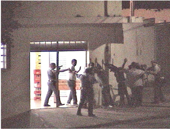
Imagem do momento em que traficante foi preso