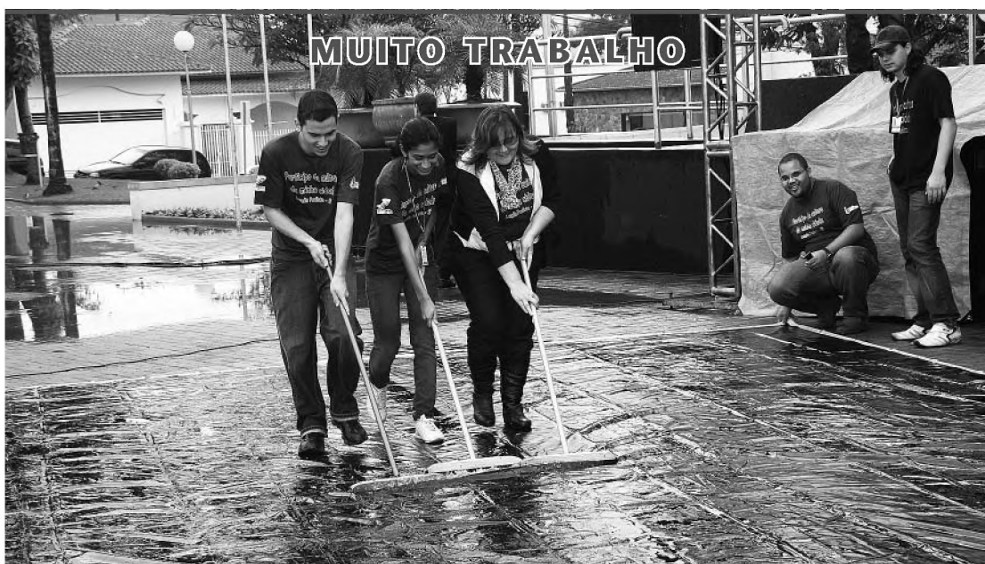
A turma da organização do Dia do Reencontro teve muito trabalho durante o evento que aconteceu no sábado 11. Quando a chuva dava uma trégua, era preciso secar a lona para que as apresentações acontecessem. Infelizmente o tempo não ajudou, a lona foi retirada e as apresentações canceladas.

Os artigos assinados são de inteira responsabilidade de seus autores e não representam, necessariamente, a opinião deste jornal