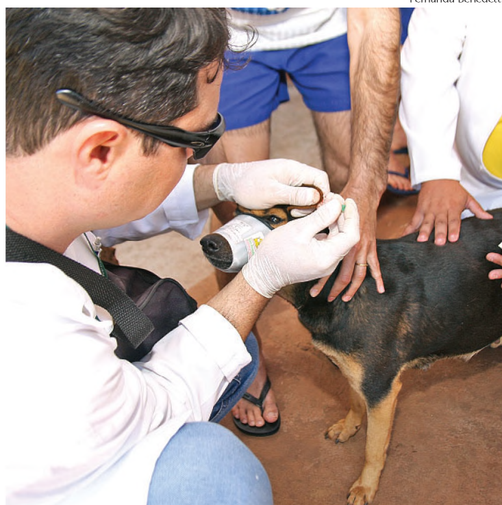
No Parque Rondon, ontem foi dia de exames para os cães

O trabalho de coleta de amostras de sangue para medir o avanço da leishmaniose em Lençóis Paulista pode ser prorrogado. A ação foi determinada pela Sucec (Superintendência de Controles de Endemias). As equipes da Vigilância Sanitária da cidade devem coletar amostras dos animais que vivem entre o Parque Rondon e a Vila Bacili. Entre o final de 2008 e começo de 2009 foram registrados 30 casos de leishmaniose em Lençóis Paulista. A maioria dos casos foi considerada autóctone, ou seja, os cães contraíram a doença dentro do município, o que confirma a presença do mosquito palha, transmissor da doença. Por enquanto, não há casos em humanos. ► Página A7