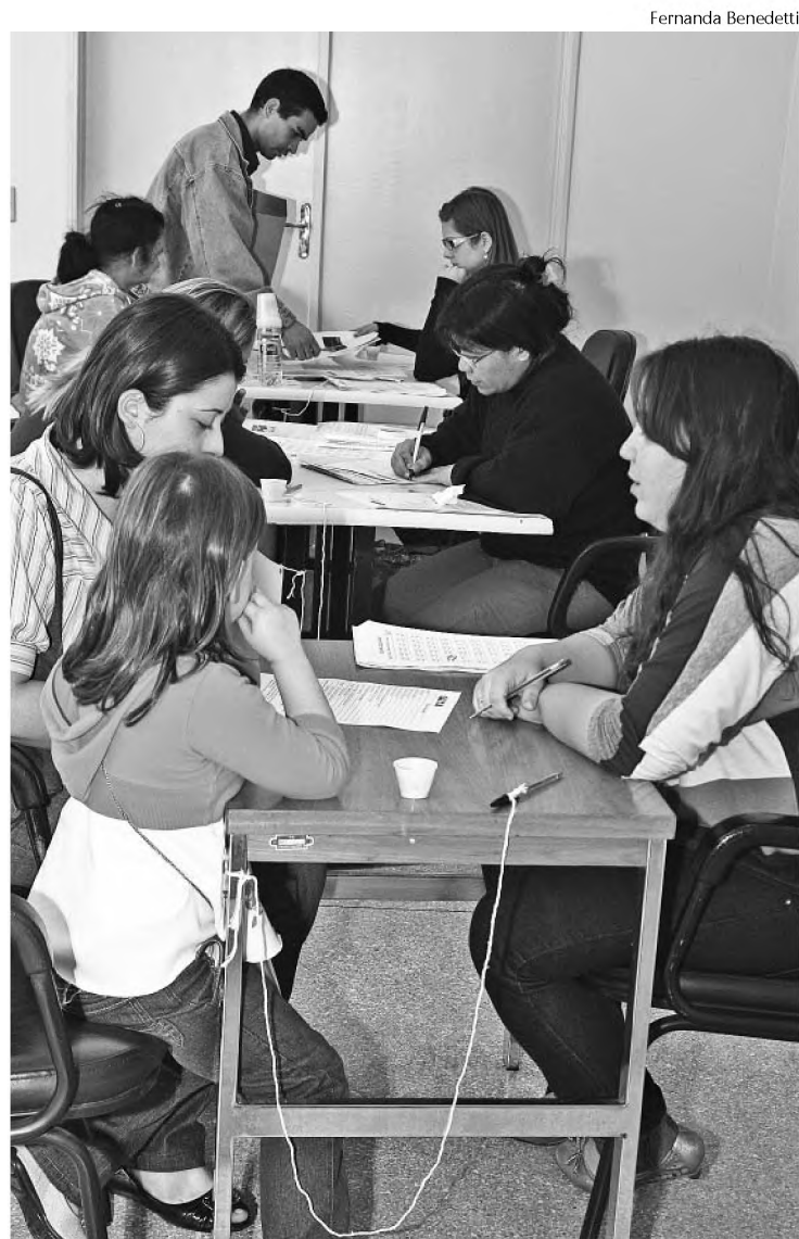
Teve gente que dormiu na fila para realizar sonho da casa própria

Informações sobre a ficha de cadastro e os documentos necessários podem ser obtidos no Centro de Atendimento ao Cidadão, que fica na rua Anita Garibaldi, das 8h às 17h, sem horário de almoço, de segunda a sexta-feira, até o dia 31 de julho.