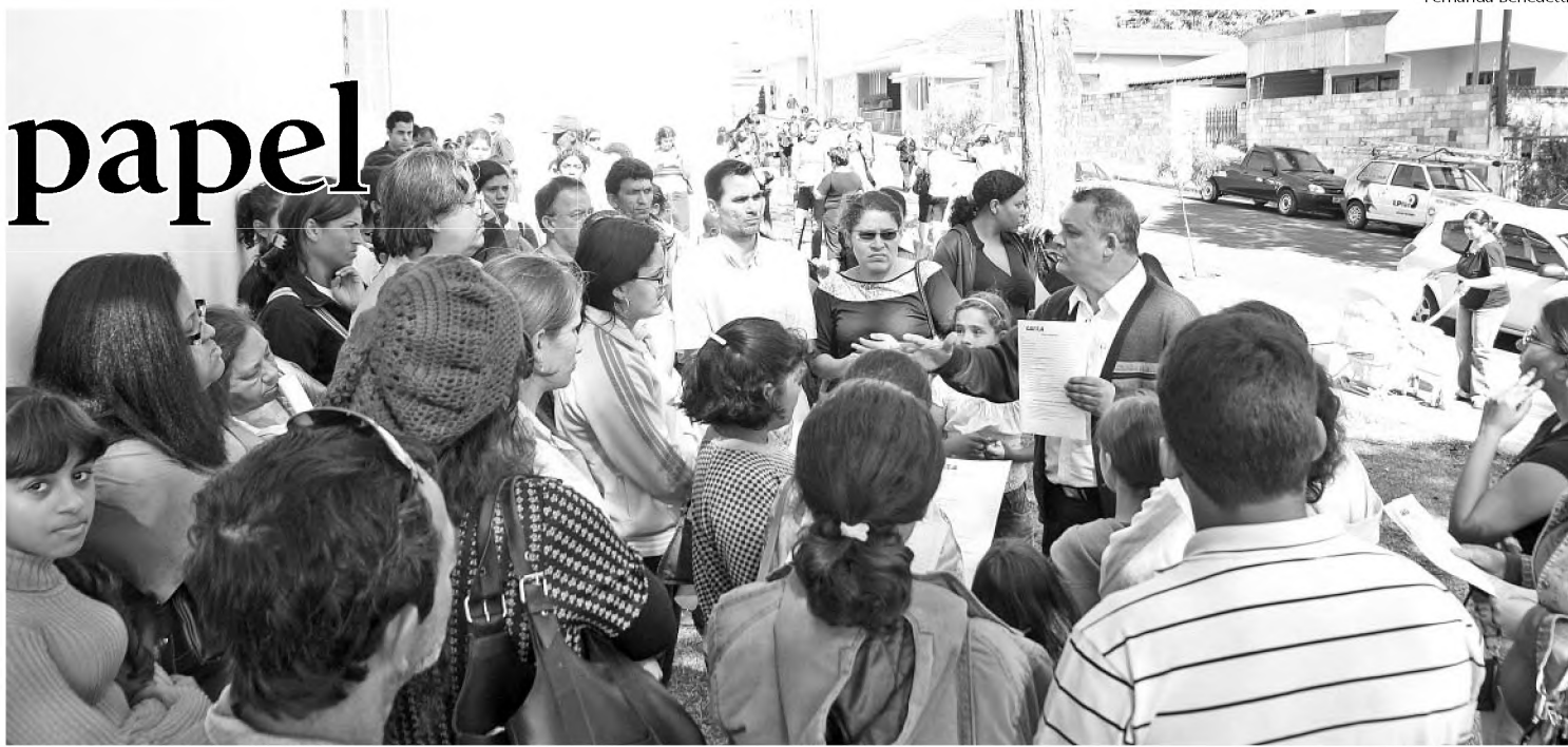
Centenas de pessoas se aglomeraram em frente ao Centro de Atendimento ao Cidadão em busca da casa própria na manhã de ontem

As casas serão construídas no Residencial Santa Terezinha 1 e 2 pela Construtora Marimbondo, que já está habilitada na Caixa Econômica Federal.