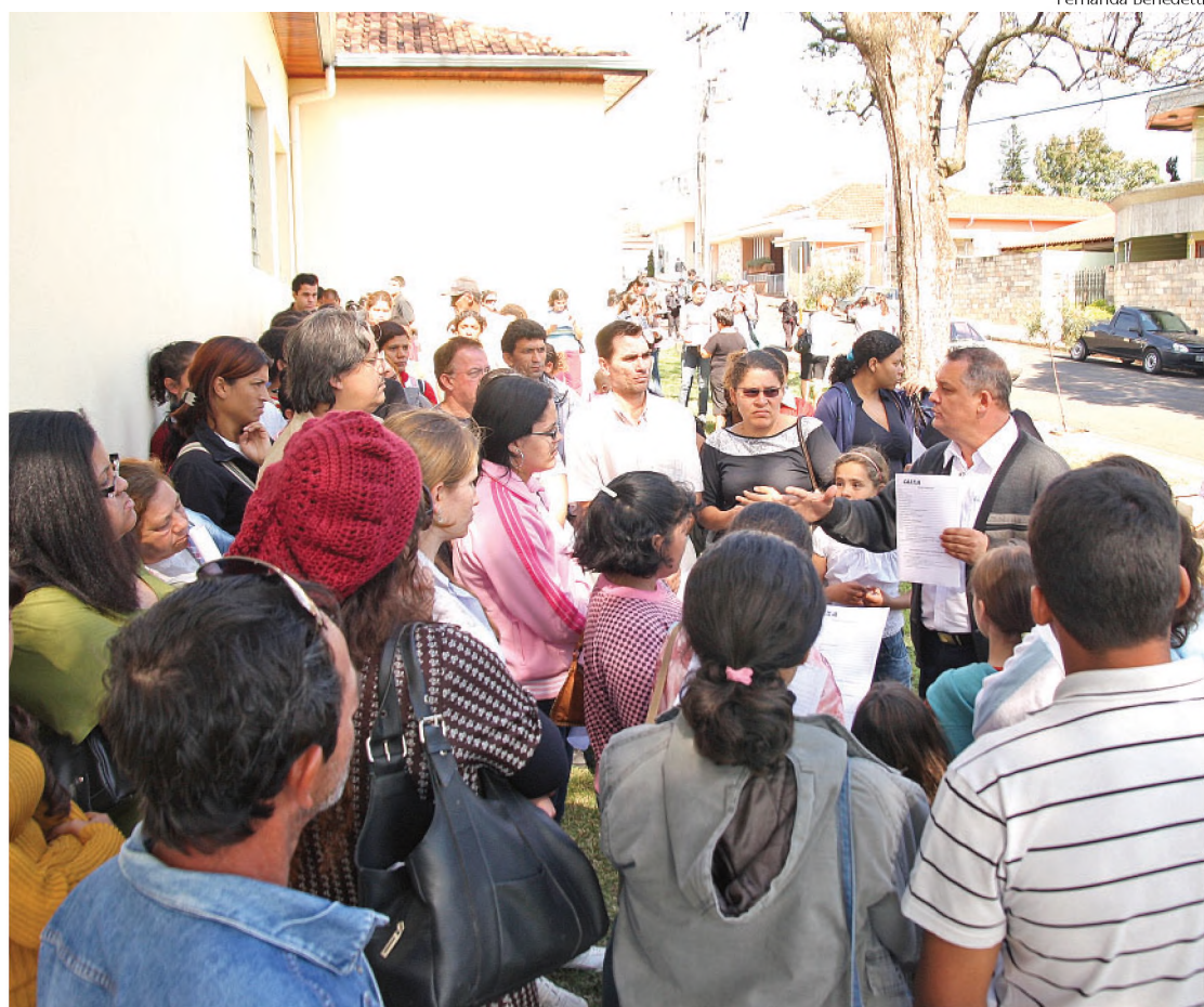
Mais de 1,4 mil pessoas foram em busca da habilitação para o programa Minha Casa, Minha Vida