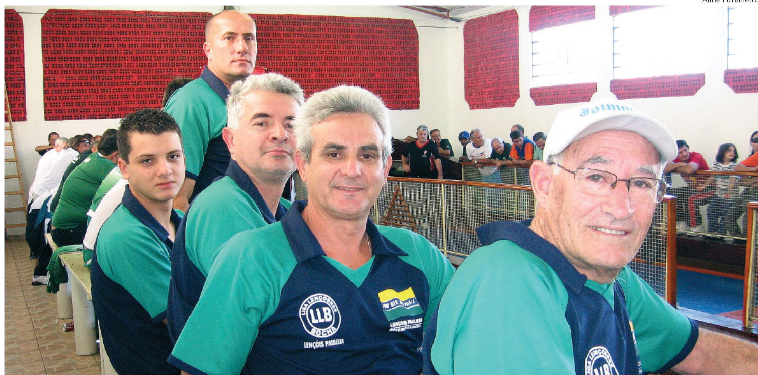
Equipe de bocha de Lençóis Paulista perde primeira, mas mira no tetracampeonato; reabilitação pode sair hoje contra Barra Bonita

"Com certeza, o páreo vai ser duro. Os jogadores já se conhecem porque se enfrentam em outras competições durante o ano. Barra Bonita é muito forte, temos muito respeito pelos jogadores. En-