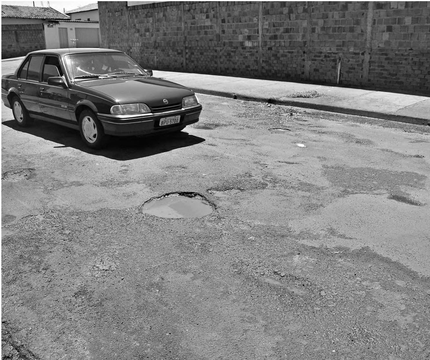
A rua Bandeira Tribuzi interliga três bairros e está cheia de buracos; Prefeitura anuncia galerias pluviais para conter o problema