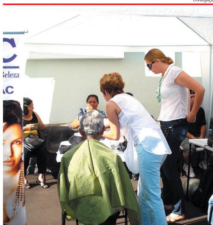
EFAC ofereceu cortes de cabelo de graça para a comunidade