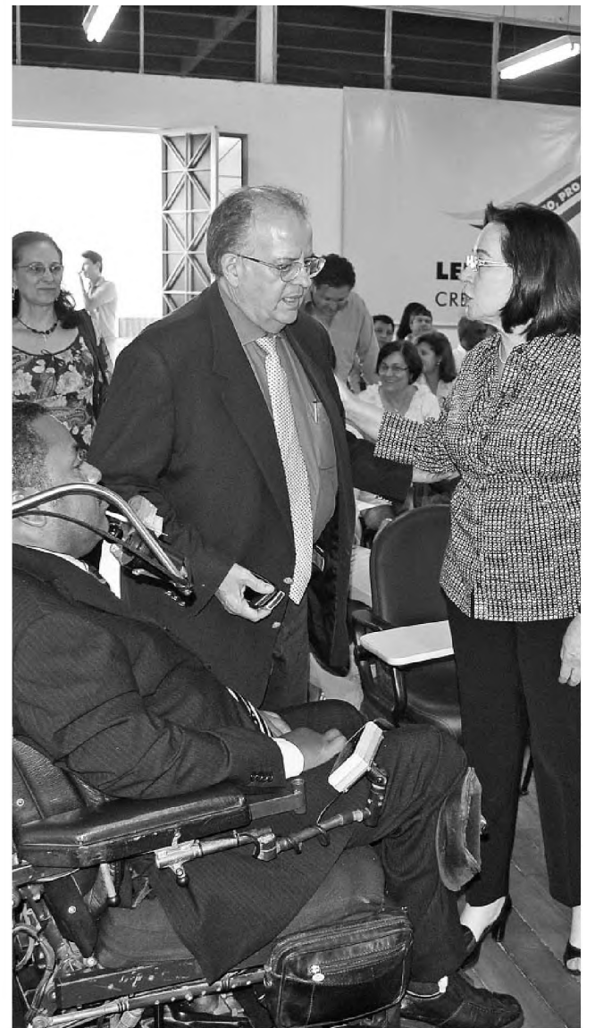
Bel recebeu convidados no lançamento do programa