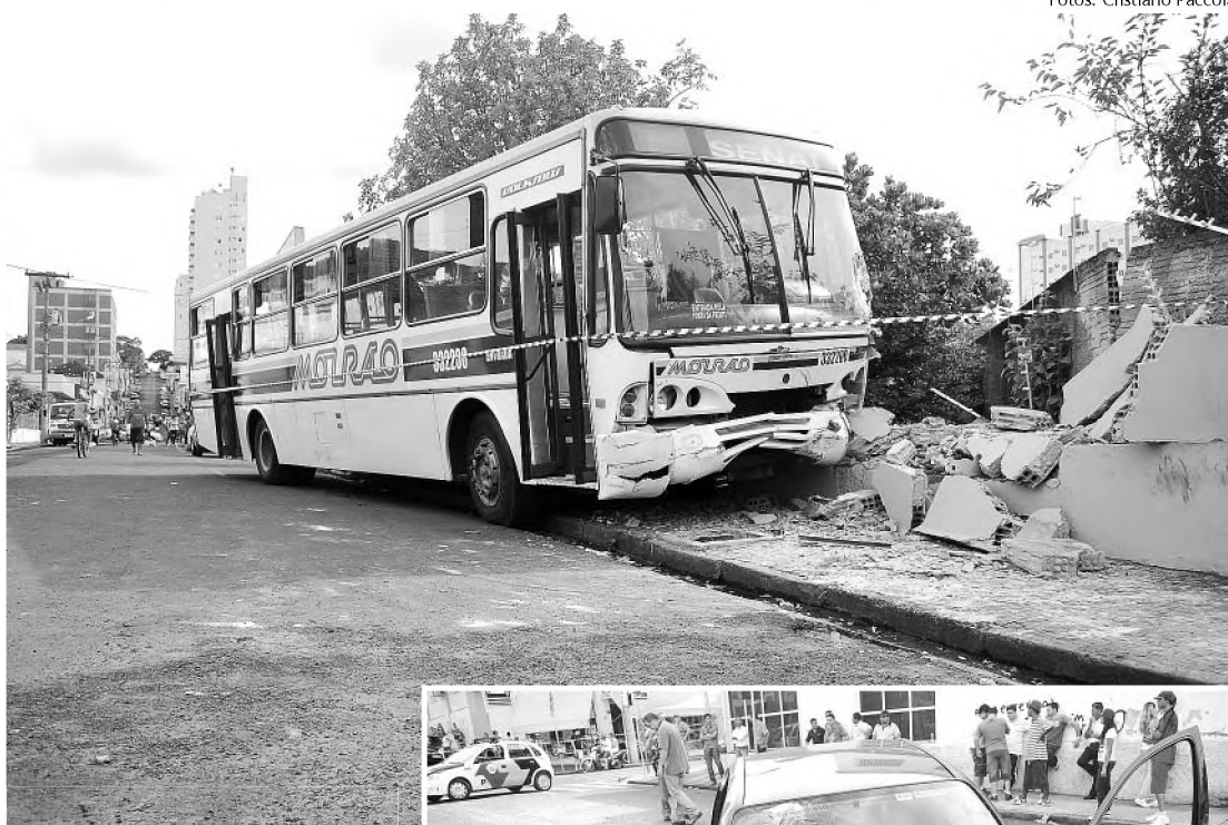
Sem freio, ônibus desceu pela rua Ignácio Anselmo e parou a poucos metros do Rio Lençóis

O motorista do ônibus informou ao jornal O ECO que estava descendo pela rua Ignácio