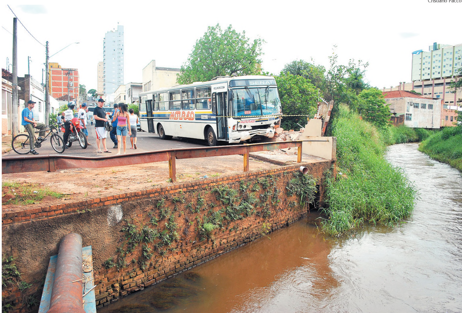
Ônibus circular perdeu freio no cruzamento das ruas Geraldo Pereira de Barros e Ignácio Anselmo e quase caiu no Rio Lençóis