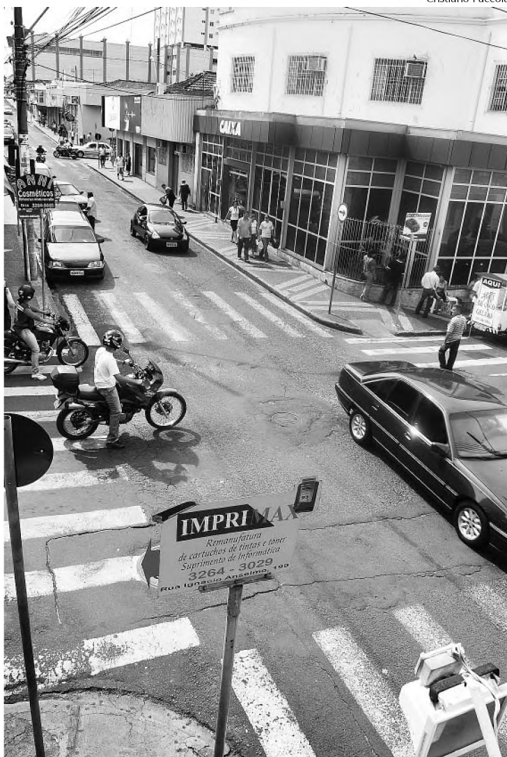
Prefeitura quer transformar rua XV de novembro em bulevar

Além da transformação da rua XV de Novembro em bulevar, outras iniciativas já definidas pela Prefeitura devem contribuir para desafogar o trânsito de forma imediata. A primeira etapa, que será custeada com recursos próprios e já está na Comutran (Comissão