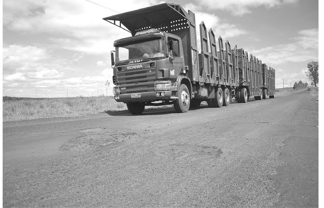
Vicinal Antonio Carlos Vaca em Borebi, que leva o município até a Marechal Rondon, está em boas condições; rodovia da Amizade, que liga Borebi e Agudos, está em péssimo estado de conservação