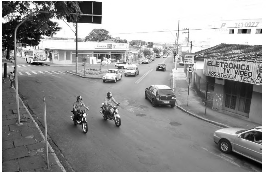
Local onde deverá ser construída uma rotatória no cruzamento da rua Piedade e avenida Ubirama

Outro projeto que deve modificar o trânsito, neste caso, um pouco mais afastado do centro comercial, é a construção de uma rotatória na rua 13 de Maio. Um projeto da Prefeitura pede a doação do Governo do Estado, de uma área da escola estadual Paulo Zillo onde será construída a rotatória. De