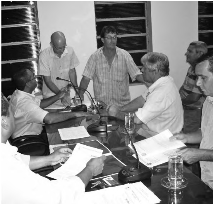
Projeto da autarquia deve entrar para votação na próxima semana

O texto não é muito extenso e altera duas leis já em vigor na Lei Orgânica. O artigo 4º, da lei nº 1.530, de 4 de setembro de 1991, agora estabelece que o departamento de saneamento fica responsável pelo abastecimento de água potável, captação, bombeamento, tratamento, reserva, distribuição na rede, controle de qualidade, enfim, tudo que é feito