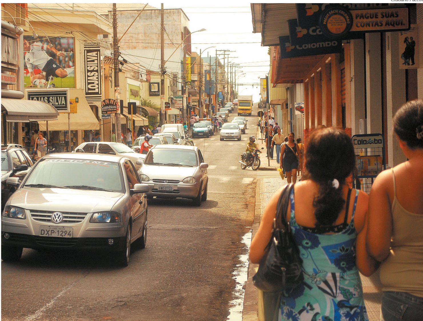
Para tentar resolver os gargalos do trânsito lençoense, Prefeitura anuncia remodelação da rua XV de Novembro para o próximo ano