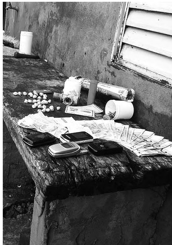
Polícia Militar apreendeu 42 pedras de crack e prendeu dois

Dois homens armados assaltaram, na tarde de terça-feira 10, uma empresa de cadernos que fica na Incubadora de Empresas de Agudos, localizada no centro da cidade. De acordo com informações da polícia, os bandidos teriam levado cerca de R$ 35 mil que seriam usados para fazer o pagamento dos funcionários.