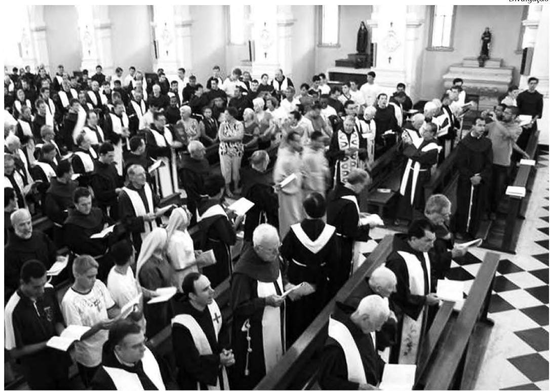
Frades franciscanos durante missa do Capítulo das Esteiras no Seminário de Santo Antonio