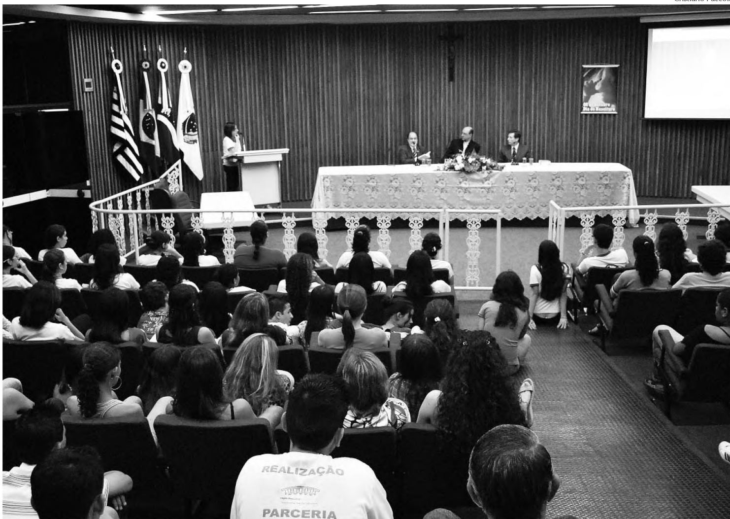
Na noite de segunda-feira, católicos e jovens discutiram aborto e eutanásia; encontro aconteceu no auditório da Câmara

O deputado, que é integrante da Comissão de Seguridade Social e Família e vice-presidente Comissão Legislativa Participativa do Congresso, defendeu a luta de parlamentares e da sociedade contra o aborto como forma de defender o equilíbrio social, se posicionou contra os métodos de controle de natalidade convencionais e defendeu que métodos naturais,