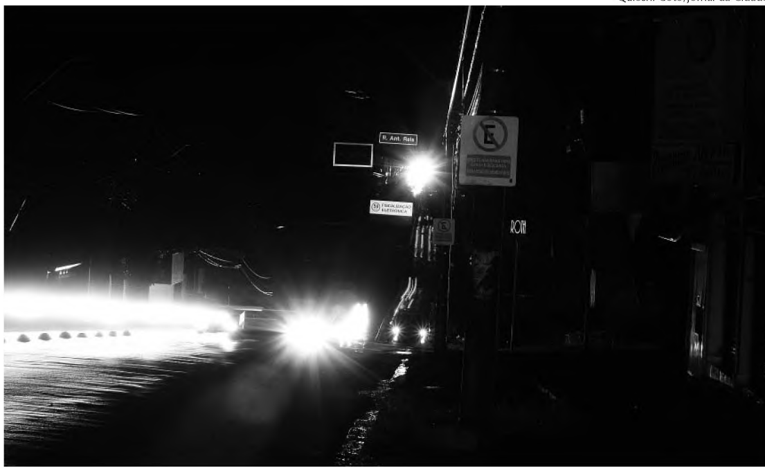
Na cidade de Bauru, o apagão durou mais de quatro horas e atrapalhou a vida de muita gente

O engenheiro da CPFL Energia explicou que as fontes de produção de energia da região conseguiram suprir a demanda e segurar o sistema até que a rede de Itaipu voltas-