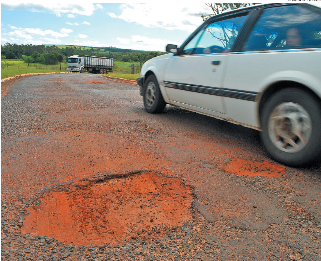
Vicinal que liga Borebi a Agudos tem excesso de buracos e falta de acostamento e sinalização

A vicinal Rodovia da Amizade deve se tornar uma das principais alternativas para quem pretende fugir do pedágio na Rodovia Marechal Rondon (SP-300), em Agudos. A escolha requer avalia-