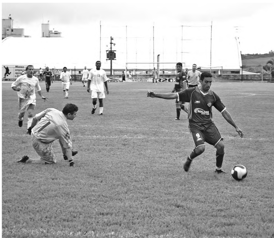
Atacante do São Manuel driblou o goleiro, marcou o gol e confirmou a vitória sobre o Expressinho