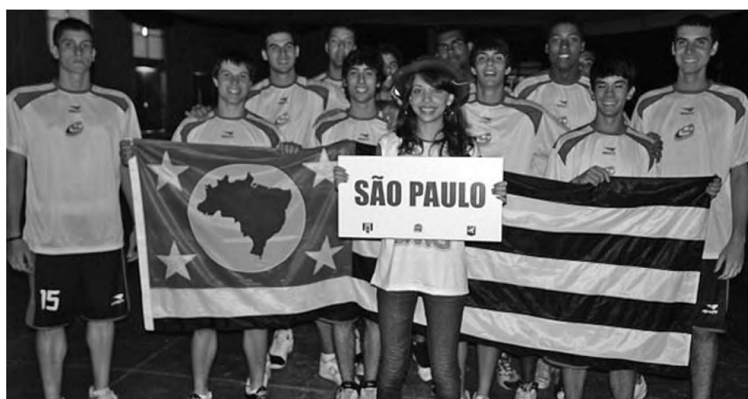
Invicta, Seleção Paulista de basquete garantiu o título do Brasileiro