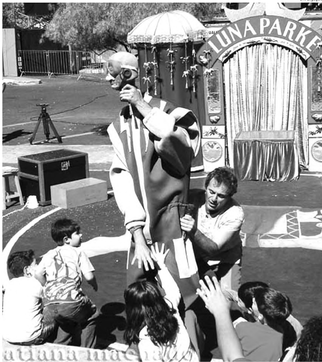
Grupo La Mínima traz mais uma vez para Lençóis Paulista o espetáculo Luna Parke