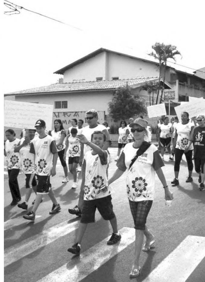
Passeata ecológica movimentou colaboradores da Adria