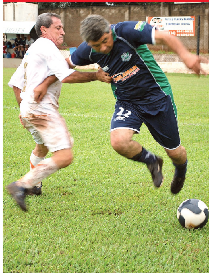
Lance da partida que marcou a final da Copa Master de Futebol