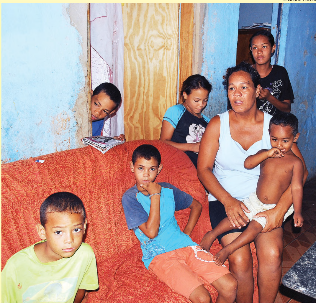
Família de Macatuba que é assistida pelos Vicentinos; entidades precisam de alimentos

A campanha Natal sem Fome entra em sua reta final faltando 10 dias para o Natal. Com o apoio do Jornal O ECO e da rádio HOT 107, a iniciativa tem o objetivo de contribuir com o trabalho de quatro entidades assistenciais que amparam famílias carentes em Lençóis Paulista, Macatuba, Agudos e Areiópolis. Em Lençóis Paulista, a parceria é com Ação da Cidadania. Em Agudos, com a Associação de Combate ao Câncer e em Areiópolis a campanha fica por conta da Associação Assistencial Santa Terezinha. Em Macatuba, a Sociedade São Vicente de Paulo, os Vicentinos, também já está fazendo a coleta. ► Página A5