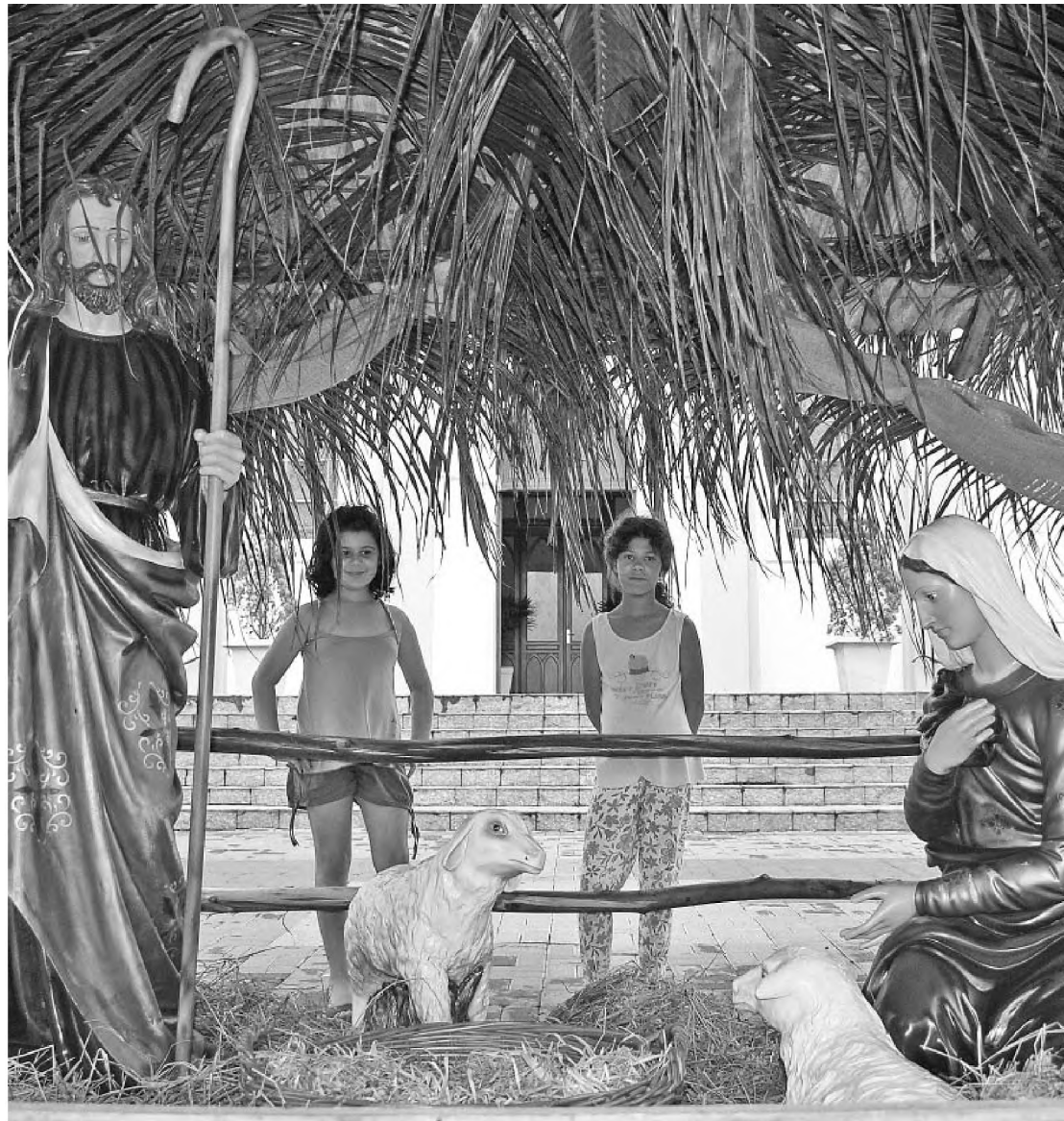
Presépio montado na praça do Santuário Nossa Senhora da Piedade atraiu fiéis de todas as idades

As confissões dos fiéis da paróquia serão recebidas