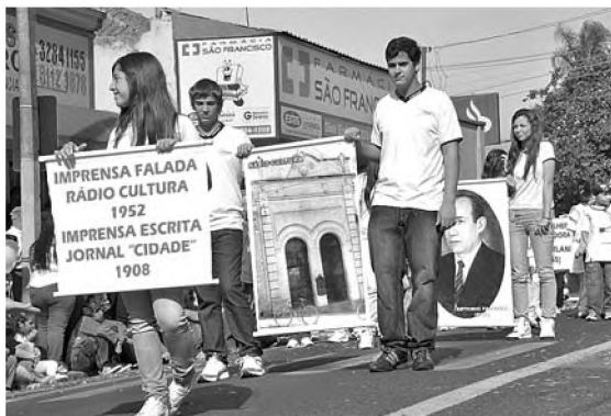
Coedup escolheu contar um pouco da história de Pederneiras durante o desfile de aniversário