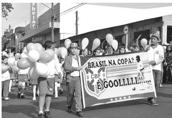
Participação do Brasil na Copa do Mundo foi o tema escolhido pela escola Eliazar Braga

O Colégio Preve Objetivo comemora 22 anos em Pederneiras e levou até trenzinho para o desfile. A Coedup, por sua vez, escolheu ensinar história: os primeiros habitantes, o primeiro time de futebol, a primeira vereadora. Alunos do Sesi apresentaram obras de arte.