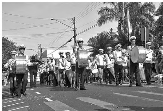
A escola do Sesi também participou do desfile e a fanfara empolgou quem foi assistir

Os motores roncaram no encerramento do desfile, com motoqueiros e carros antigos