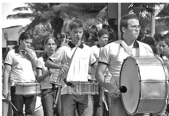
Fanfara do Colégio Francisco Garrido, de Lençóis Paulista, foi uma das convidadas