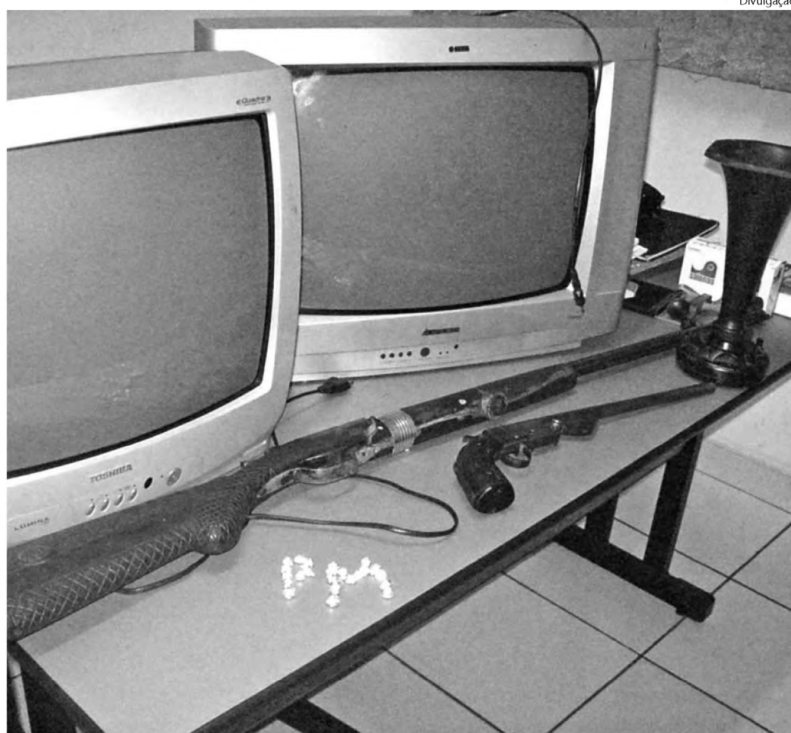
Na foto, televisores, armas de fogo e droga apreendida em duas casas de Macatuba

dim Sonho Meu, os policiais encontraram seis pedras de crack prontas para a venda, porém as TVs não foram localizadas. Nos fundos da residência foram localizadas ainda duas armas de fogo escondidas: uma garrucha calibre 36 e um espingarda calibre 12, que foram apreendidas. W.C.S., 19 anos, estava na ca-