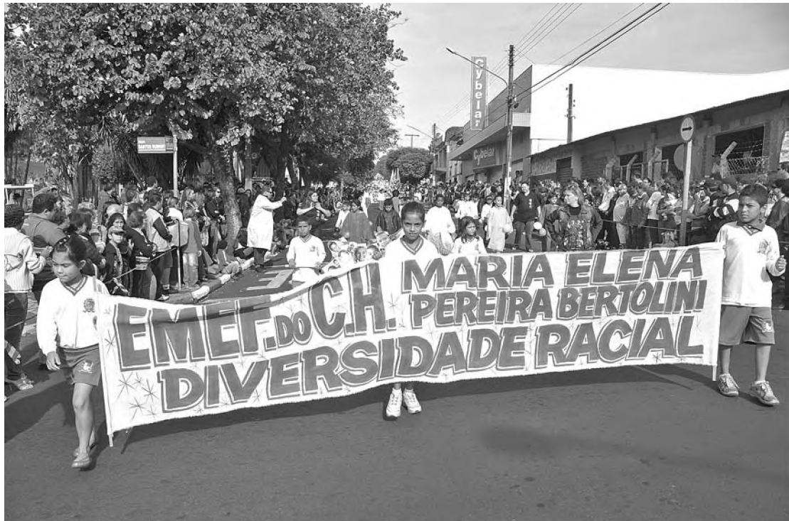
Alunos do ensino fundamental trouxeram a diversidade que caracteriza o município para a avenida