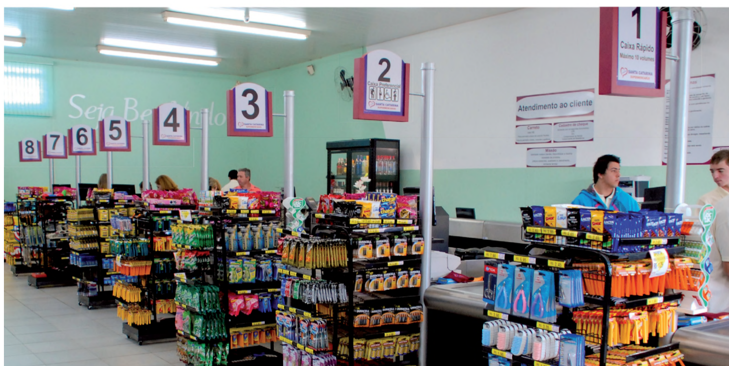
Hoje, a população de Lençóis e região encontra uma farta variedade de produtos nas lojas Santa Catarina

Na década de 90, o Santa Catarina começou a informatizar o sistema. Agora, é o computador que calcula o estoque, cadastra clientes e registra o código de barras. O cartão também virou uma opção de pagamento. “Nós nos adaptamos à correria do dia a dia”, afirma o comerciante.