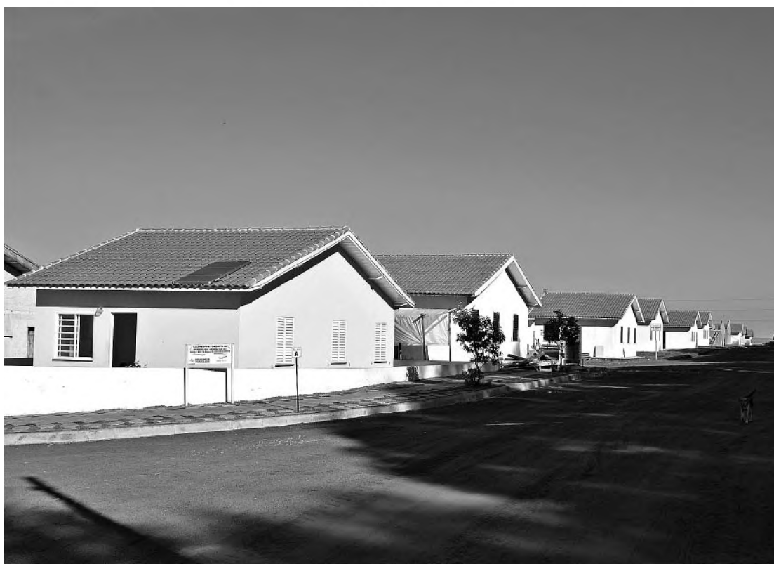
Programação começa com visita a conjunto habitacional

O evento acontece no sábado 24. Às 8h30 haverá uma visita às unidades acessíveis no Conjunto Habitacional Lençóis Paulista D, no prolongamento do Jardim Caju. Às 9h30 tem palestra na Câmara Municipal com técnicos do governo do Estado e do Crea (Conselho Regional de Engenharia, Arquitetura e Agronomia).