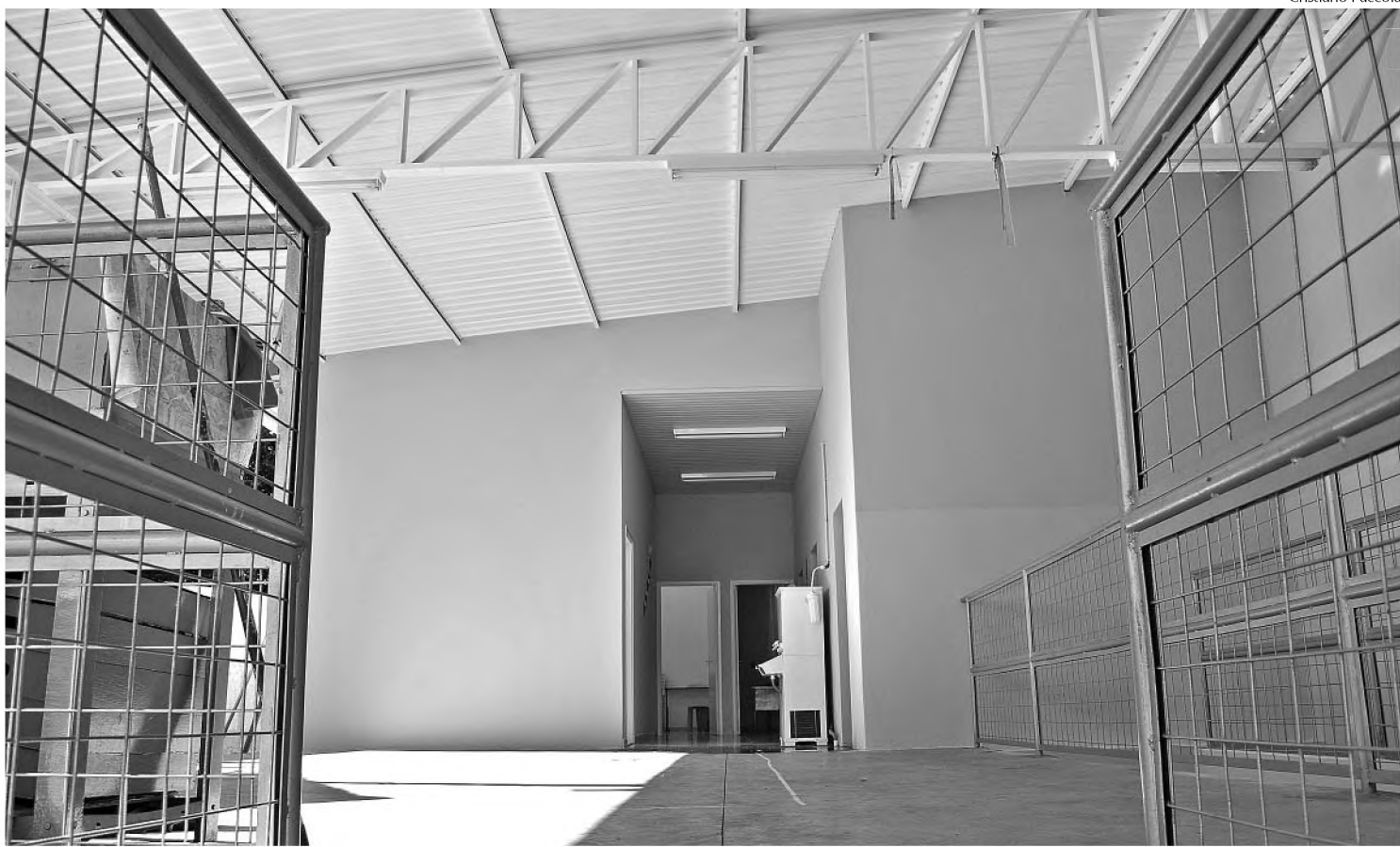
Prefeitura investiu mais de R$ 149 mil na reforma e ampliação do prédio de Alfredo Guedes; Centro Comunitário atende 83 crianças