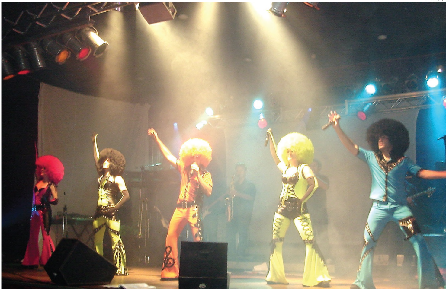
Revolution Banda Show que se apresenta na Festa dos Melhores, dia 21 de agosto; grupo faz um tributo ao ABBA

Revolution Band Show agita festa do jornal O ECO com tributo ao ABBA; evento está marcado para 21 de agosto, no Clube Esportivo Marimbondo