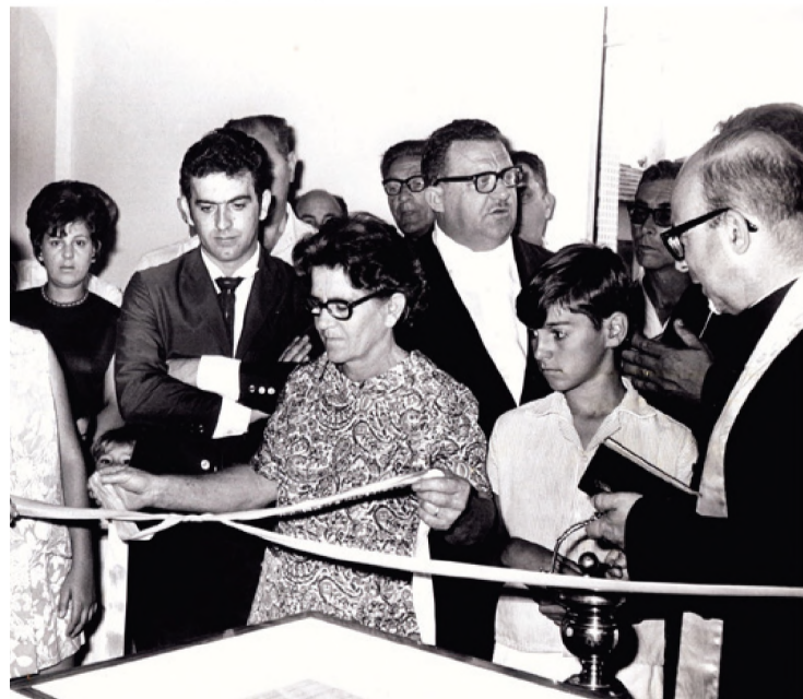
1969 – Inauguração da loja 1