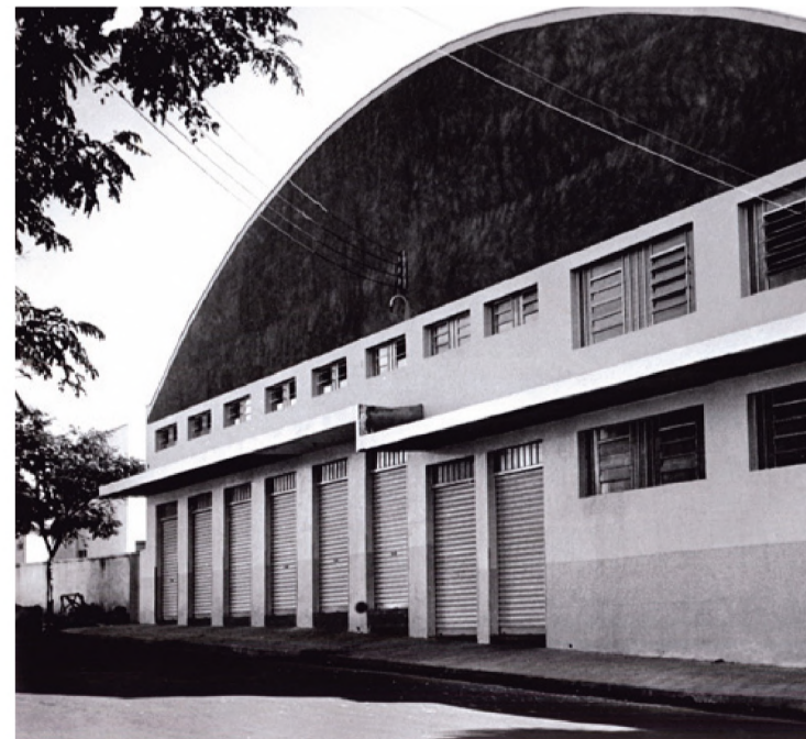
1976 - Loja 2 que fica na Avenida Brasil