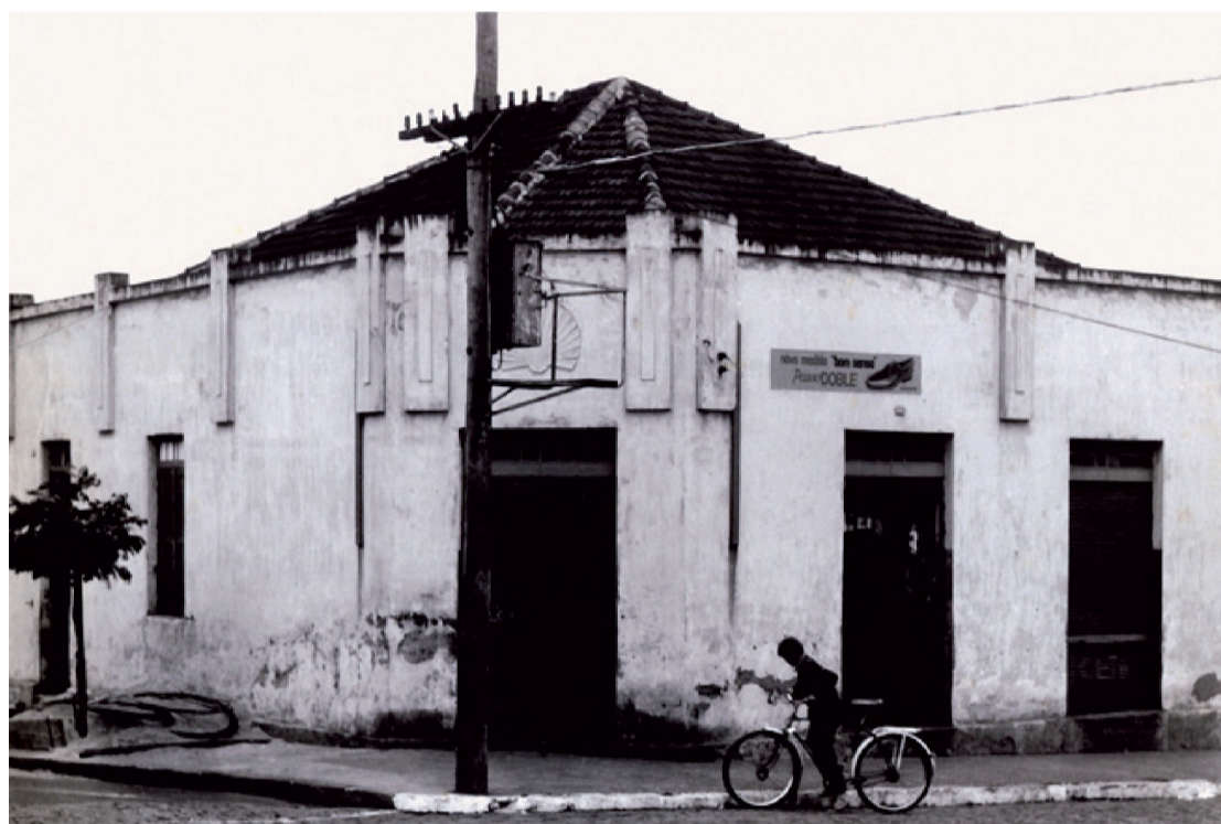
1955 - Loja 1 que fica na Rua 9 de Julho esquina com Anita Garibaldi

Apesar do aumento da infraestrutura, o Santa Catarina precisou crescer ainda mais para atender clientes de outros bairros. Em 1974, seo Armando construiu a loja 2, localizada na avenida Brasil, nº 650. A unidade possui o dobro do tamanho da primeira, com 600 metros quadrados. "A inauguração da loja foi um marco para a cidade. O prefeito Rubens Pietraróia até pediu para que nós remarcássemos a data, que seria no dia 7 de setembro. Nós viramos até matéria de jornal", lembra o proprietário.