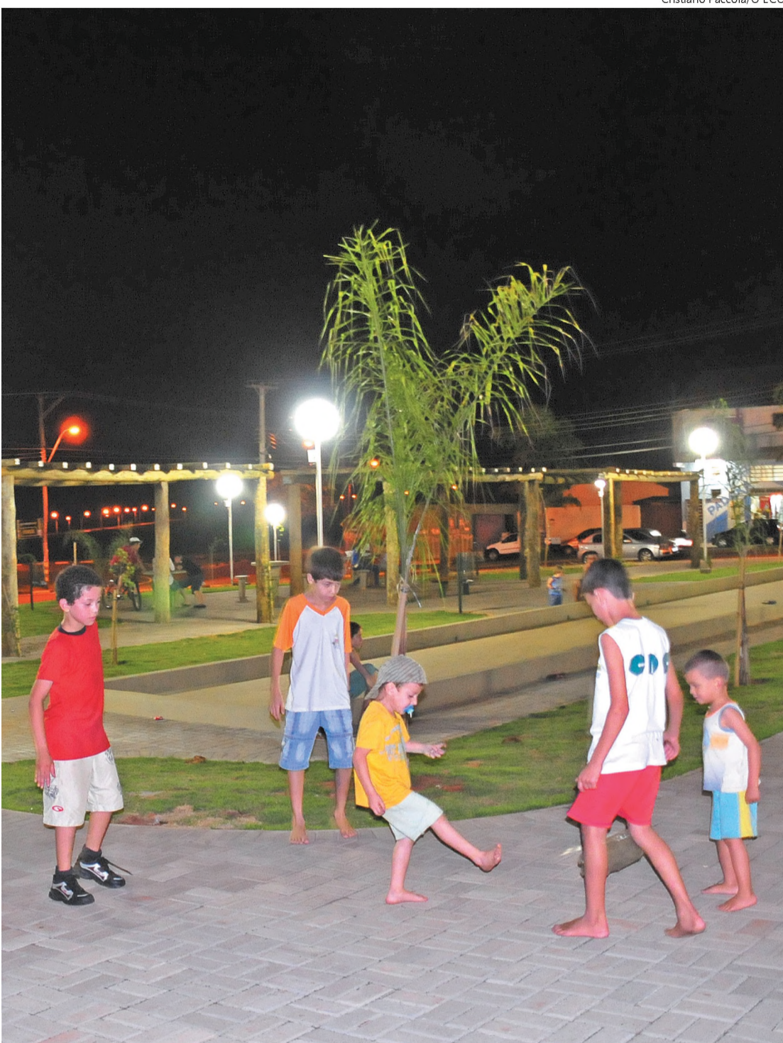
Cristiano Paccola/O ECO