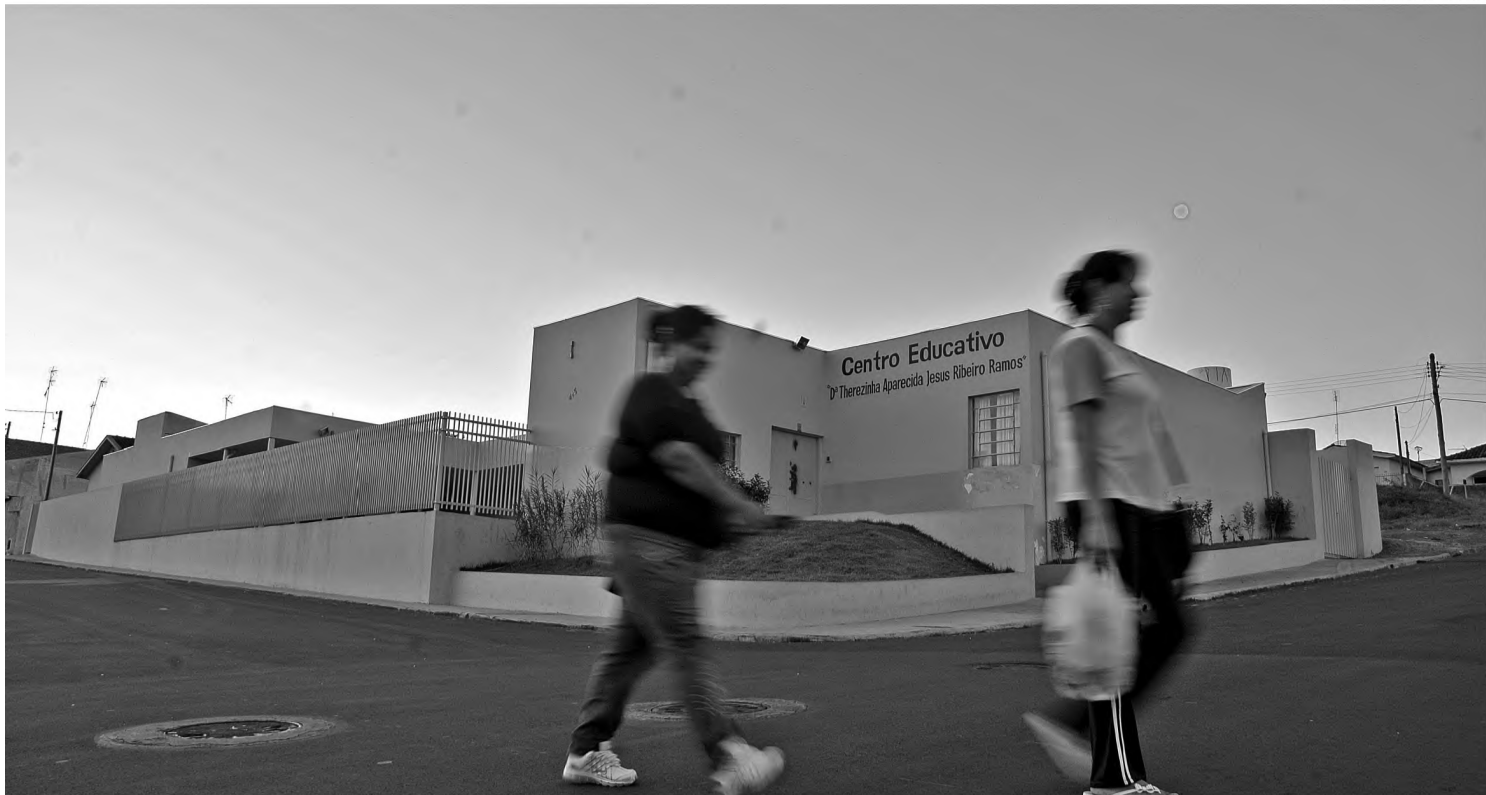
Com orçamento 32% maior, investimento da Assistência Social, como reforma de centros educativos, também devem crescer em 2011

Outra mudança no texto da lei é a redução de 25% para 10% do orçamento total no limite possível de dotações das diretorias. Essa dotação significa o remanejamento de recursos de cada diretoria, de acordo com a disponibilidade do orçamento e suas necessidades.