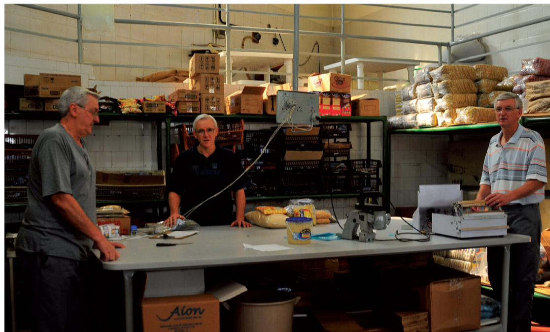
Negócio começou com pai e tio dos atuais proprietários, ainda na década de 1951: pioneirismo