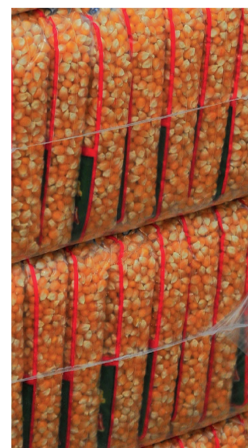
A farinha de milho é produzida na sede da empresa, na região central de Lençóis Paulista

Cerealista oferece toda a linha de farinhas, laticínios, amendoim, castanhas, arroz, feijão e rações para animais: atendimento em Lençóis e 15 cidades da região