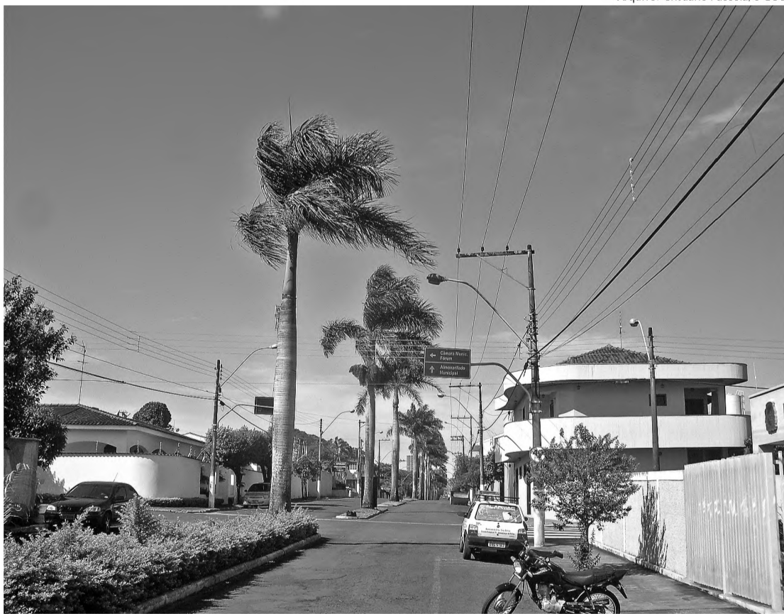
Área de destaque no orçamento, secretaria de Obras e Vias Públicas tem R$ 2,6 milhões para 2011