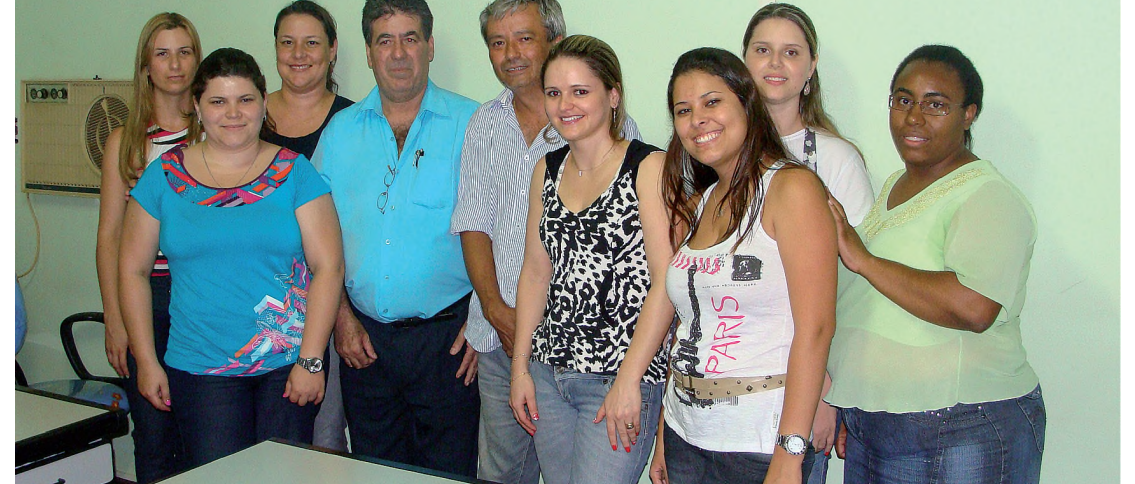
Equipe do sindicato que atende motoristas de Lençóis Paulista e região