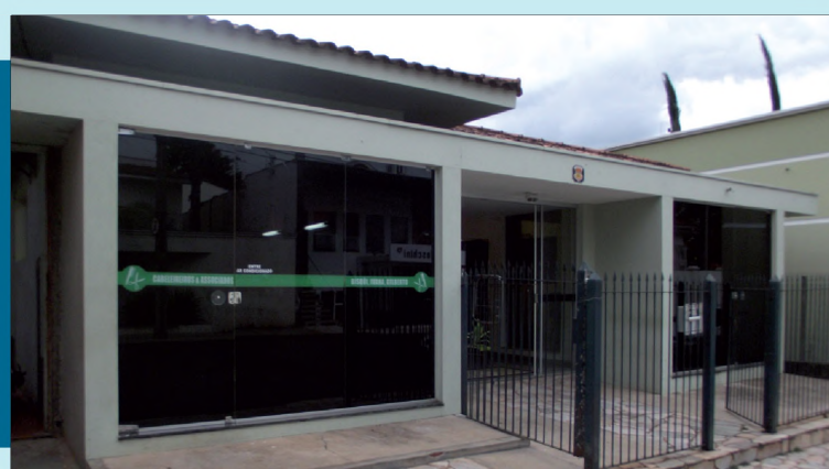
Sede em Lençóis Paulista: no aguardo da mudança para prédio próprio