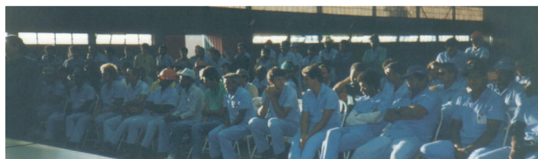
Acordo com funcionários de usina: Sincovelpa na luta pelo direito dos trabalhadores