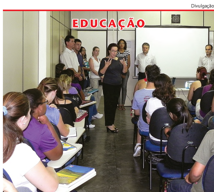
Aula inaugural da Etec deu início ao ano letivo dos cursos técnicos