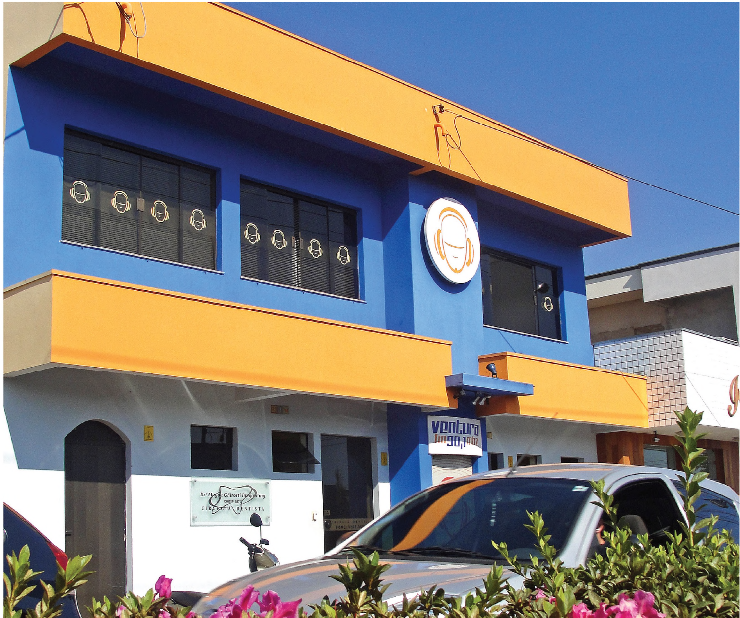
Ventura foi ao ar no final de 2003 depois de cerca de 20 anos de trâmites burocráticos junto ao Ministério das Comunicações

fossem respeitados. Antes, não eram bem vistos, eram um reflexo dessa situação", revela.