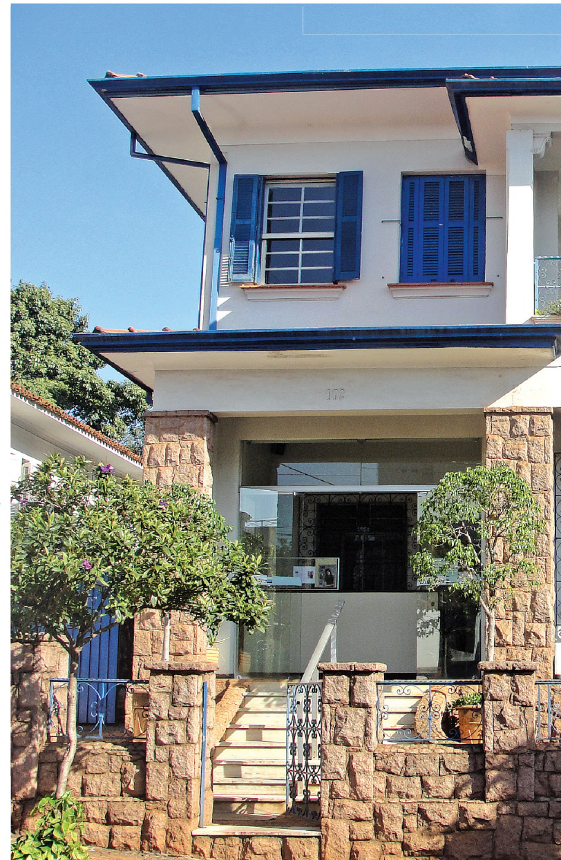
Fundada no início da década de 1950, Sociedade Rádio Difusora cresceu