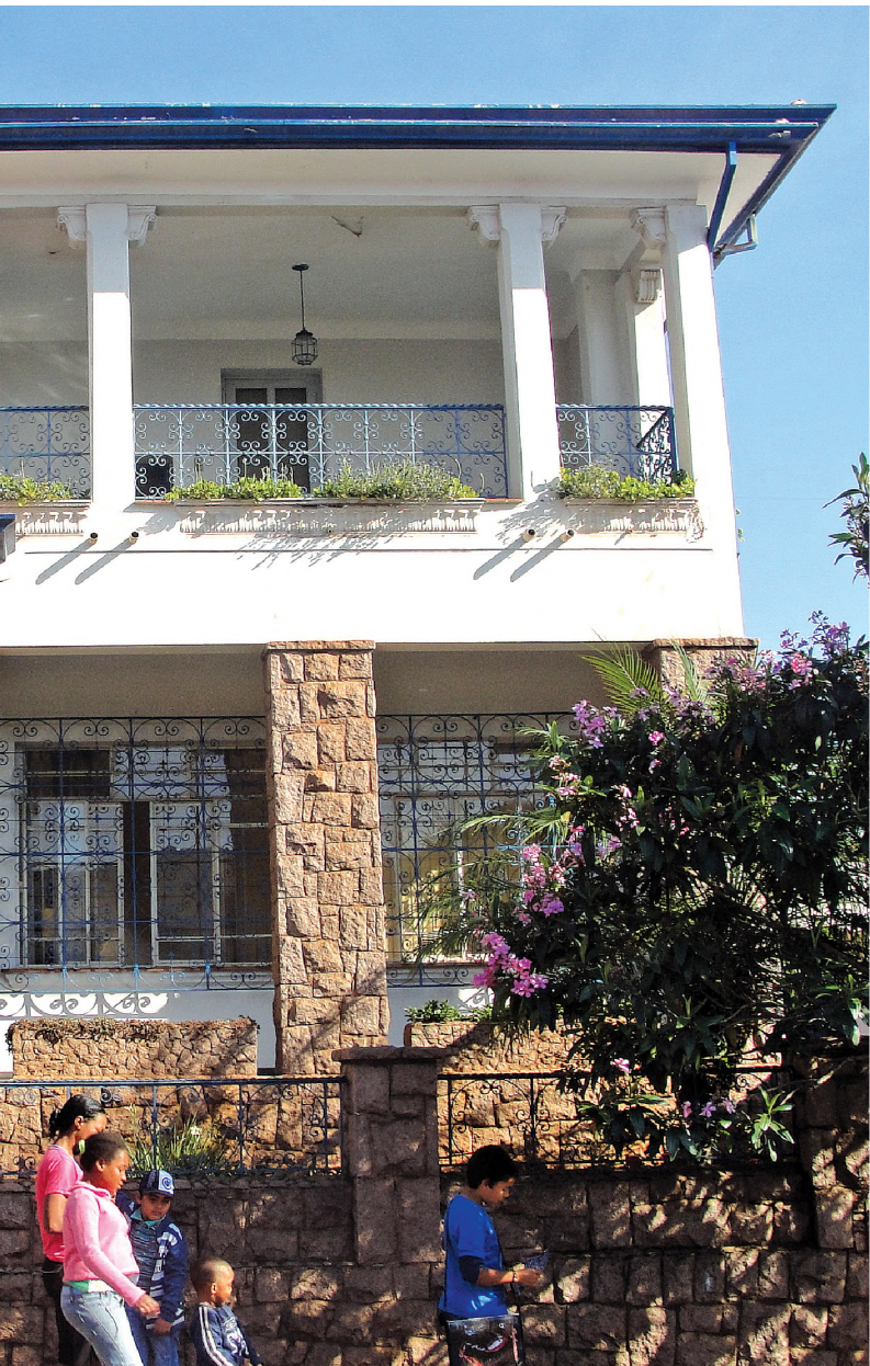
em estrutura e se modernizou ao longo das décadas