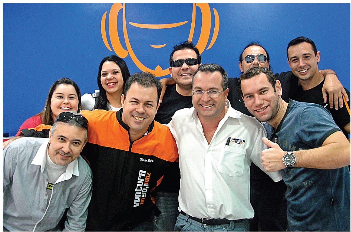
Equipe reunida da Ventura FM

Com uma área de influência de 50 quilômetros de raio, a Ventura foi ao ar em novembro de 2003, com a proposta de uma programação mais refinada que a da Difusora. "Tínhamos uma ideia, que se mostrou errada, de que a Ventura não deveria concorrer com a Difusora. Não se tocava sertanejo, pagode... mas não podíamos ir contra a corrente. O ouvinte gostava da FM, mas pedia músicas diferentes", diz. O processo de definição da grade artística foi parecido com o da AM. "Fomos adaptando a programação ao que o povo queria ouvir. Por isso, o lema é 'mais perto de você'. Hoje, praticamente todos os programas tem o disk Ventura, para o ouvinte pedir música por telefone, SMS, e-mail ou pelo site", completa.