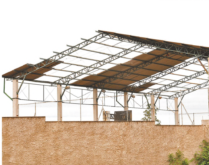
Cristiano Paccola/O ECO