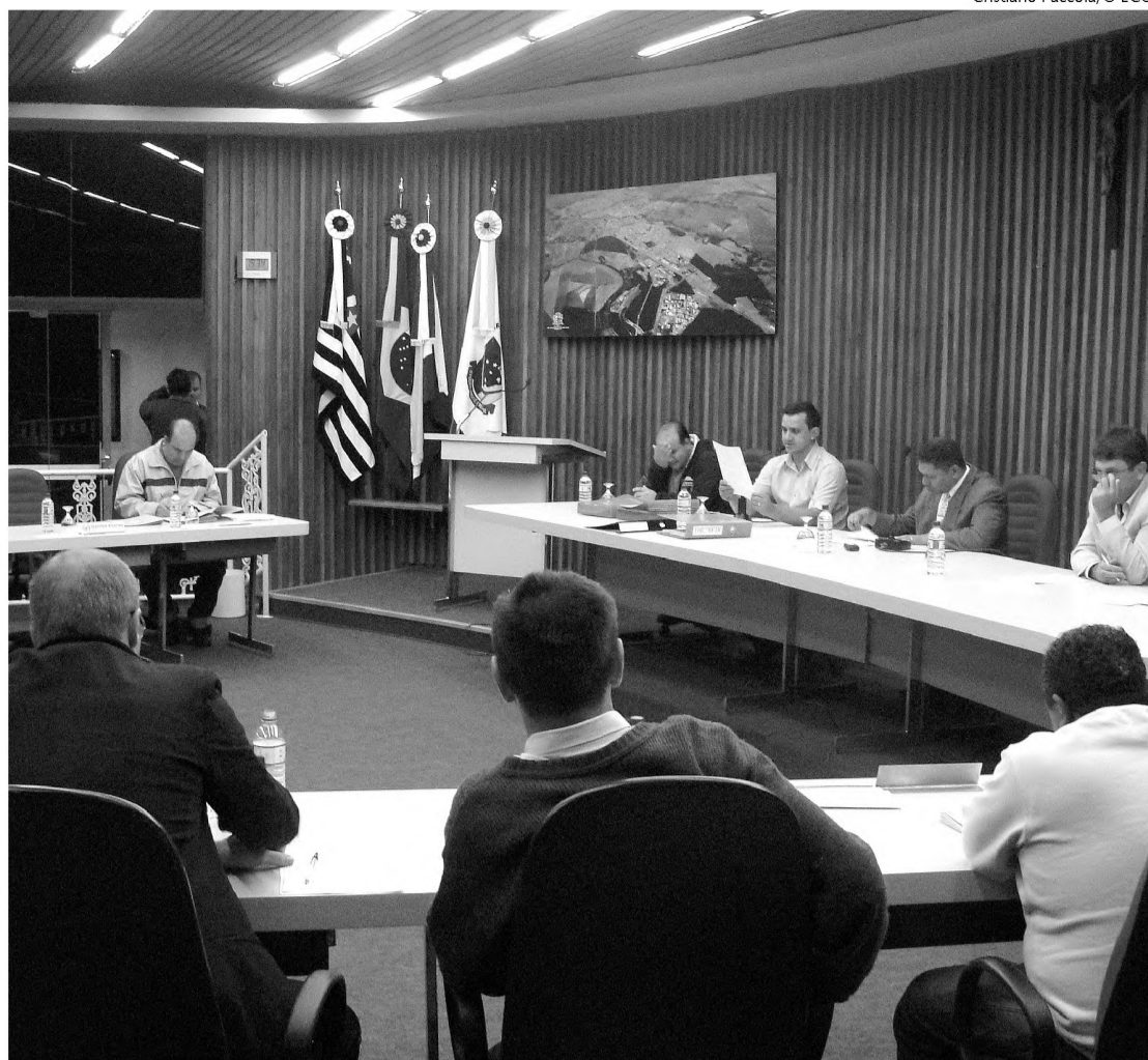
Vereadores terão que devolver R$ 23 mil recebidos indevidamente durante o ano de 2009; Prefeitura realizará o parcelamento da dívida

O projeto votado em 2010, por exemplo, se refere ao exer-