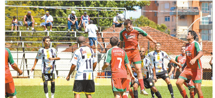
► Página A7