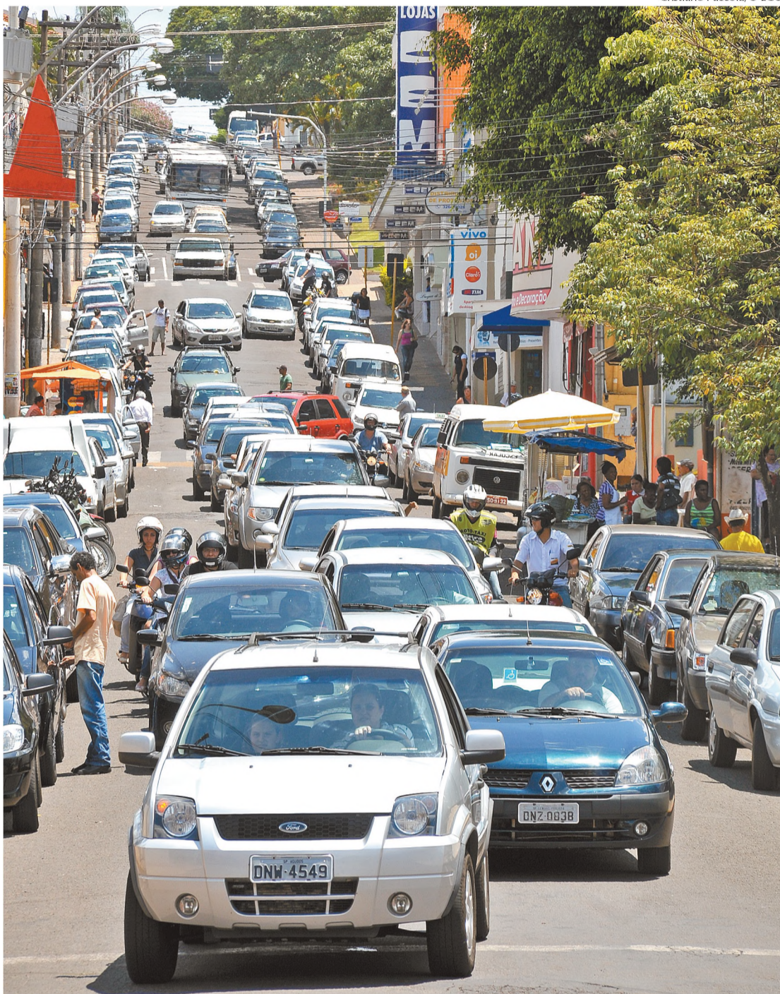
Cristiano Paccola/O ECO