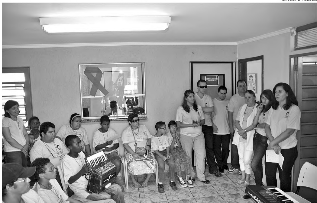
Alunos do Vida Iluminada tocam instrumentos na inauguração do novo espaço

A manhã da segunda-feira 28 foi especial para médicos, funcionários e crianças deficientes visuais e familiares. Eles acompanharam a entrega de um espaço dedicado à medicina preventiva e projetos sociais da Unimed. A nova casa será um grande reforço na estrutura do projeto Vida Iluminada, coordenado pela AMU (Associação da Mulher Unimed).