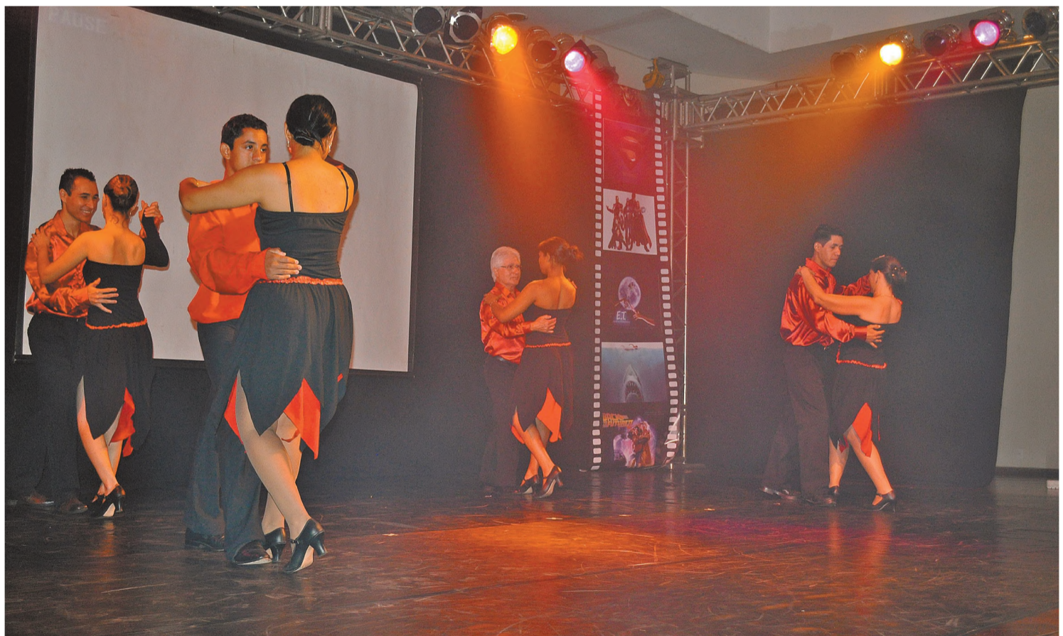
DANÇA NAS TELONAS Na sexta-feira 26 e no sábado 27, aconteceu a tradicional mostra de dança de alunos da Academia Marimbondo. Dezenas de alunos – de todas as idades – apresentaram coreografias embaladas por trilhas sonoras de sucessos recentes do cinema, como Shrek, Crepúsculo e O Fantasma da Ópera.

No domingo 4 acontece também a tradicional confraternização de encerramento do ano de campeonatos de futebol no Marimbondo, um evento grande que em 2010 reuniu cerca de 700 pessoas. Com música ao vivo, o evento é destinado a jogadores que disputaram torneios no clube na temporada 2011.