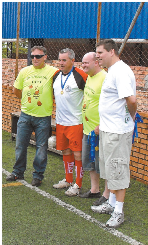
Diretoria do Marimbondo entrega medalhas aos jogadores campeões

decisivo, no último final de semana. Na manhã de domingo 4, as duas equipes voltaram a campo para decidir o título. Em uma partida bastante disputada, Flamengo e Palmeiras ficaram no empate em 2x2. O resultado consagrou o Flamengo.