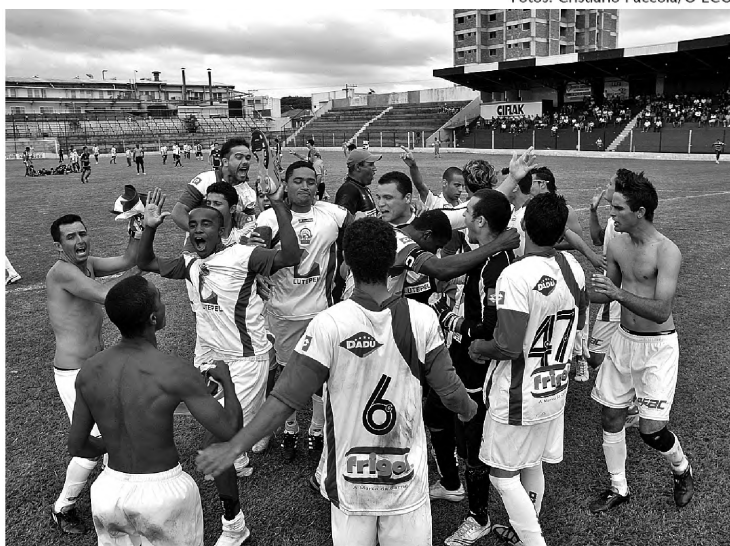
Grêmio Cecap comemora vaga para a final do Amador 2011