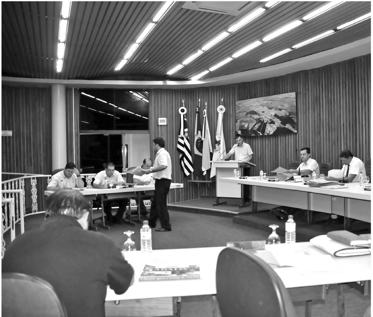
No pacote e sem discussão, Câmara altera horário para fugir dos populares, limpa a pauta e recria o recesso de julho

Entre os projetos aprovados sem discussão estão documentos importantes para a cidade. Entre eles, o que define o orçamento do município para o exercício 2012 e o projeto Conecta Cidadão, que disponibiliza acesso gratuito à conexão de internet via rádio. A Câmara também alterou seu regimento interno, aprovando a volta do recesso parlamentar no meio do ano (em julho), que havia sido banido do plenário no exercício de 2011.