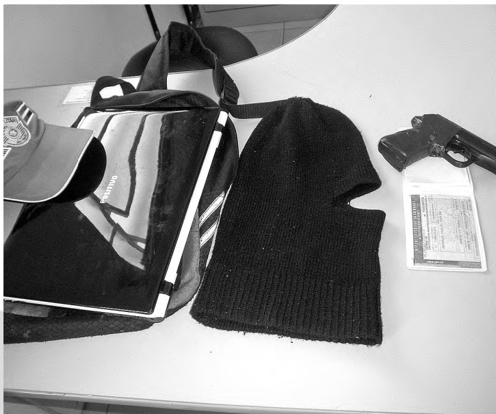
Material apreendido com menor detido pela PM de Agudos no domingo

seguiu prender o adolescente. Ele estava de posse de uma arma de brinquedo e uma touca ninja, ambas usadas nos crimes. Numa mochila que ele estava carregando, os policiais encontraram um notebook, outra touca ninja entre outros objetivos. O menor foi encaminhado para a delegacia, para as devidas providências. (VG)