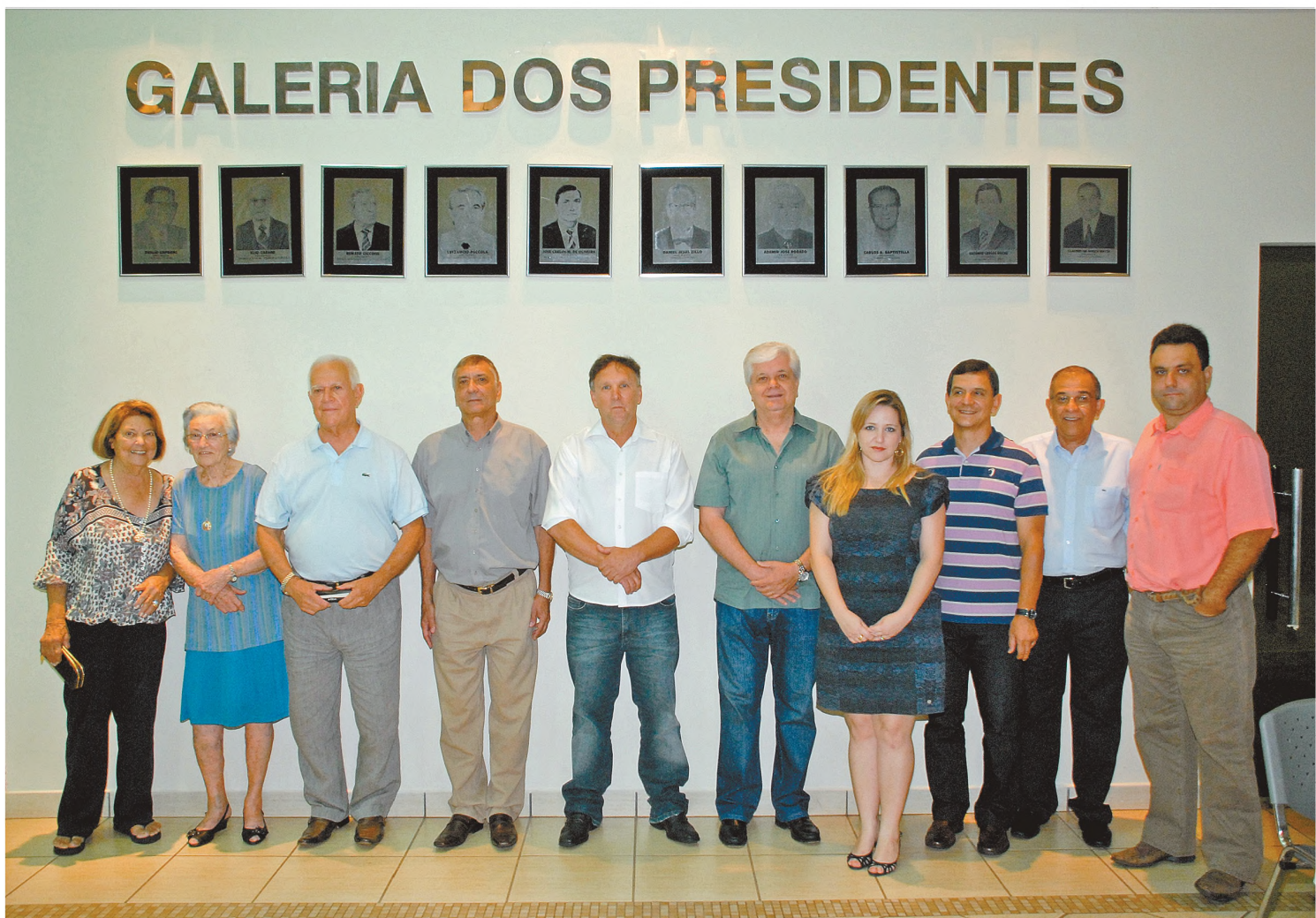
Solenidade homenageou ex-presidentes e familiares de ex-presidentes do Clube Esportivo Marimbondo