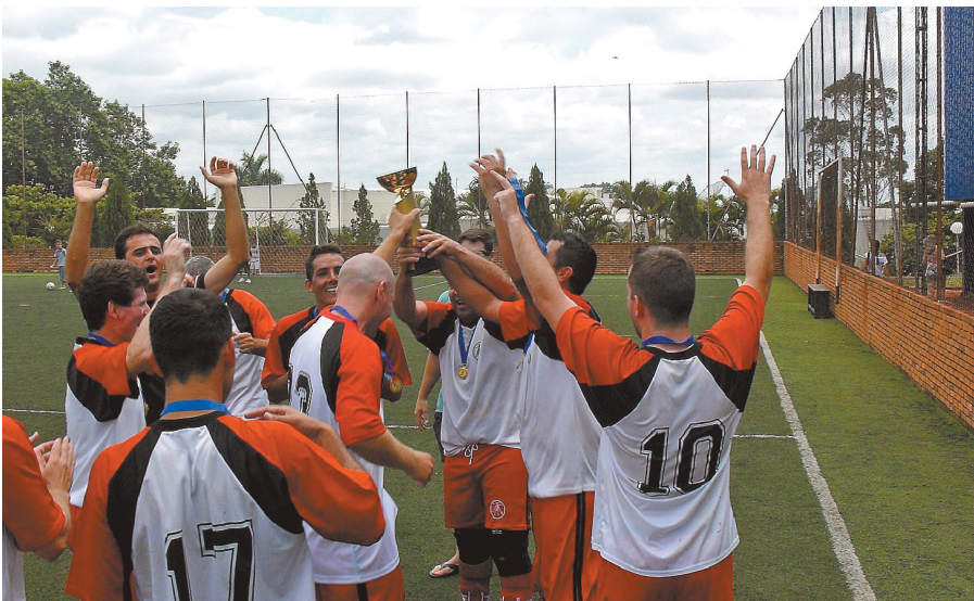
Jogadores do Flamengo comemoram o título do Sênior B

Dois jogos definiram o campeão do Campeonato de Futebol Society do CEM (Clube Esportivo Marimbondo) – categoria Sênior B. No primeiro confronto, na quarta-feira 30, o Flamengo venceu o Palmeiras por 6x4 e ganhou o direito de jogar pelo empate no jogo