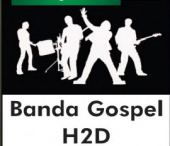
Banda Gospel H2D