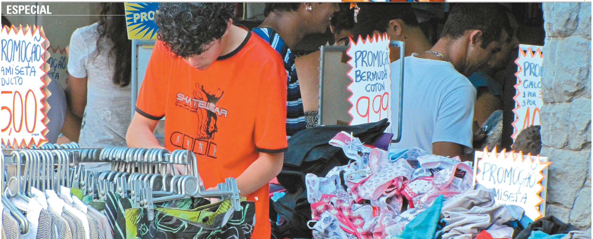
FESTA - Para alavancar vendas do comércio, Prefeitura promove várias ações e shows