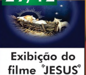
Exibição do filme JESUS