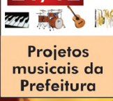
Projetos musicais da Prefeitura