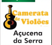
Camerata de Violões Açucena da Serra