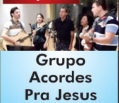
Grupo Acordes Pra Jesus