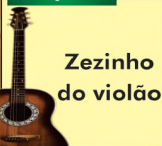
Zezinho do violão