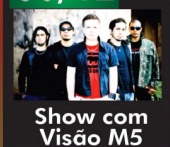
Show com Visão M5