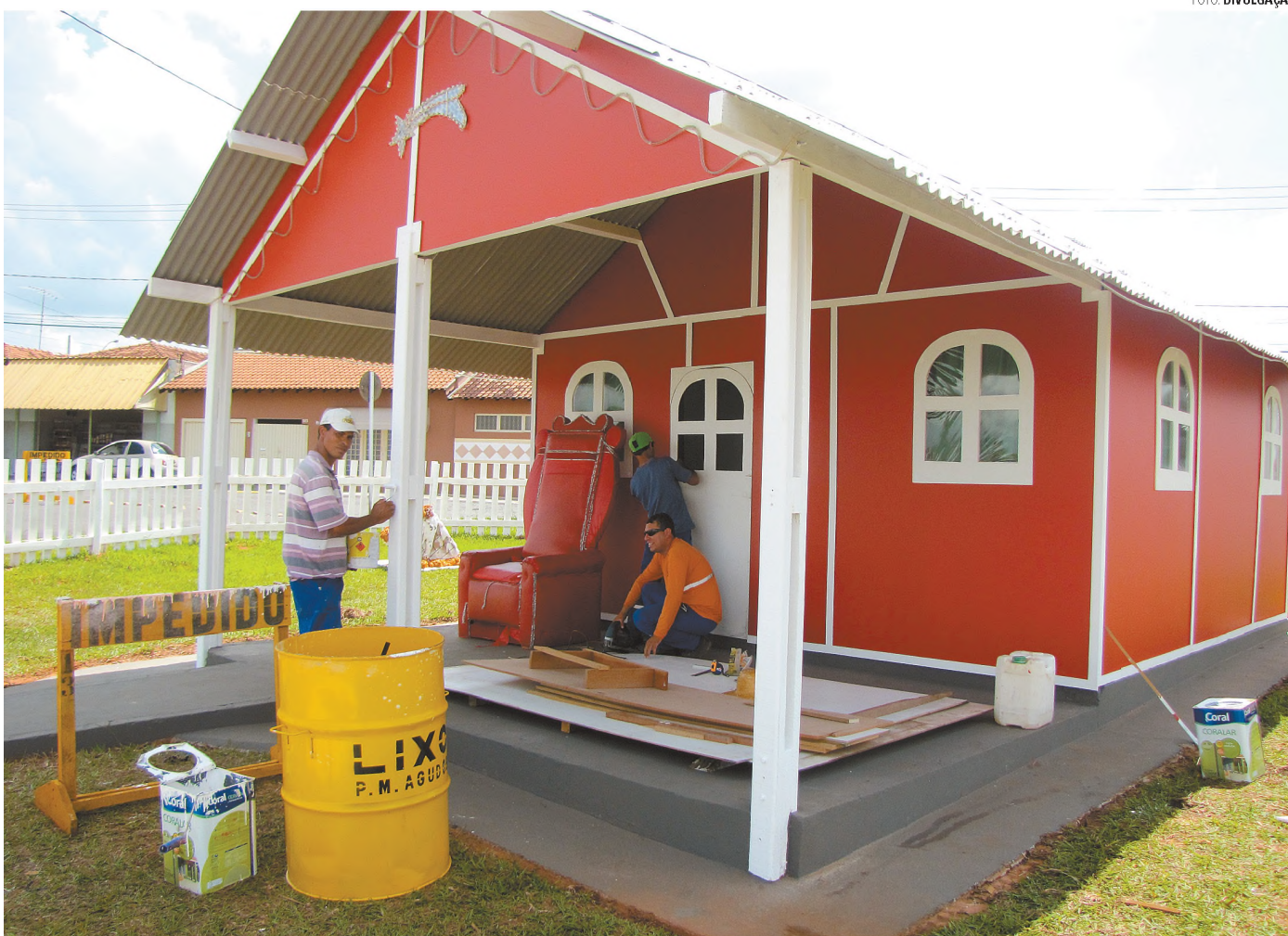
RETA FINAL - Funcionários dão os últimos retoques na Casinha do Papai Noel, na avenida Carvalho Pinto