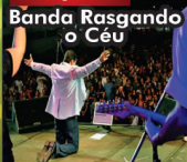
Banda Rasgando o Céu