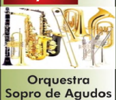
Orquestra Sopro de Agudos