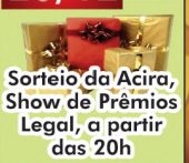
Sorteio da Acira, Show de Prêmios Legal, a partir das 20h