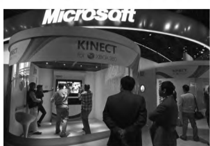
NOVIDADES - Estando do Kinect, da Microsoft, na CES 2011

A tradicional Consumer Electronic Show (CES), maior feira de tecnologia do mundo, começou ontem em Las Vegas, nos Estados Unidos, para a imprensa. Neste ano, os destaques devem ser os chamados ultrabooks, a evolução dos notebooks, que dividirão espaço com TVs inteligentes e com imagem refinada por tecnologias como OLED e a resolução 4K. A previsão é que mais de 20 mil produtos sejam apresentados até a próxima sexta, quando o evento termina. Realizada desde 1967 – a primeira CES foi em Nova York –, a feira apresentou produtos que passaram a fazer parte da vida de muita gente, como o videocassete, em 1970, o CD e a câmera filmadora caseira, em 1981, o famoso game "Tetris", em 1988, e as TVs de alta definição, em 1998. Embora o evento seja fechado para o público em geral, mais de 150 mil pessoas circularam pelos estandes das companhias.