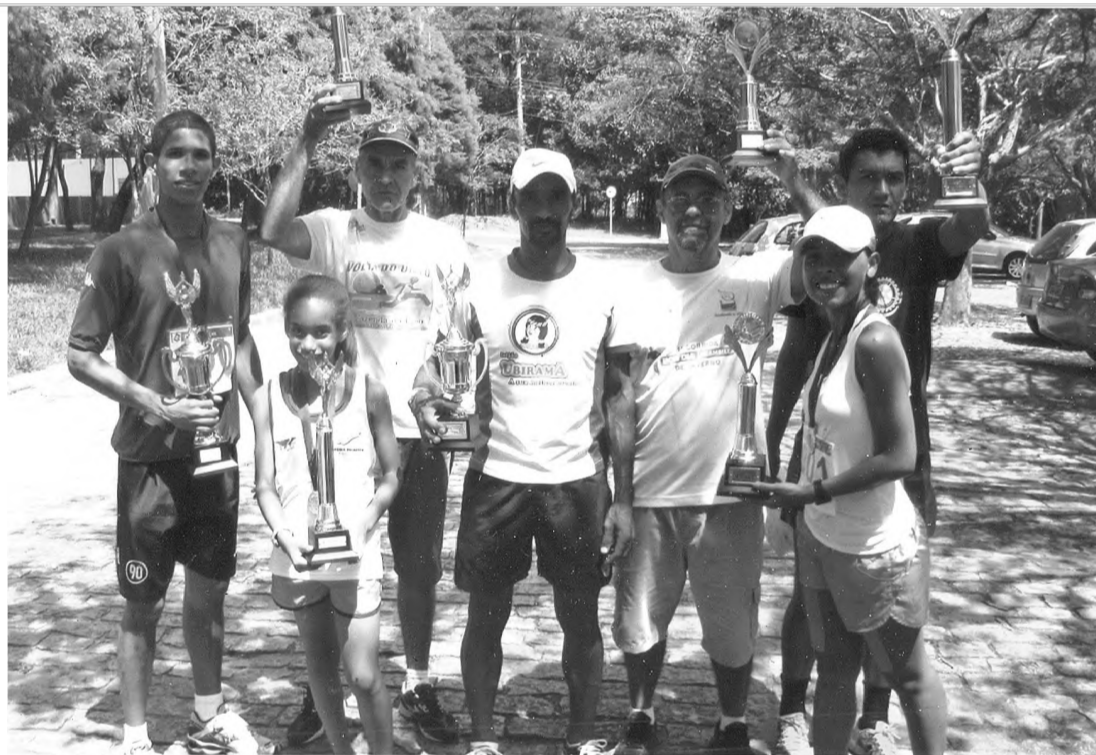
VENCEDORA – A atleta Aline (segunda da direita para esquerda) foi o destaque da prova em Bauru, conquistando o troféu de campeã na categoria infantil

O evento promovido pela Secretaria Municipal de Esportes e Lazer (SEMEL) de Bauru, em parceria com a Associação Bauruense de Atletismo (ABA), reuniu 300 atletas de várias cidades da região.