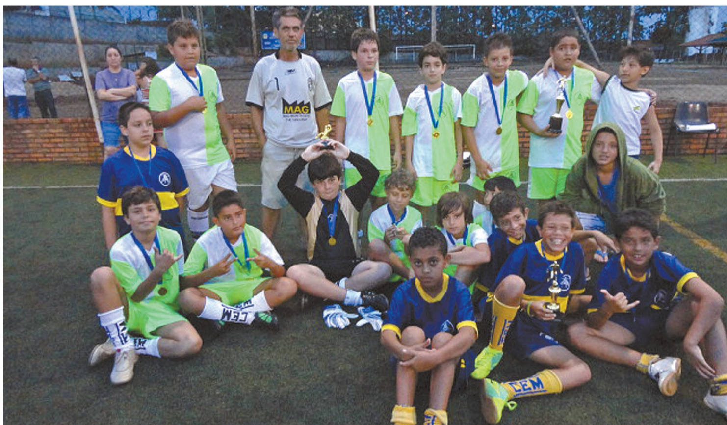
EM CAMPO - Equipes sub 13 e sub 15 vão disputar torneio regional pelo segundo ano consecutivo