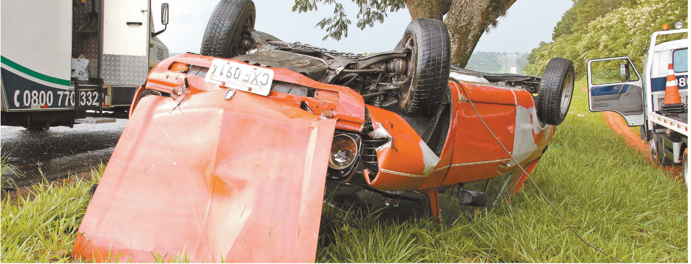
PERIGO NA MARECHAL RONDON - Polícia registra dois capotamentos de veículos na SP 300 no final de semana; uma mulher de 41 anos perdeu a vida