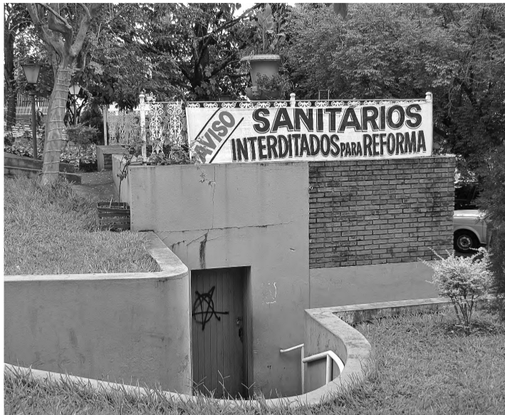
BOM - Governo municipal estima em R$ 50 mil o investimentos na reforma dos banheiros públicos da praça da matriz de São Sebastião