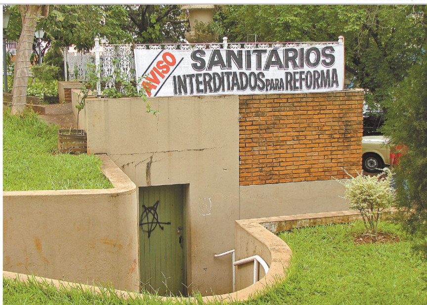
EM REPAROS - Interditados desde de dezembro, banheiros da matriz serão reformados

Os banheiros da praça da Matriz de São Sebastião, em Pederneiras, estão interditados para reforma desde o final de dezembro. As obras de reparação começaram nesta semana. No projeto, estão previstos troca de revestimento, louças sanitárias e portas. Banheiros químicos foram disponibilizados para atender à população, que reclama da demora na condução das obras. A6