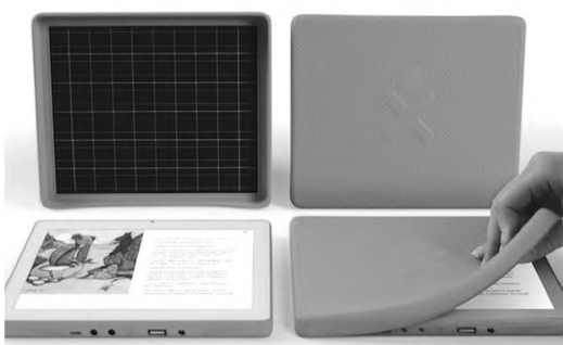
Tablet e célula fotovoltaica que o acompanha

Estranho pensar que, em pleno século XXI, a tração humana ainda pode ser uma opção para alimentar pequenos dispositivos eletrônicos. O novo projeto da OLPC – One Laptop Per Child (Um laptop por criança, tradução livre), apresentado na International Consumer Electronics Show, alia a manivela com o painel solar para fornecer energia a um tablet. O XO 3.0 é uma das novidades apresentadas na feira de tecnologias. O tablet, além de poder ser alimentado através de uma manivela, também possui um painel solar, que permite que seja carregado utilizando apenas energias limpas. Com dez minutos girando a manivela, é possível gerar energia para seis horas de utilização.