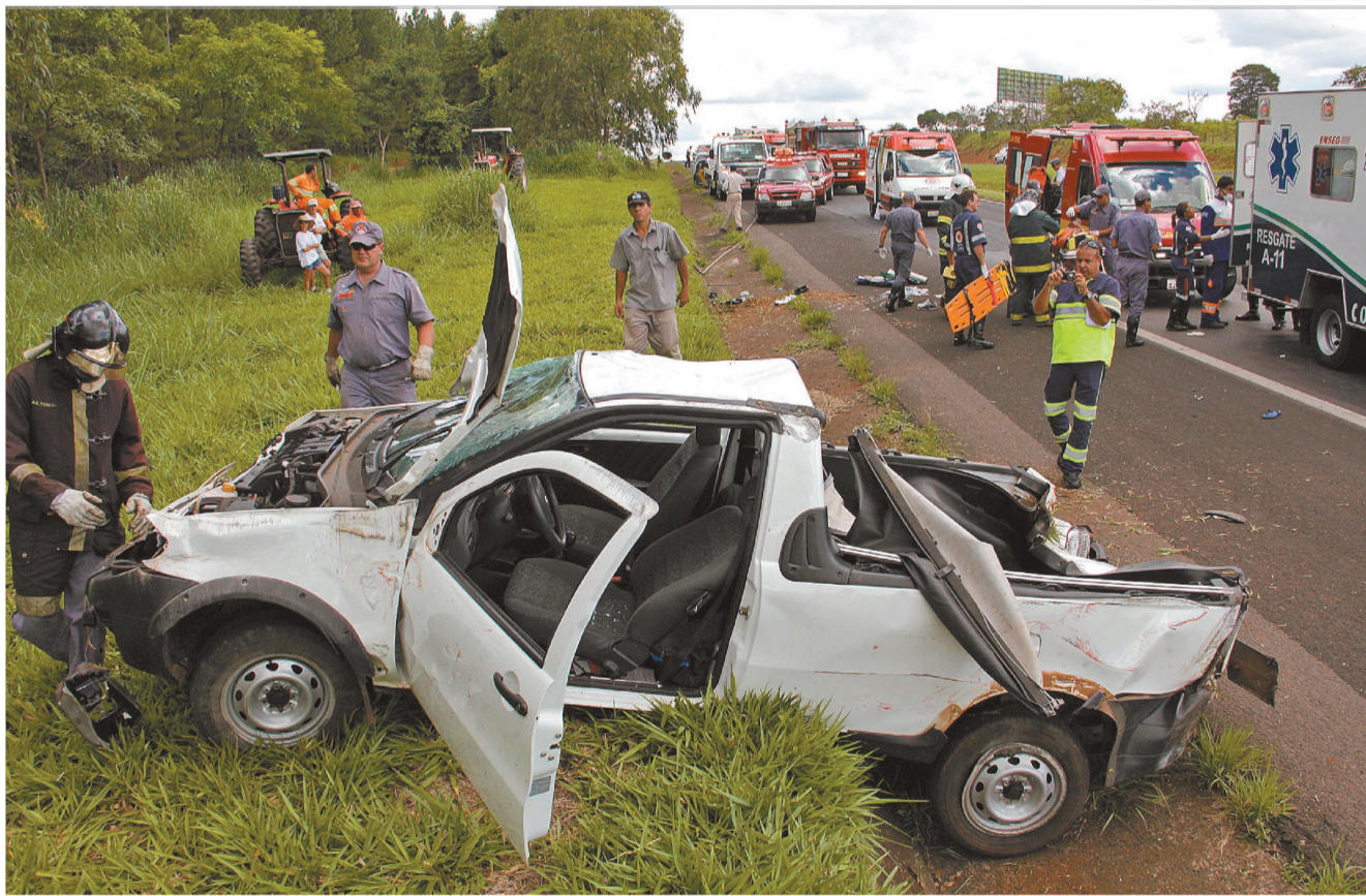
IMPRUDÊNCIA - Capotamento na rodovia Marechal Rondon deixa um morto e cinco feridos; pessoas viajavam na carroceria da picape