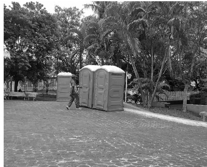
MAS ... - O cheiro dos banheiros químicos e a falta de torneiras incomodam os usuários