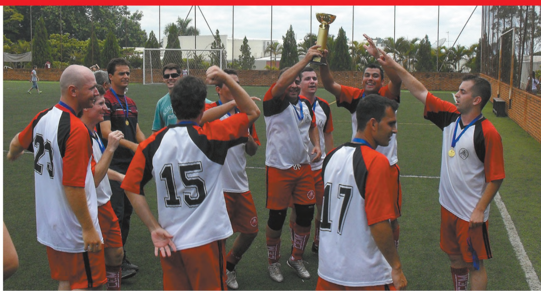
BOLA EM JOGO - Inscrições para temporada 2012 de futebol society terminam no domingo 4

Uma novidade. Neste ano, as inscrições podem ser feitas através do site www.clubemarimbondo.com.br . Basta acessar o site e observar um link no rodapé da página. Clicando neste link, o internauta será levado para o formulário de inscrições. Escolha o campeonato do qual irá participar e preencha os dados.