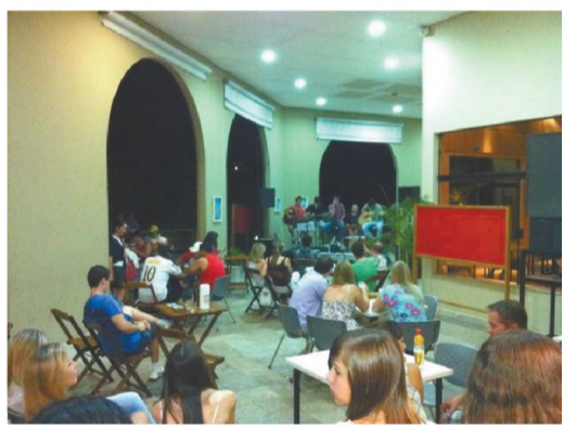
NOVIDADE NO AR - Equipe da lanchonete Clube Time, do Clube Esportivo Marimbondo

Por fim, a lanchonete Clube Time promete uma promoção imperdível para os próximos meses, para comemorar o aniversário de um ano de funcionamento.