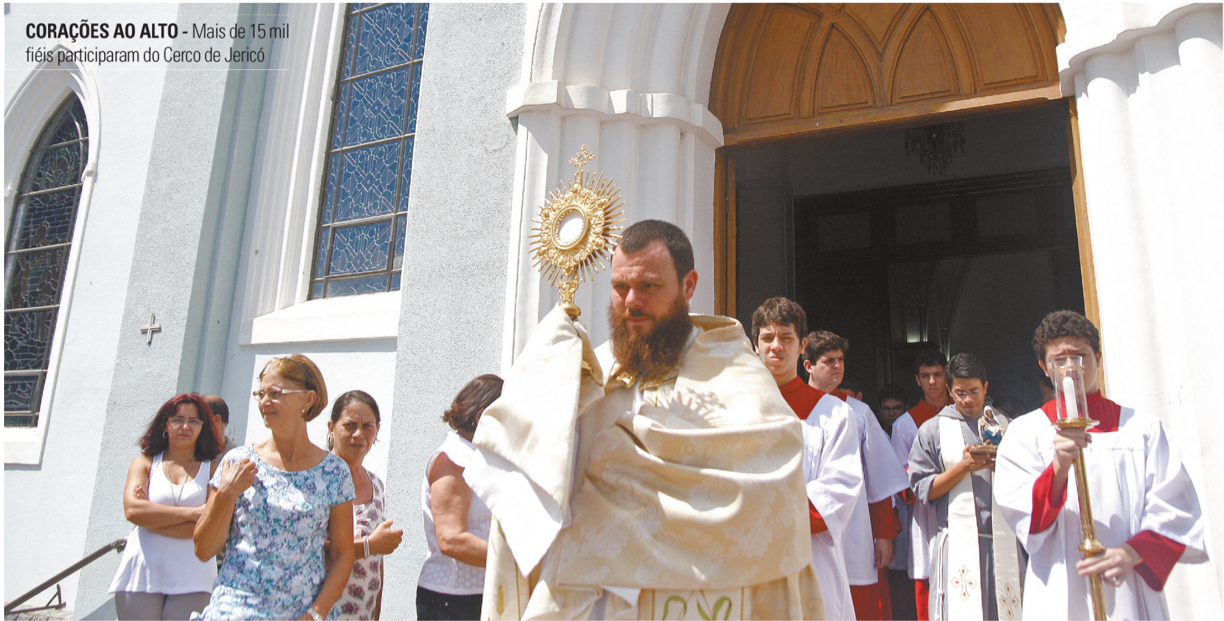
CORAÇÕES AO ALTO - Mais de 15 mil fiéis participaram do Cerco de Jericó

A Polícia Civil de Lençóis Paulista investiga quem conduzia um Gol cinza que provocou um acidente e omitiu socorro, na manhã do domingo, 26 de fevereiro, no cruzamento entre ruas Piedade e Geraldo Pereira de Barros. Após cruzar a preferencial e colidir com uma Honda Biz, ferindo a mulher que a conduzia, o motorista fugiu sem prestar socorro à vítima. Mas, durante a fuga, o condutor perdeu a placa dianteira do veículo. Segundo testemunhas, após atingir a moto, o carro deu marcha a ré e abandonou o local do acidente, deixando a vítima ferida em estado grave. A mulher foi socorrida no pronto-socorro. Acionada a Polícia Militar foi até o local do acidente e encontrou a placa dianteira do carro enroscada na motocicleta. O veículo e o proprietário foram identificados. Com base nessa informação, o condutor deverá ser indiciado por lesão corporal culposa, omissão de socorro e fuga do local do acidente. Os três casos são considerados infrações graves pelo Código de Trânsito Brasileiro. A mulher de 24 anos, sofreu fratura no fêmur, foi submetida a cirurgia e permanece internada.