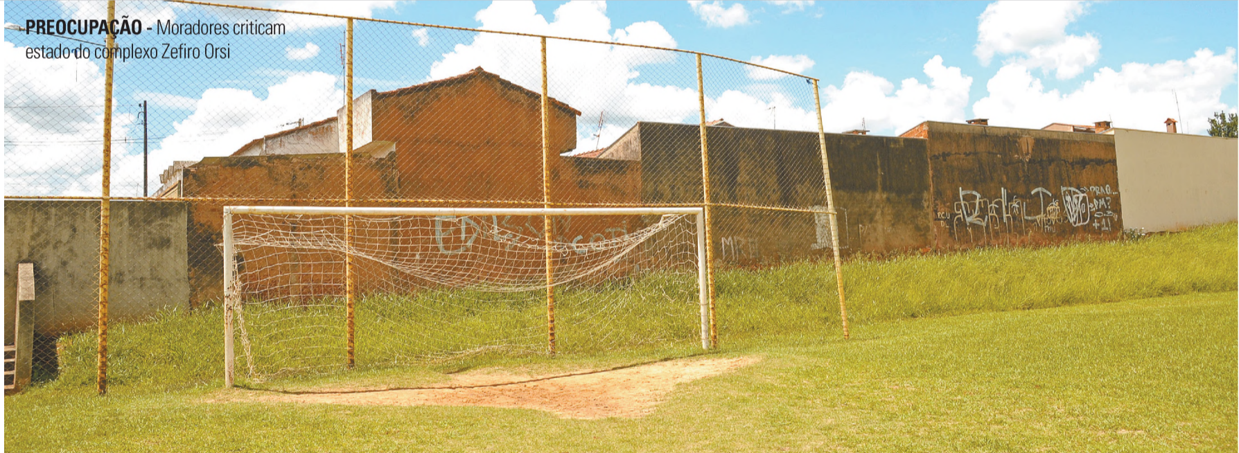
PREOCUPAÇÃO - Moradores criticam estado do complexo Zefiro Orsi