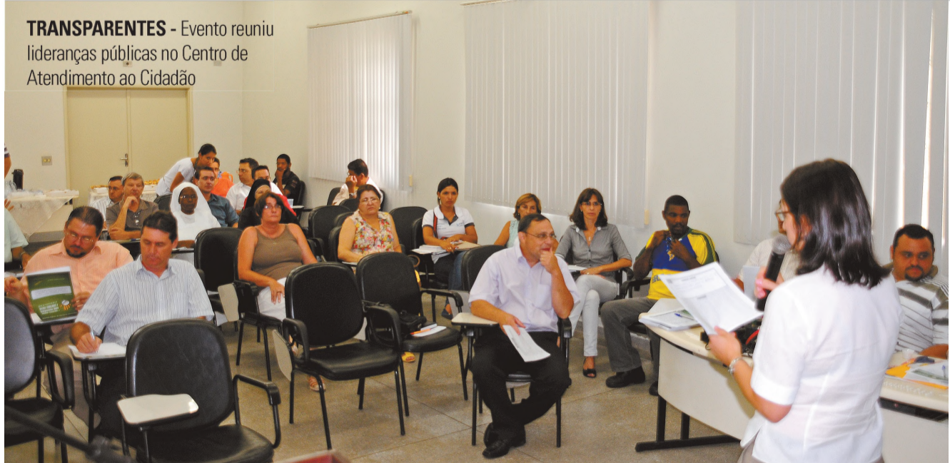
TRANSPARENTES - Evento reuniu lideranças públicas no Centro de Atendimento ao Cidadão