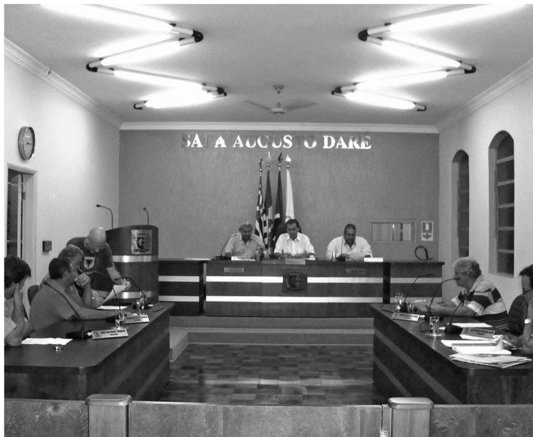
AJUSTE - Por adequação à Lei Federal, Câmara de Macatuba aprova mudanças na Educação