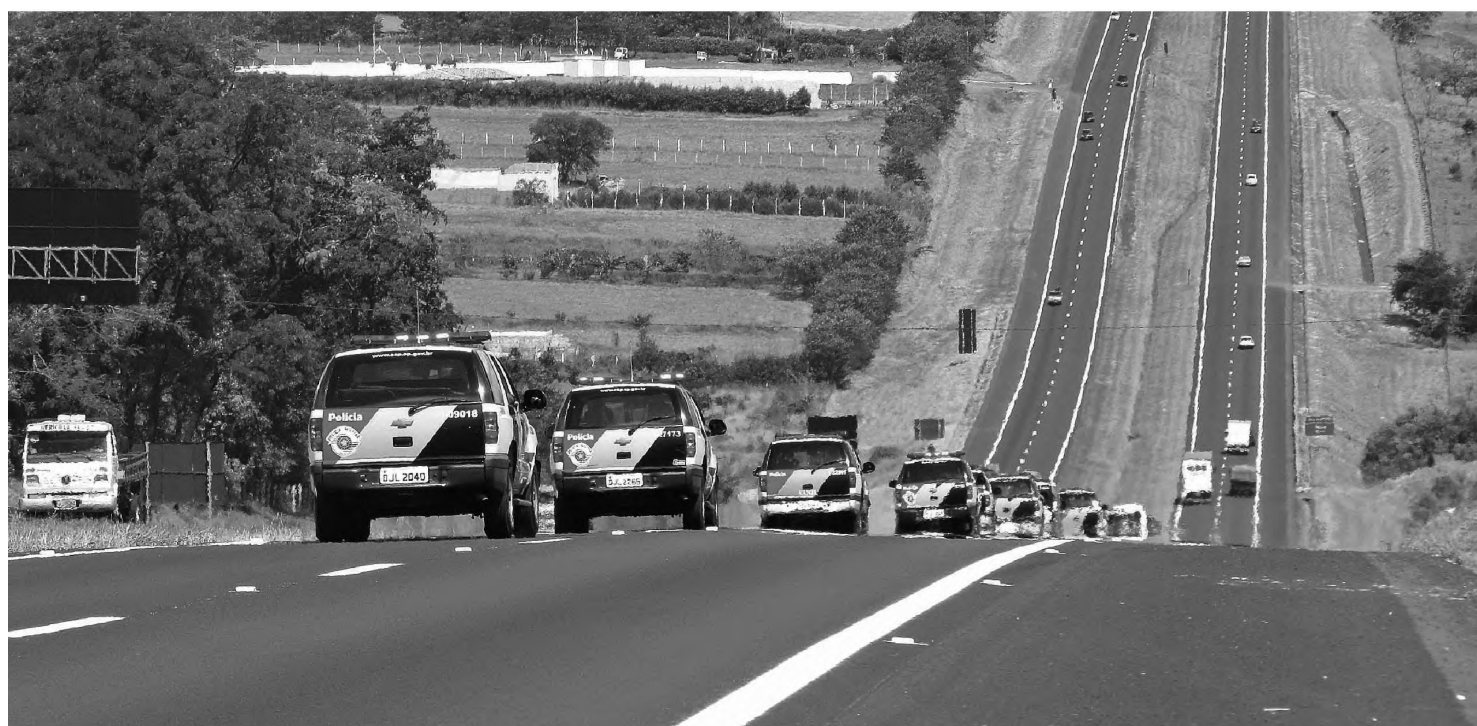
AGENDA - Após patrulhamento em Bauru, policiais seguiram em comboio para Agudos

Cerca de 180 policiais participaram da ação