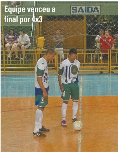
Equipe venceu a final por 4x3