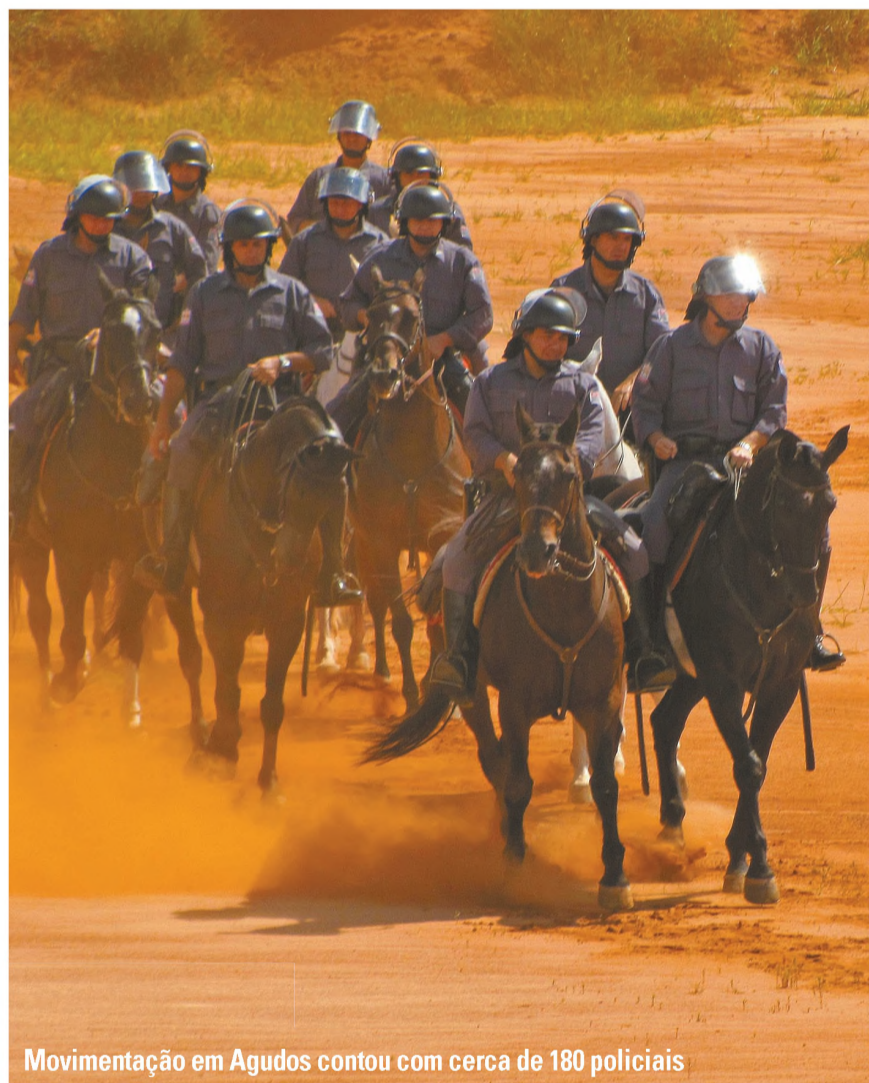
Movimentação em Agudos contou com cerca de 180 policiais