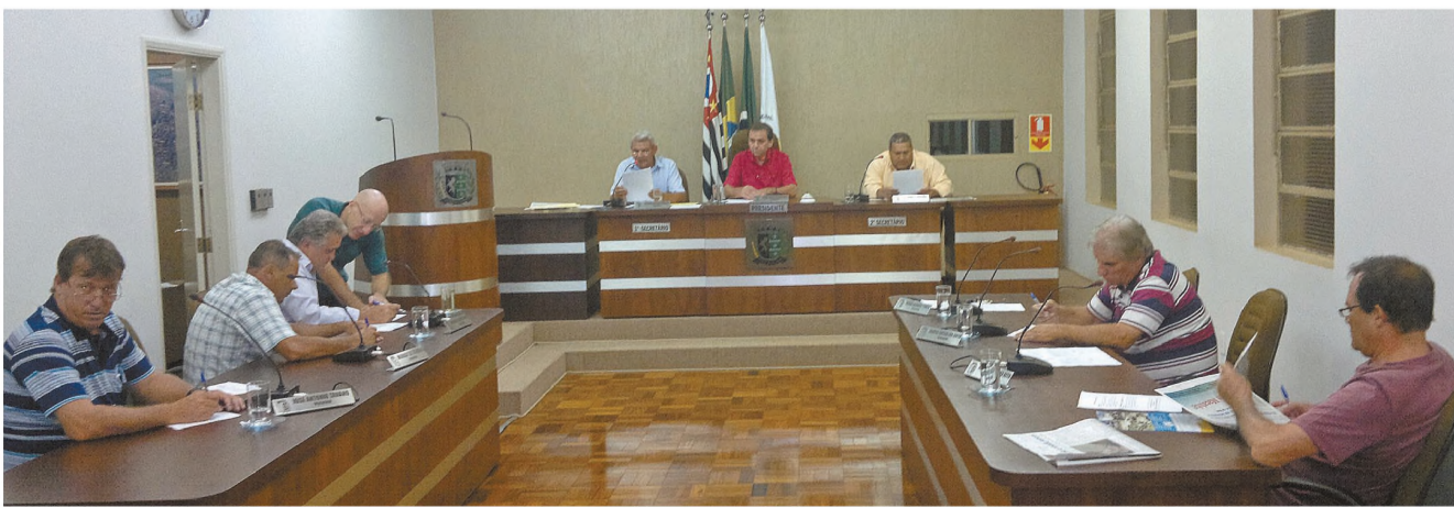
Projetos ligados à Educação foram destaque na sessão da Câmara de Macatuba de segunda-feira 12