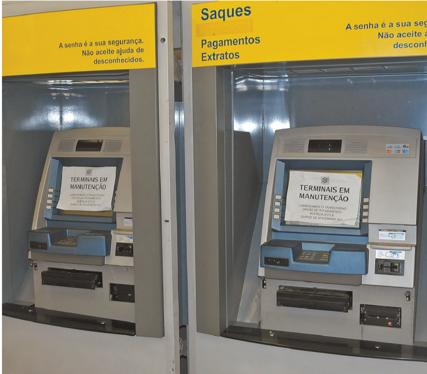
Pelo menos duas máquinas foram danificadas na ação

Indivíduos não identificados tentaram furtar uma agência do Banco do Brasil, antiga Caixa Estadual, no Centro de Lençóis Paulista, na madrugada de sábado. O crime foi descoberto por uma cliente por volta das 7h. De acordo com informações da Polícia Militar, entre às 22h e às 6h a agência deveria ficar fechada, no entanto, os ladrões tiveram acesso à área onde ficam