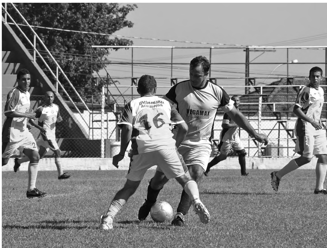
PEDREIRA – Na segunda-fase da Copa, a Prata enfrenta nada menos que a Santa Luzia, campeã do Amador 2011