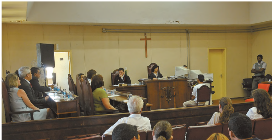
Julgamento aconteceu ontem e teve mais de nove horas de duração