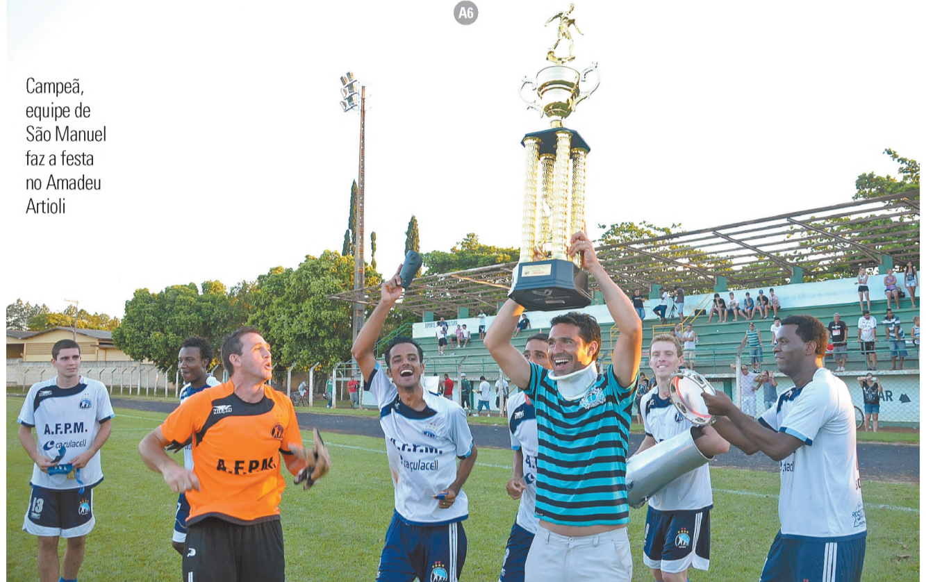
Campeã, equipe de São Manuel faz a festa no Amadeu Artioli