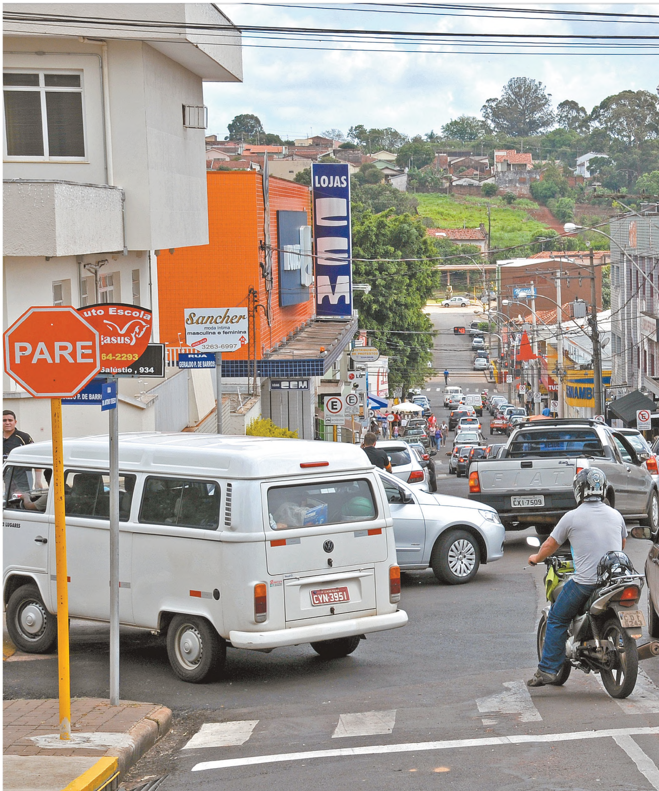
CONFUSO E PERIGOSO Número de acidentes levou a Polícia Militar a intensificar as ações no trânsito