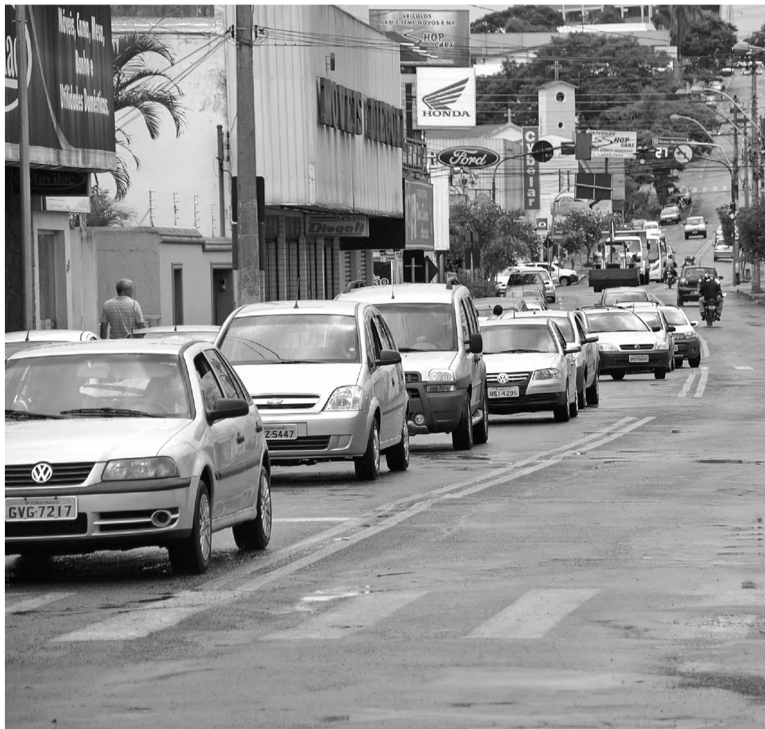
TRÂNSITO - Número de acidentes preocupam Polícia Militar de Lençóis Paulista que vai iniciar uma campanha

O mais grave é que três pessoas perderam a vida em menos de 90 dias, vítimas de acidentes de trânsito. Número equivalente a todo o ano de 2011. No ano passado, o primeiro acidente com vítima fatal foi registrado em agosto, os outros dois aconteceram no mês de novembro. Em 2012, um homem morreu em fevereiro ao colidir frontalmente o carro que dirigia com uma caminhonete, em uma estrada da zona rural. No início deste mês, uma mulher veio a