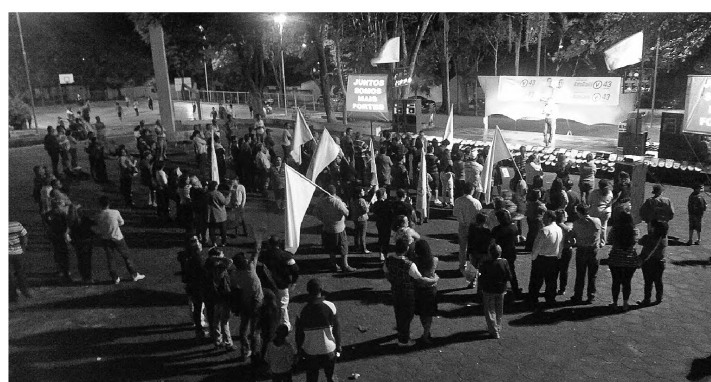
TÁTICA - Coolidge partiu para o ataque a Tarcísio e todo o grupo da oposição, em comício realizado na sexta-feira na praça Juliano Lorenzetti

adianta nós passarmos de casa em casa e eles vêm atrás e faz jogo baixo e sujo?", questionou.