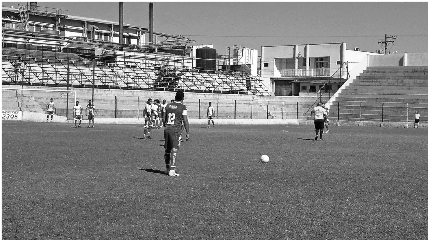
CLASSIFICAÇÃO – Gol de falta no fim do jogo deu a vitória do Ajax/MAC sobre Alfredo Guedes por 1 a 0.