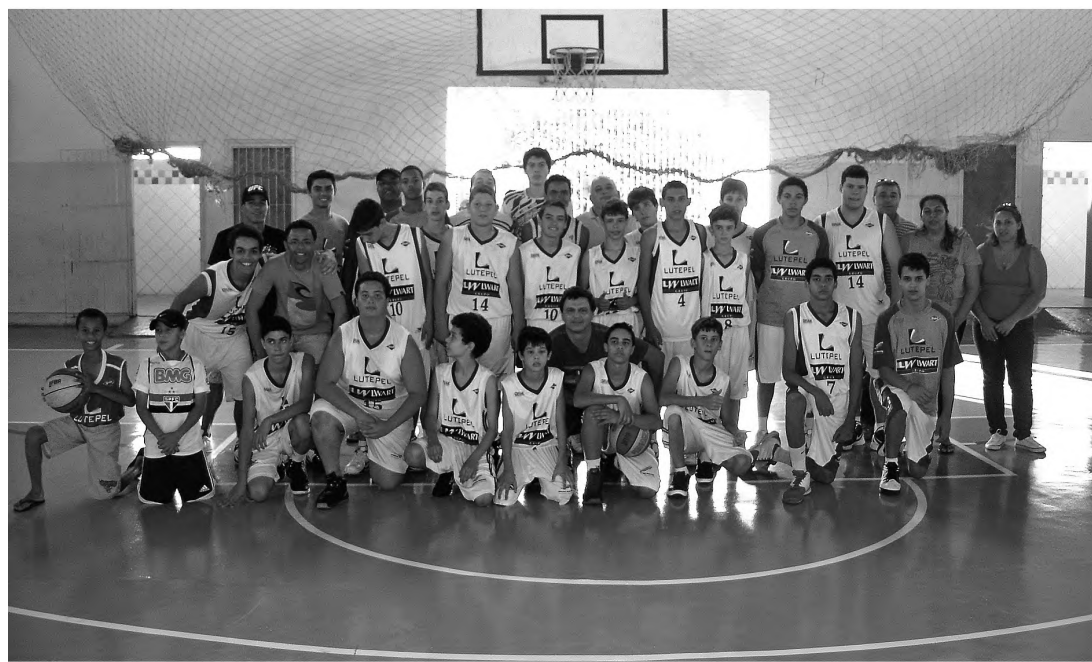
VITÓRIAS – Equipes do sub12, sub-13 e sub-15 do Alba/Lençóis Paulista/Lutepel/Lwart venceram os três confrontos contra Luso de Bauru