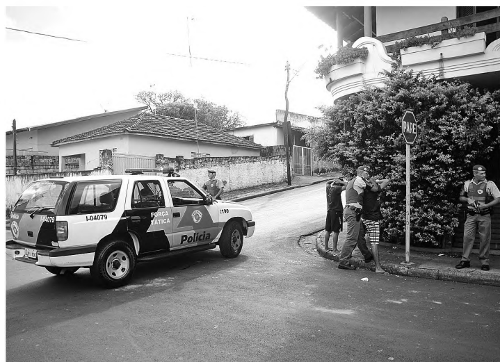
REPRESSÃO - Força Tática de Lençóis Paulista vem intensificando operações policiais na cidade

Em Lençóis Paulista, o número de roubos quase dobrou, saltou de 34 no primeiro semestre do ano passado para 60 em 2012. Já os furtos aumentaram mais ainda. Foram 355 em 2011 e 432 no primeiro semestre de 2012. Outro dado que chama a atenção é o registro de estupro. Em 2011 foram sete ocorrências e