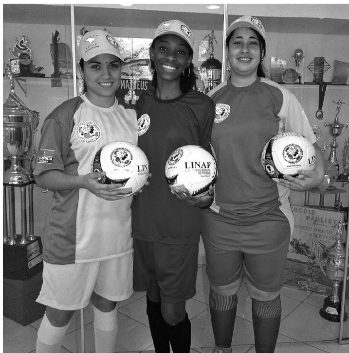
JORNADA – Equipe feminina de Lençóis Paulista vai disputar pelo segundo ano o Campeonato Paulista Feminino 2012 de Futebol