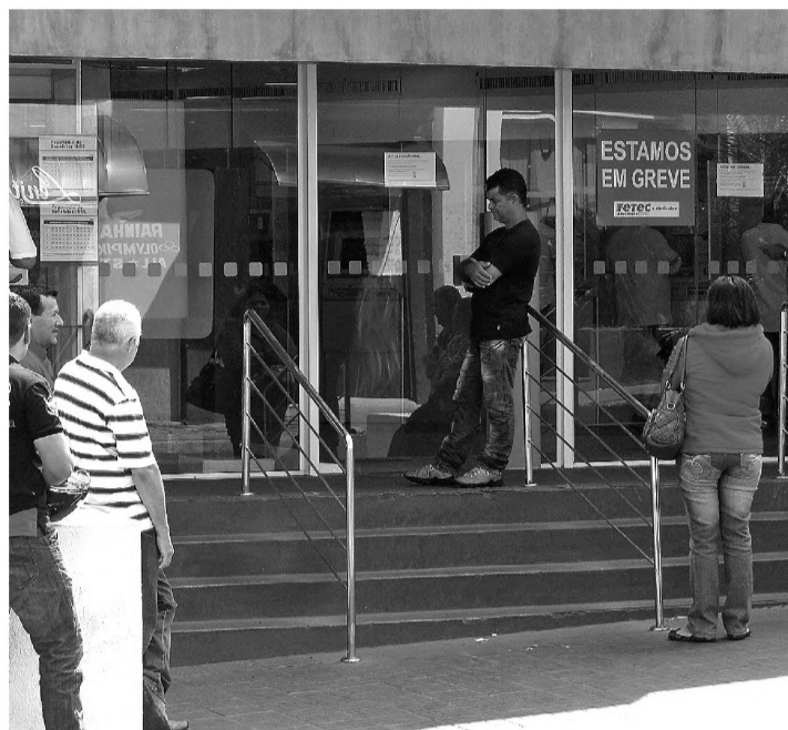
EM GREVE – Consumidores fazem fila para utilizar serviços do atendimento eletrônico

Enquanto a greve continua, os consumidores são orientados a utilizar os caixas eletrônicos e casas lotéricas. “A gente tem o mínimo de entendimento que a população precisa recorrer a