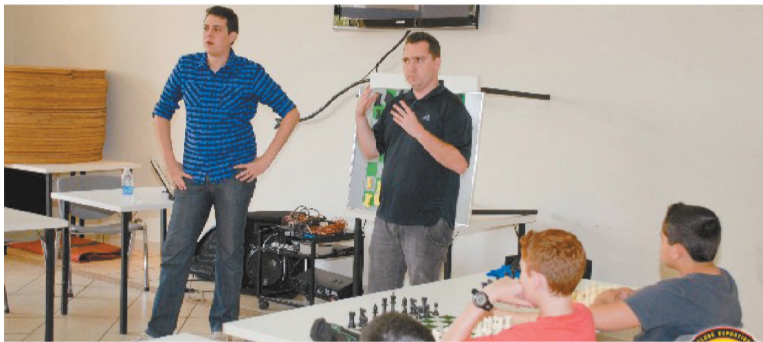
TREINO - Alunos do curso de xadrez treinam com professor internacional