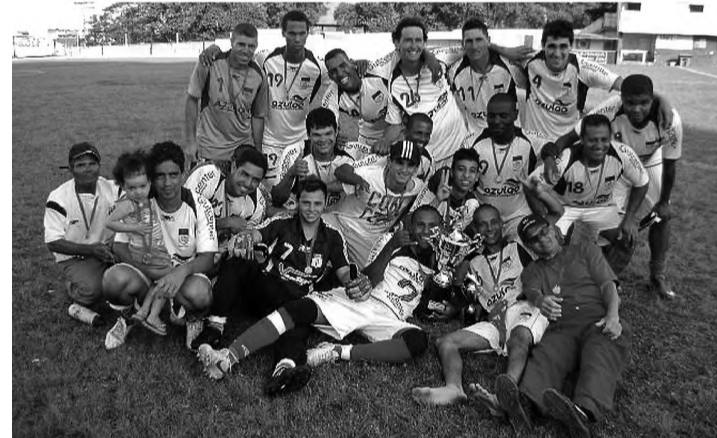
CAMPEÃO – São José venceu o Juventus e conquistou acesso à série A

Com uma campanha quase perfeita, o São José entrou em campo com a vantagem de um empate para garantir o título. O jogo foi truncado, com poucas chances de gols. "Havíamos vencido eles na primeira fase e também no primeiro jogo da decisão, mas sabíamos que ia ser diferente. Durante a semana, conversamos muito. No último jogo, utilizamos a experiência com muita