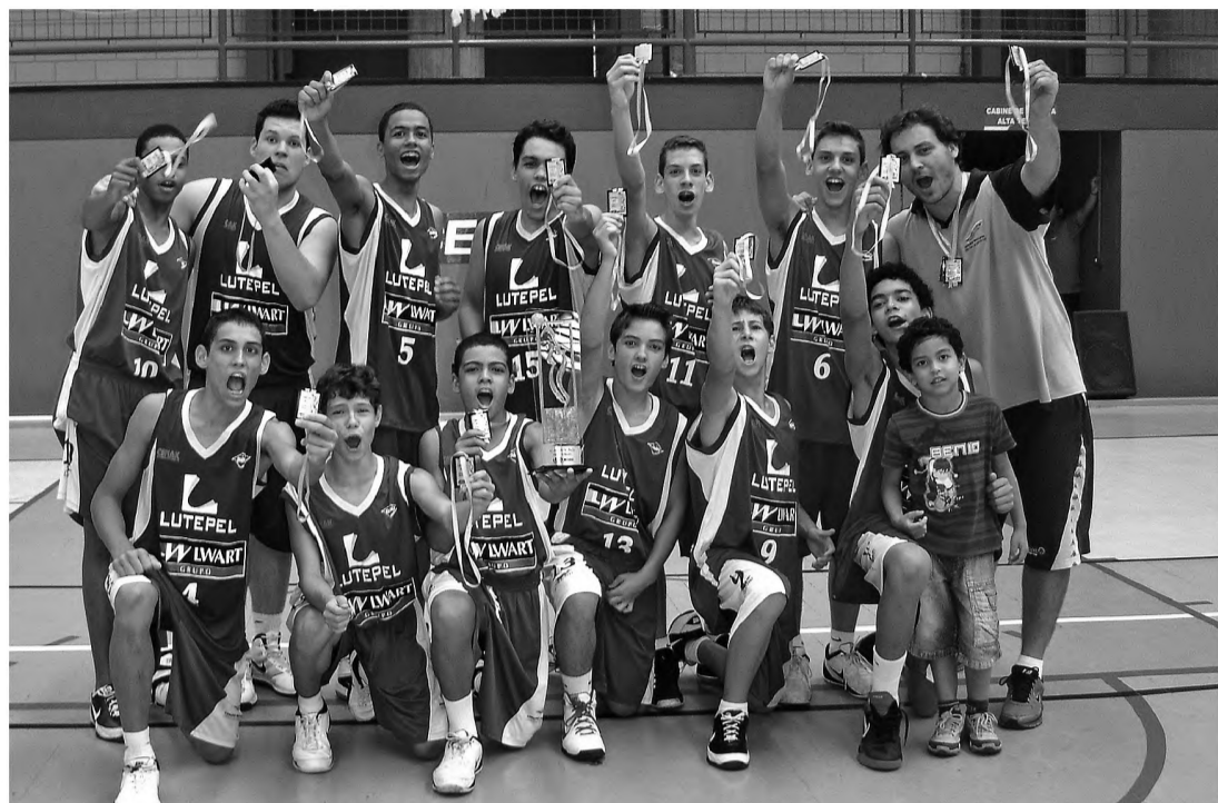
TÍTULO – Equipe sub-15 bateu Marília por apenas um ponto de diferença, em jogo marcado pela emoção

Com esse título, a equipe se igualou a equipe sub-16 que já havia conquistado o caneco na categoria, também sobre Marília. As equipes sub-12 e sub-13 também chegaram às decisões, mas perderam para Maracá.