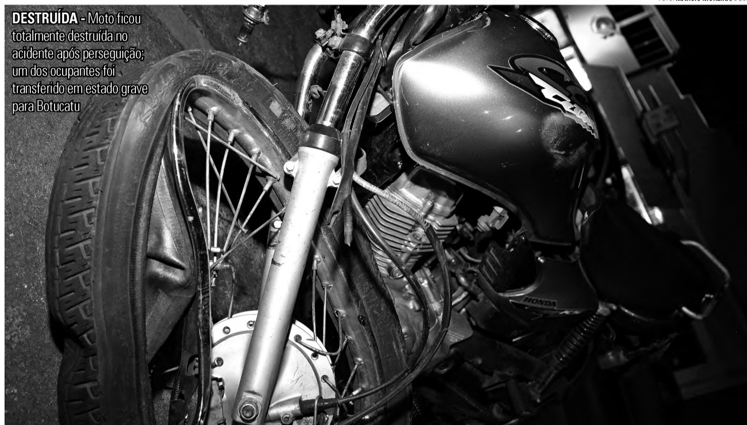
DESTRUÍDA - Moto ficou totalmente destruída no acidente após perseguição; um dos ocupantes foi transferido em estado grave para Botucatu

Dois menores suspeitos fugiram em uma moto e causaram acidente após entrar na contramão