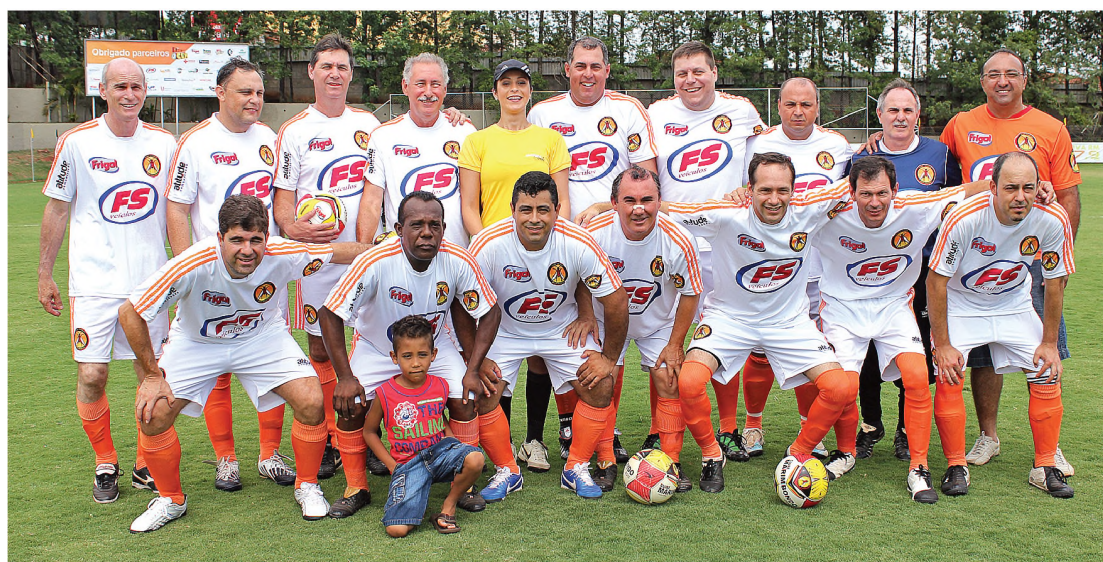
RAÇA FORÇA - FS Veículos/ Frigol conseguiu segurar o placar no primeiro tempo; Rocinha fez único gol da equipe