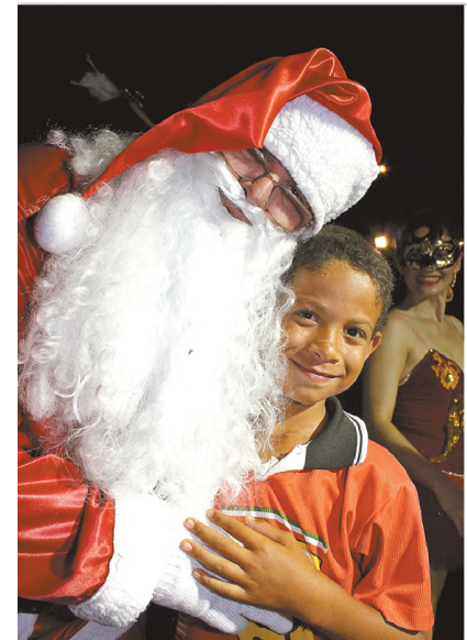
AFAGO - Criança recebe abraço cheio de carinho do bom velhinho no Vagulão