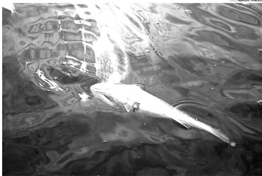
NATURAL - Especialista afirma que morte de peixes tem causa natural; problema aconteceu em Alfredo Guedes

"Há cerca de 20 dias não se registra chuva no município", explicou Aguiar, ao acrescentar que a redução do nível de água provocou a morte de peixes. "Não há ne-