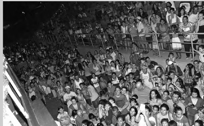
CHEGADA – Papai Noel chegou de paraquedas para delírio dos mais de 5 mil lençoenses presentes no Vagulão

Cerca de 5 mil pessoas compareceram ao evento