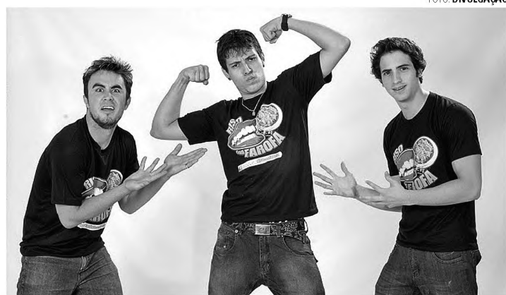
STAND UP – Última apresentação do ano promete divertir público lençoense

Na noite de hoje serão duas apresentações, uma às 20h e outra às 21h na Casa da Cultura.