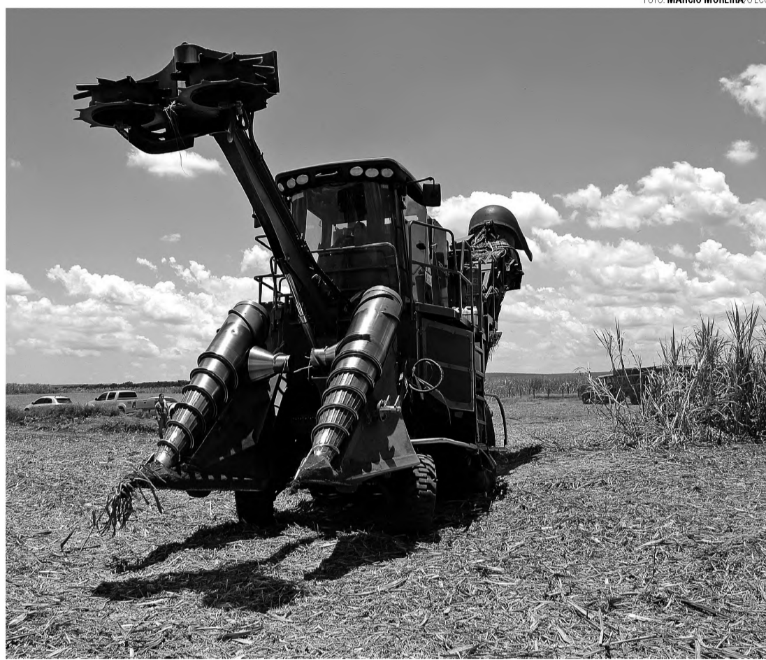
NOVOS TEMPOS - Mecanização da colheita da cana-de-açúcar avança nos campos da região