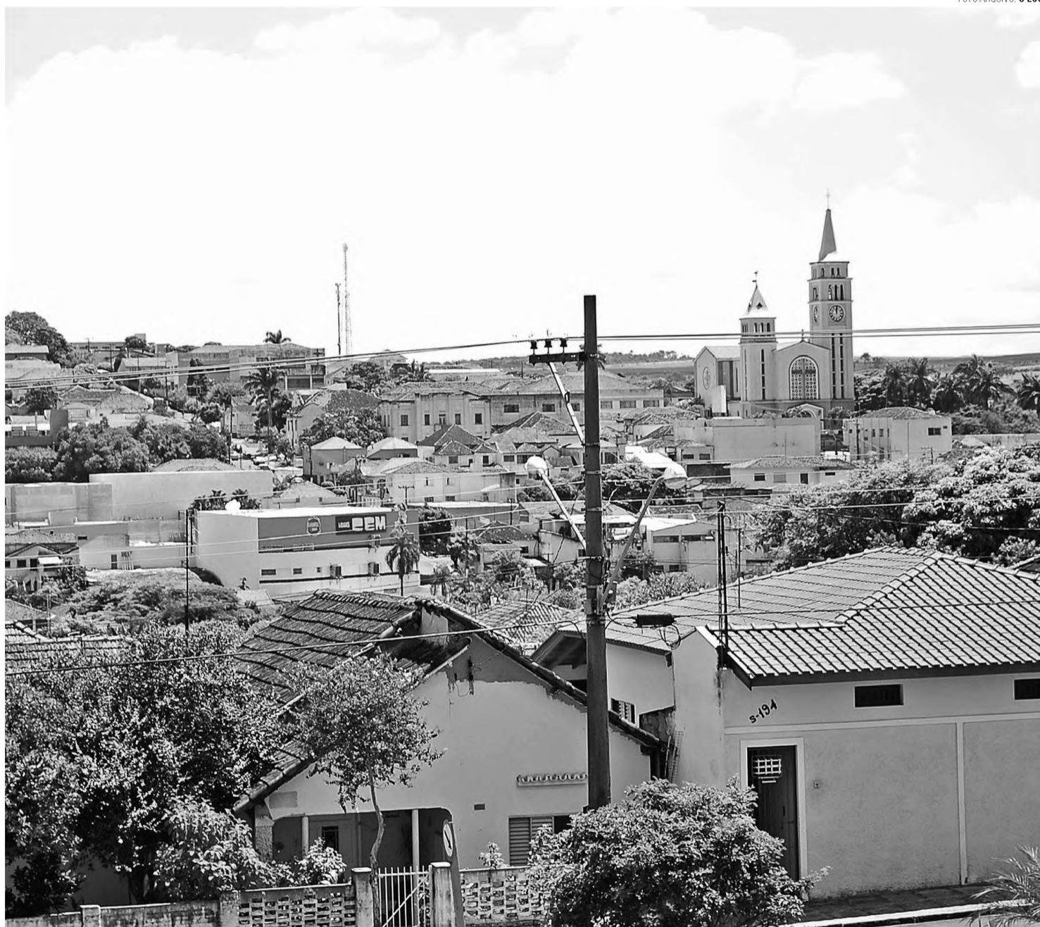
NOVAS VAGAS – Pederneiras foi a cidade que mais gerou emprego na microrregião em que circula O ECO; foram 1.515 novas vagas