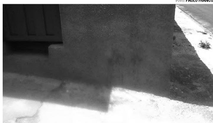
FACA - Vítima recebeu facadas nas costas; local ficou manchado de sangue

Após se envolverem em uma confusão, por volta das 4h, quatro homens foram colocados para