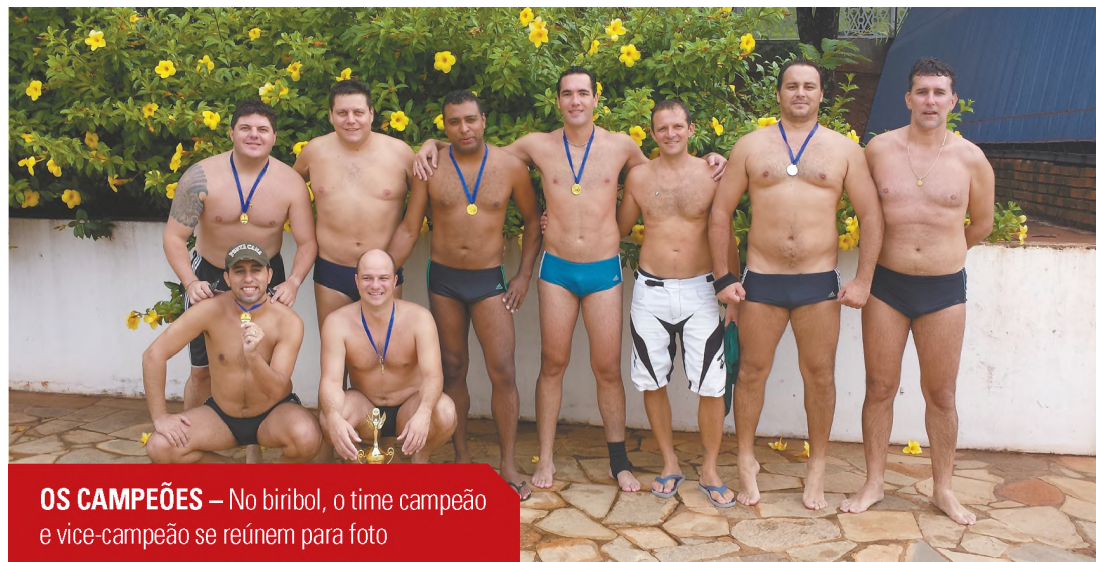
OS CAMPEÕES – No biribol, o time campeão e vice-campeão se reúnem para foto