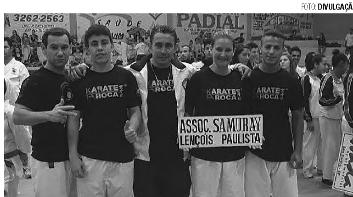
MEDALHISTAS - Cinco atletas lençoenses ganharam medalhas na primeira etapa do Campeonato Paulista de Karatê

Dia 6 de março, Nova Geração enfrenta Espaço Aberto e a Lutepel pega Amigos da Fisio. Na sexta tem Cruz Azul e Milenium e Independente e Prefeitura de Macatuba.