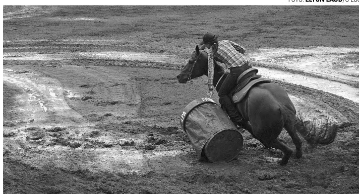
HABILIDADE – Atleta participa de prova do tambor durante Circuito Facilpa

Disputas de laço livre e team roping terminaram às 21h de domingo