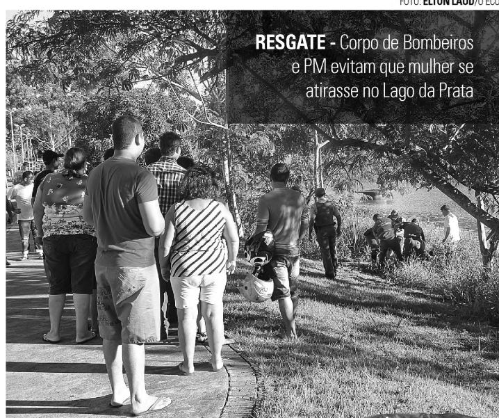
RESGATE - Corpo de Bombeiros e PM evitam que mulher se atirasse no Lago da Prata

Os bombeiros explicaram que a mulher estava às margens do lago