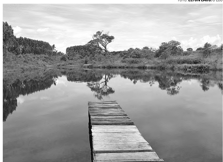
AFOGADO - Homem de 31 anos morreu afogado em lagoa da Casa do Oleiro; suspeita é de que vítima tenha sofrido câibras

A reportagem entrou em contato com a diretoria da Casa do Oleiro, que preferiu não falar sobre o assunto. A Polícia irá investigar as causas do acidente.