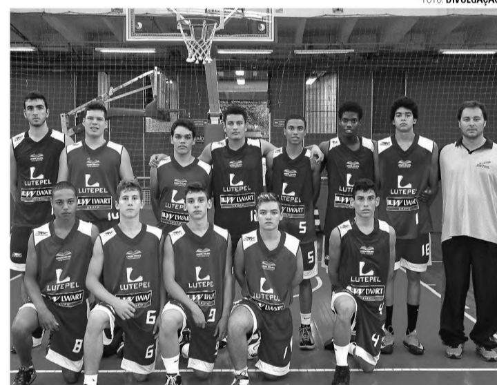
PEDREIRA - Sub-17 encarou a forte equipe do Paulistano