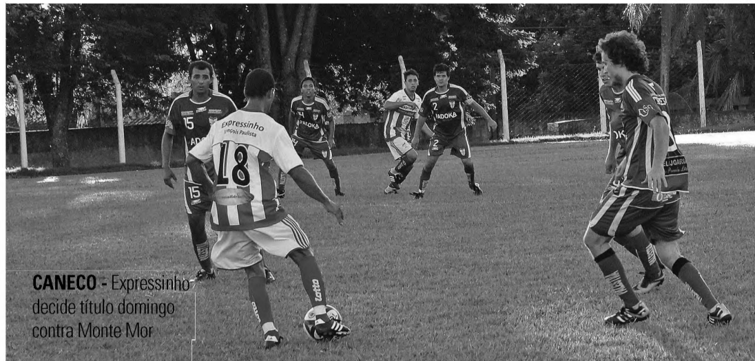
CANECO - Expressinho decide título domingo contra Monte Mor

Expressinho e Caçula entraram em campo determinados a vencer, mas o jogo foi complicado. As equipes até criaram chances de gol. O Expressinho marcou com William, o Caçula marcou com Narciso, mas foi apenas isso. O empate levou a decisão para os