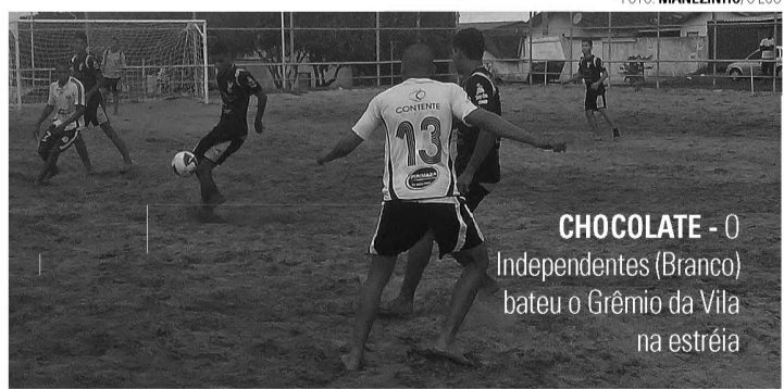
CHOCOLATE - O Independentes (Branco) bateu o Grêmio da Vila na estreia