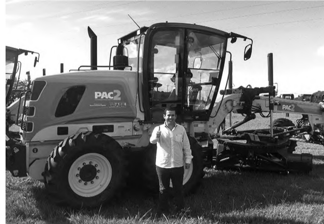
NOVINHA – Everton junto a nova máquina doada para Prefeitura

No início da tarde de terça-feira, dia 25 de março, o prefeito de Agudos, Everton Octaviani (PMDB) esteve na cidade de Araçatuba para receber uma máquina motoniveladora. O equipamento foi conquistado junto ao Ministério do Desenvolvimento Agrário, órgão ligado ao governo federal, que foi um dos realizadores da cerimônia de entrega das máquinas.