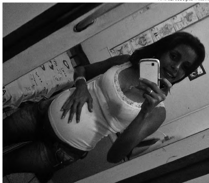
PRISÃO - Juiz decretou prisão preventiva de jovem que matou Maryssol

O promotor de Lençóis Paulista estava no Plantão Judiciário, em Bauru, na noite do acidente e pediu a prisão preventiva do jovem. A Justiça de Bauru indeferiu o pedido e arbitrou fiança de três salários mínimos (R$ 2.172,00), para que o jovem respondesse em liberdade.