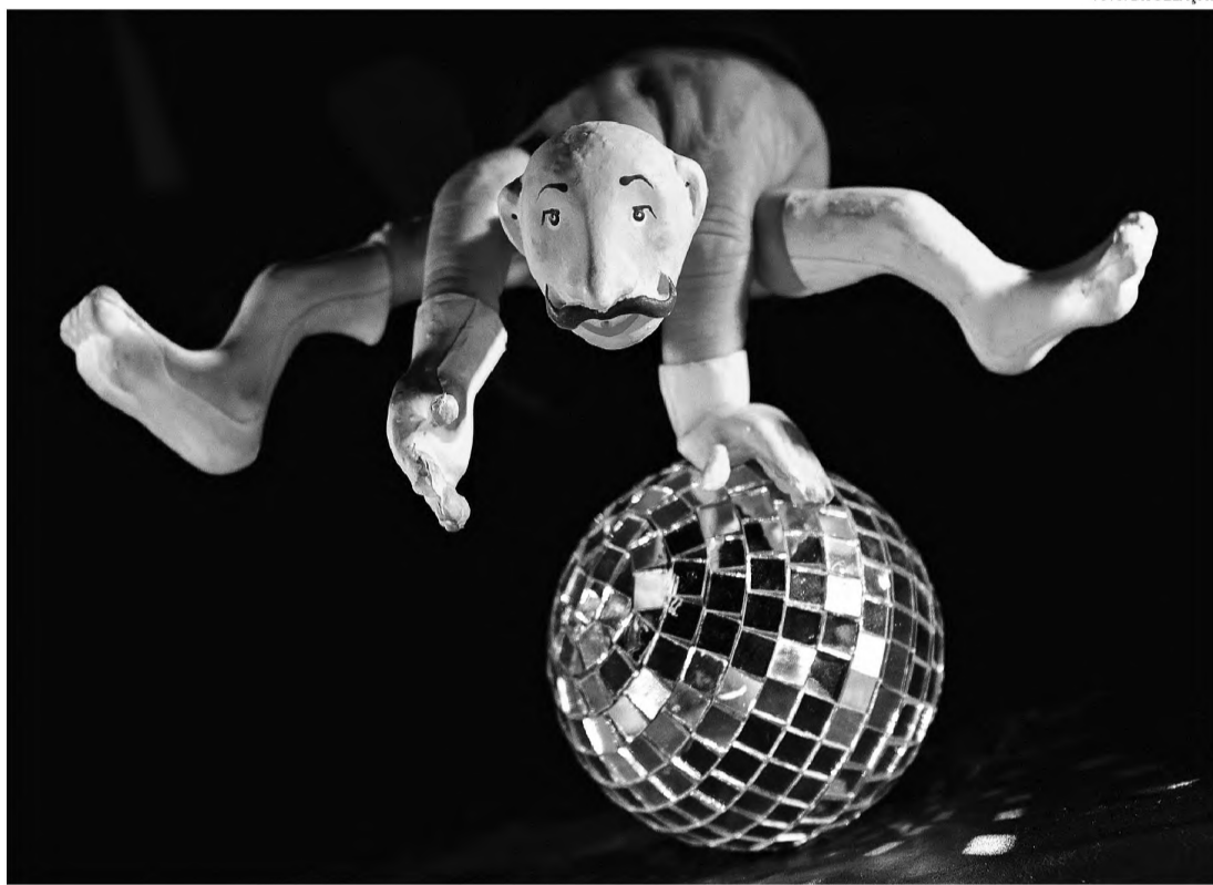
BELEZA – Festival Internacional de Bonecos chega a Agudos; peças são voltadas tanto a público infantil como adulto

A primeira apresentação ocorre na terça-feira, 8, às 17h30, com desfile de bonecos gigantes da Cia dos Ventos Brasil na Praça Tiradentes. Dia 9, a partir das 9h, o público poderá conferir o espetáculo internacional "Trapos y Carton", da Cia Concolocorvo, do Peru. Já na quinta-feira, 10, o Seminário recebe às 15h o número "Palhaço Tomate", da Cia Vitor Tomate Avalos, da Argentina. E dia 11, às 15h, a Cia Mariza Basso Formas Animadas