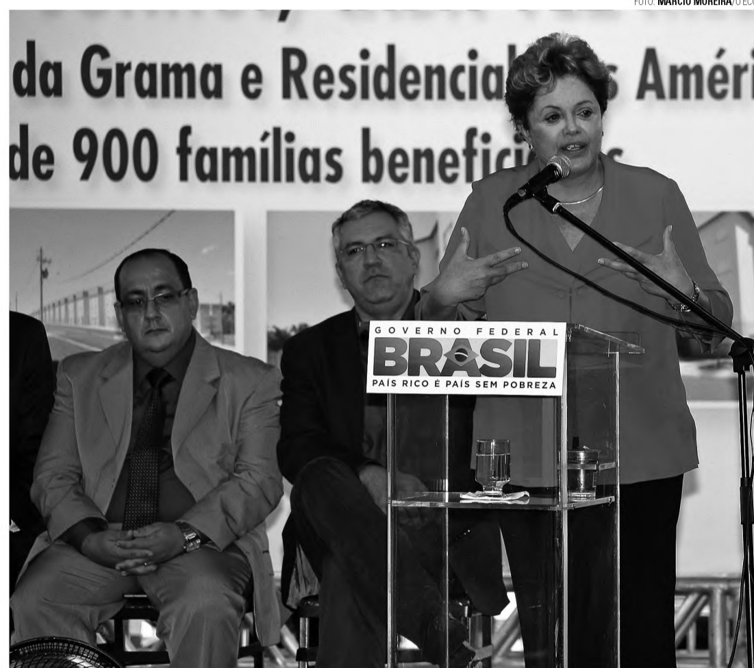
PROMESSA - Dilma prometeu a construção de universidade federal e a criação do curso de medicina em Bauru

Apesar da expectativa, a presidente não concedeu coletiva de imprensa e apenas discursou aos presentes. Ela agradeceu a hospitalidade dos